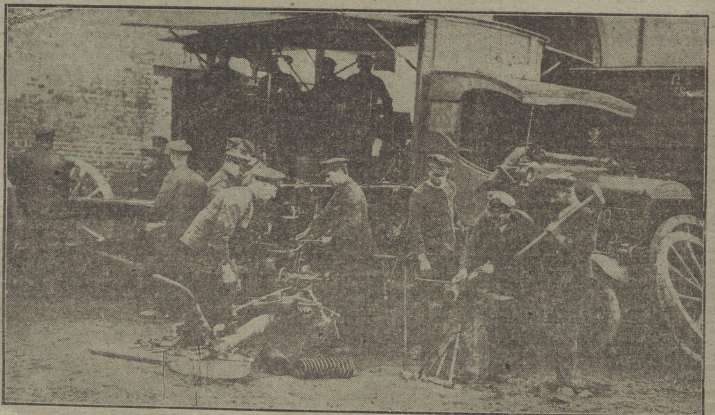
LAS NECESIDADES DE LA GUERRA.—Soldados alemanes en un taller-automóvil, trabajando en la reparación de cañones.

En la Cámara de Bucarest declaró Arion, respecto a la pregunta sobre la