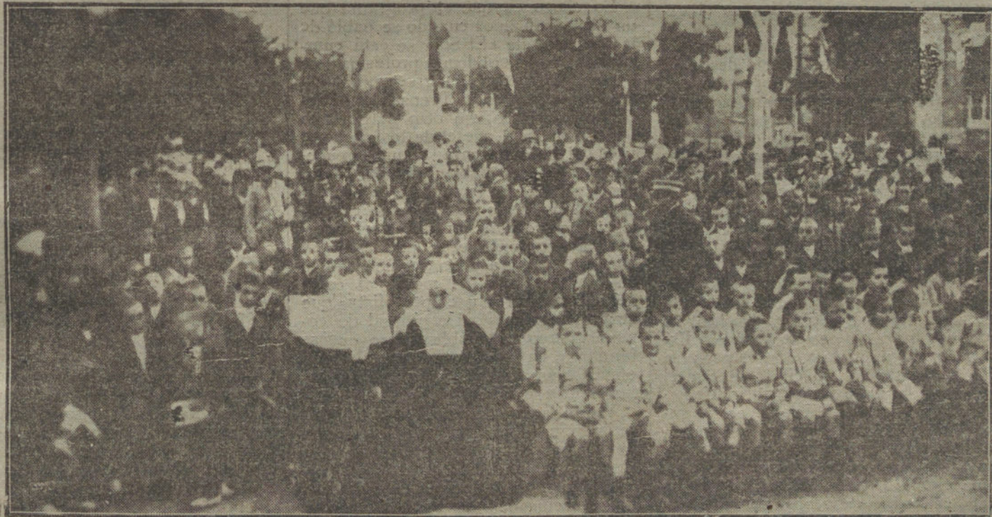
Los niños recogidos en el Asilo de la Paloma presenciando los festejos verificados ayer en dicho centro benéfico.