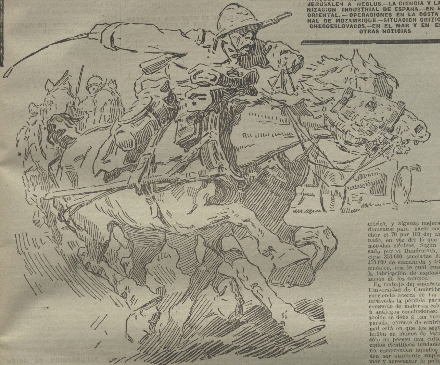
Artillería francesa dirigiéndose a la línea de fuego. (Dibujo de AGUSTÍN.)

ATAQUES PARCIALES ALREDEDOR DEL OISE.—DE JERUSALEN A NEBLUS.—LA CIENCIA Y LA REORGANIZACIÓN INDUSTRIAL DE ESPAÑA.—EN EL AFRICA ORIENTAL.—OPERACIONES EN LA COSTA MERIDIONAL DE MOZAMBIQUE.—SITUACIÓN CRÍTICA DE LOS CHECOSLOVACOS.—EN EL MAR Y EN EL AIRE.—OTRAS NOTICIAS