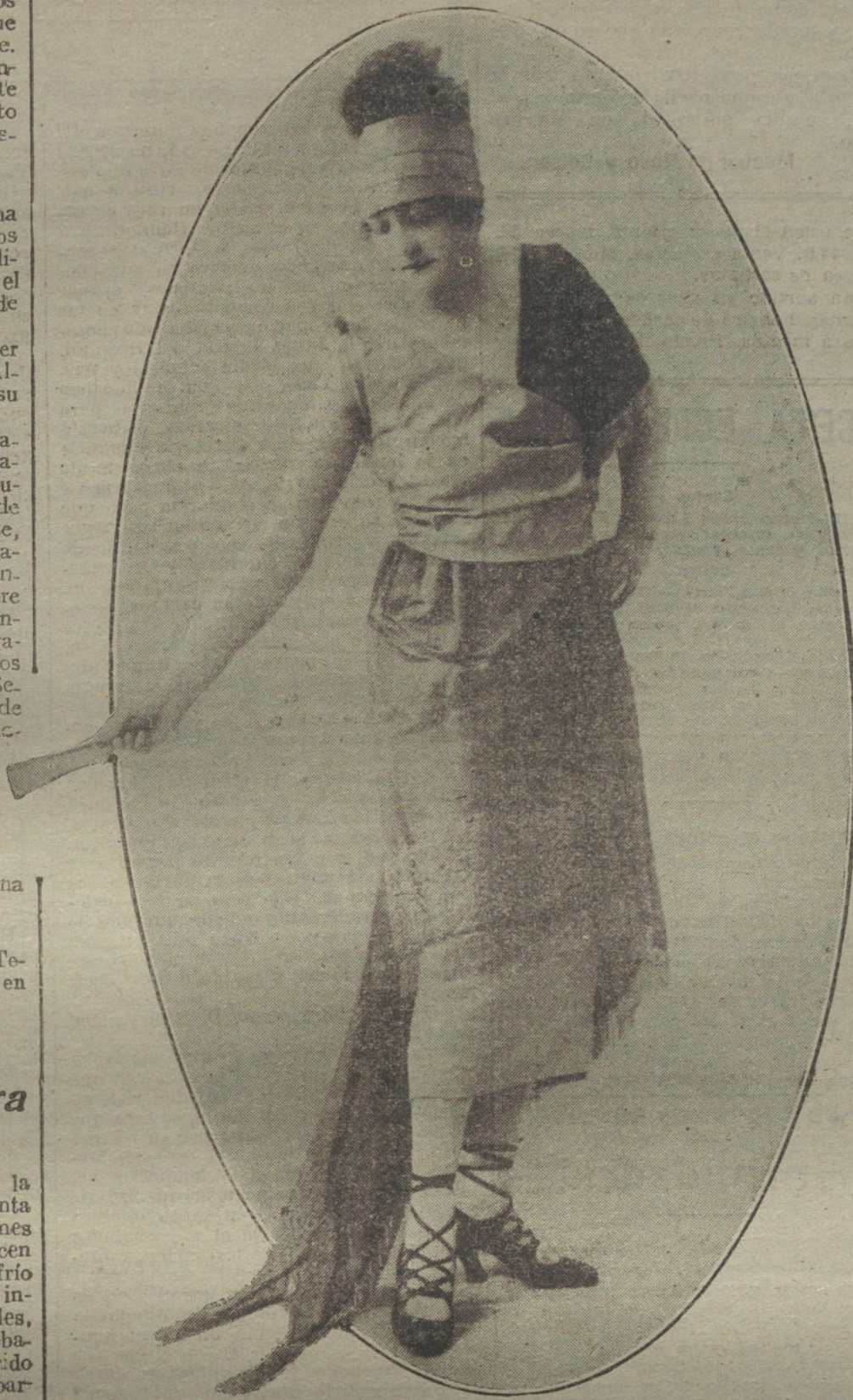
Traje de salón, en raso, sedas, gasas y tisú de oro, modelo de la casa Genovieve.