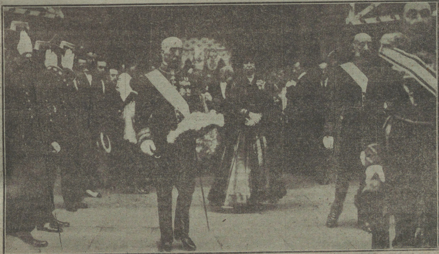
EL VERANO EN SAN SEBASTIAN.—S.M. la Reina Cristina saliendo de la tradicional salve de la iglesia de Santa María.

Los padres de los alumnos perjudicados en Barcelona han dirigido también al ministro una solicitud en idéntico sentido.