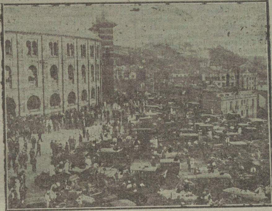
Aspecto de los alrededores de la Plaza de Toros de San Sebastián durante la celebración de las corridas de la Semana Grande.

CRÍA BUENA FAMA, Y DESPUÉS... CRÍA LO QUE CUSTES. UNA ESTO. CADA, VARIOS PARES DE BANDERILLAS Y MUY POCAS COSAS MAS. UN PALOMINO QUE ES UN AGUILA