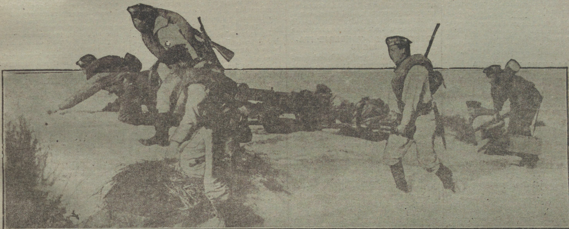
Marineros alemanes, en las costas de Flandes, avanzando con ametralladoras en posición.

LOS PROCESOS POR ESPIONAJE.—EL CASO HUMBERT Y EL CASO CAILLAUX.—LA LUCHA EN FRANCIA.—EN EL FRENTE ITALIANO.—EN PALESTINA Y EN ARABIA.—PEQUEÑAS ESCARAMUZAS.—EN EL ESTE AFRICANO. LOS COMBATIENTES TOMAN POSICIONES.—RUSIA Y LOS RUSOS.—TROPAS AMERICANAS EN VLADIVOSTOCK. EL GENERALISIMO DE LAS TROPAS CANADIENSES.—EN EL MAR.—BOMBARDEO DE PUERTOS NORTEAMERICANOS.—RADIOGRAMAS DE HOY