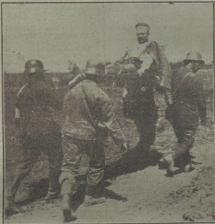
LAS VICTIMAS DE LA GUERRA.—Soldados alemanes transportando heridos.

El ministro pudo haber aplazado unos días su veraneo, pudo hasta haber conciliado el solaz reparador con sus obligaciones, pudo, en fin, si tan apremiante era el descanso, haber di-