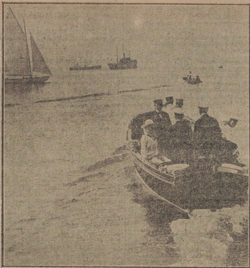
LA FAMILIA REAL EN SANTANDER.—S. M. la Reina Victoria dirigiéndose al balandro «Tonino», para tomar parte en las regatas de entrenamiento verificadas ayer.