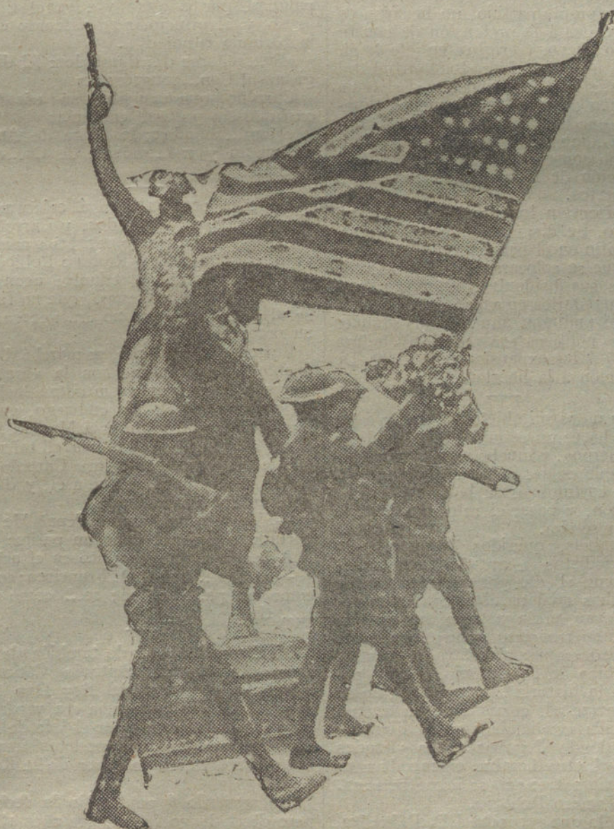
SAMMY EN PARÍS.—Los soldados norteamericanos desfilando ante la estatua de Washington en París.