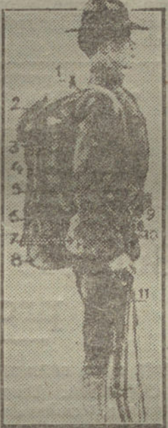
Equipo del soldado norteamericano.—1, bayoneta; 2, flambrer; 3, utensilio de tecedor; 4, pala; 5, casco; 6, manta; 7, bidón; 8, pie; 9, cinturón; 10, fusil.

Hervé ha perdido en absoluto la confianza que pudieron inspirarle. Desde el punto de vista de la capacidad, los generales británicos... Y aunque disimula, por «chauvinisme», su desengaño en lo que hace a los generales franceses, harto deja traslucir, sin embargo, ese desengaño, al afirmar que toda la