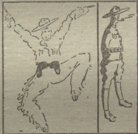
SILUSTAS DE SAMMY.—El yanqui, como se lo imaginan en Europa, y el yanqui tal como es en la realidad.