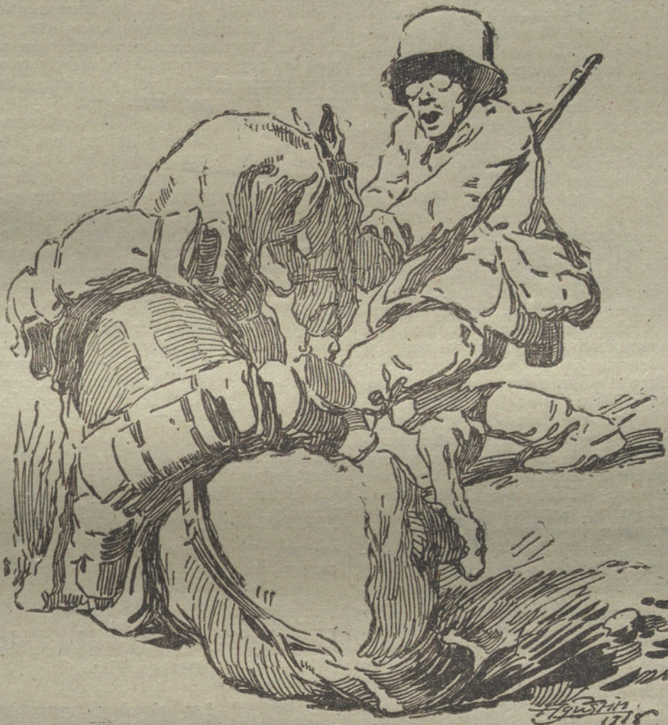
UN ACCIDENTE

Como el Gobierno que ocupa el Poder desde el 5 de Diciembre de 1917 parece haber rectificado en este punto y por lo que afecta a España, la conducta de los anteriores Gobiernos republicanos, nombrando ministro en Madrid a un hombre de altos prestigios, como el señor doctor Egas Moniz, y, por lo tanto, la política diplomática de los Gobiernos que se sucedieron en el Poder antes del advenimiento del Sr. Sidonio Pais pertenece ya a la historia, es lícito en este momento hacer la crítica del modo cómo