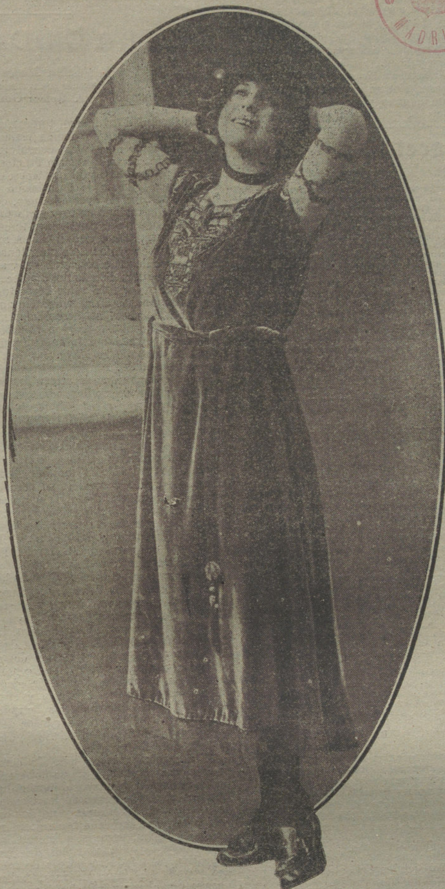
Traje, en tafetán, terciopelo ó seda, azul tes, bordado en oro, modelo creado por Mademoiselle Chistías.