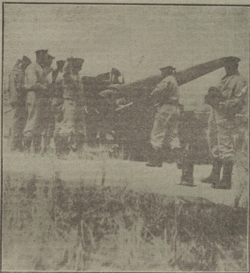
Cañón de largo alcance de la Marina alemana, utilizado en la defensa de los puertos belgas.

La política portuguesa, que siempre nos ha merecido erradamente un interés secundario, tiene hoy para todos nosotros una importancia capital.