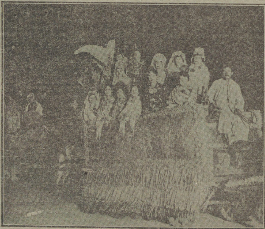
Un detalle de la cabalgata verbenista que en el barrio de las Vistillas, con motivo de la tradicional verbena de la Pafoma

En Santiago de Compostela, la respetable señora doña Carmen Ituarte de la Riva, viuda de Blanco Navarrete.