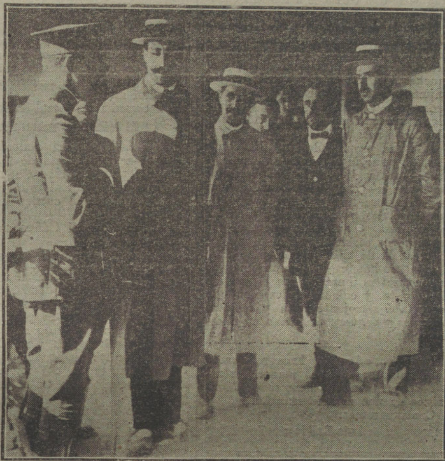
EL VERANEO REGIO EN SANTANDER.—S. M. el Rey conversando, en el campo de Tiro Nacional, con los capitanes Sres. Kindelán y Bonilla, campeones de varios concursos de tiro.

La medida fué puesta anoche mismo en práctica, encargándose de ejercerla funcionarios afectos al negociado de Prensa del ministerio, habiendo quedado establecidos turnos suficientes para que en todo momento puedan revisar los originales que sean presentados.