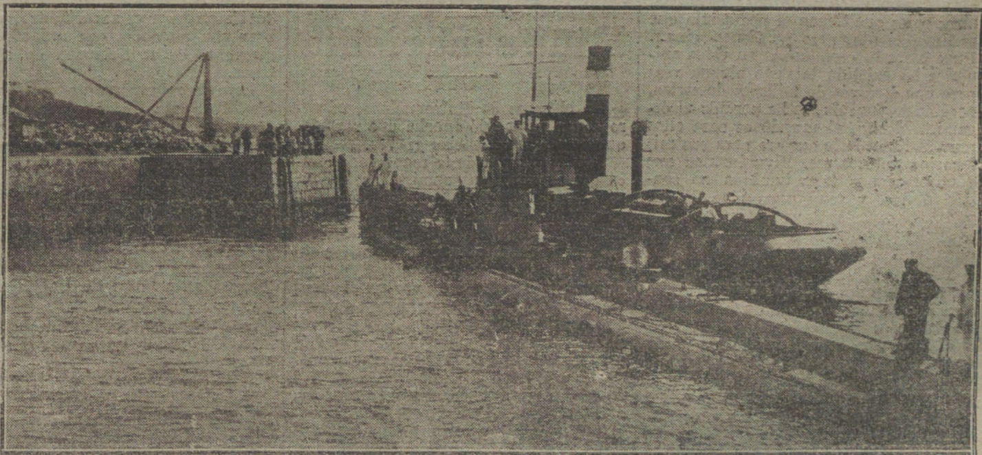
El submarino alemán «U-56», conducido por dos remolcadores y tripulado por marinos de guerra españoles, al ser trasladado desde el puerto al dique Gamazo, de Santander.

«Azorin» muestra una indudable predilección hacia las que él llama cosas pequeñas. Bien. Aceptemos la distinción un tanto arbitraria entre cosas pequeñas y cosas grandes. Montaigne gustaba mucho también de hablar de cosas pequeñas: como «Azorin», nos deseri-