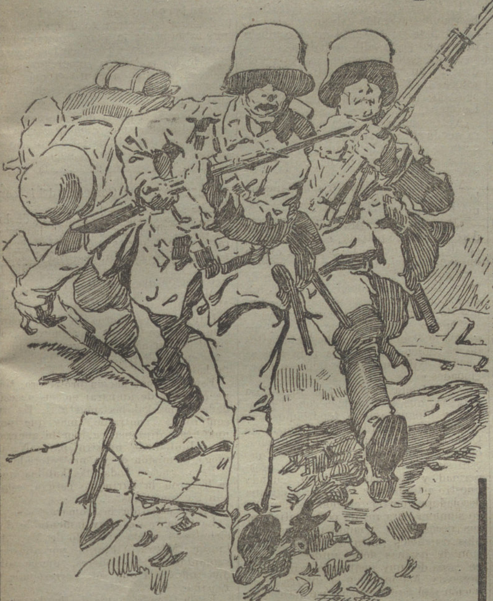
Soldados alemanes durante un reconocimiento. (Dibujo de AGUSTIN.)

SE COMPLICA EL PROBLEMA DE RUSIA.—VLADIVOSTOCK, CENTRO DE OPERACIONES.—LA GUARDIA ROJA, CONTRA EL GOBIERNO DE LOS SOVIETS. EL MANDO ALEMAN EN FINLANDIA.—HAMBRE EN SAN PETERSBURGO.—UN CRUCERO ACORAZADO FRANCÉS HUNDIDO.—OTRAS NOTICIAS DE LA GUERRA.—RADIOGRAMAS DE HOY