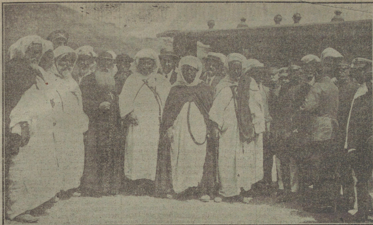
EL OBISPO DE FESSEA EN MELILLA.—Jefes de kabilas saludando al obispo á su llegada á las minas alicantinas.