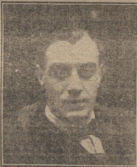
El baritono Gregorio Cruzada, que después de una brillante «turnée» por Levante, se dispone á hacer una nueva campaña en las provincias del Norte.

Esta eminente artista obtuvo un éxito colosal en la obra del insigne Benavente, titulada «La malquerida», de la que hace