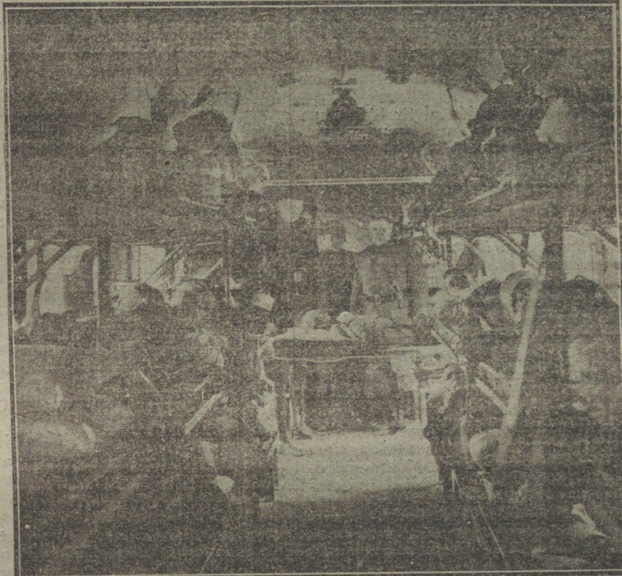
LAS NECESIDADES DE LA GUERRA.—Interior de un tren-hospital del Ejército norteamericano.

ese fin encaminadas, estamos seguros de que se adoptarán, para que, a la vez que se evitan los torpedeamientos que puedan mermar el tonelaje de nuestra Marina mercante, se evite también todo tráfico que no sea el lícito y natural de nuestras necesidades.