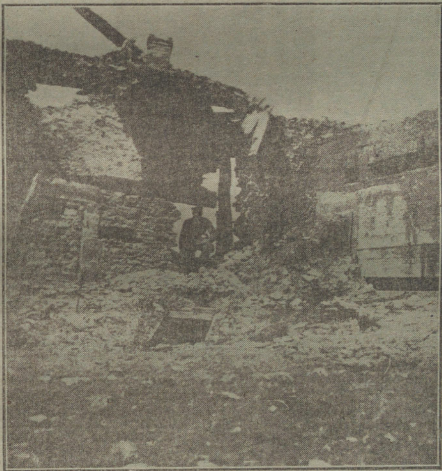
LAS ARMAS DE GUERRA. —Puestos de refugio para ametralladoras, construídos por los alemanes en el frente occidental.

Nosotros, sin prestar veracidad a ninguna de estas conjeturas, faltáramos al deber que tenemos contraído con el público si no las acogieramos en su conjunto para presentarlas a la consideración de los lectores hasta que las referencias auténticas, que no debieran demorarse en estos casos, desvanecieran la incertidumbre que el periodista menos perspicaz pudo palpar anoche en los lugares en que toda información tiene su asiento.