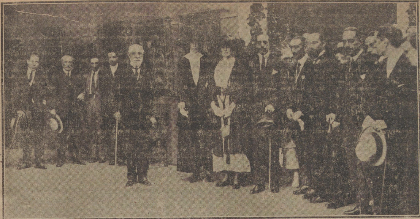
EL VERANO EN SANTANDER.—SS. MM. y la Duquesa de Aosta en el acto inaugural de la Exposición de Arte Montañés, organizada por el Ateneo.