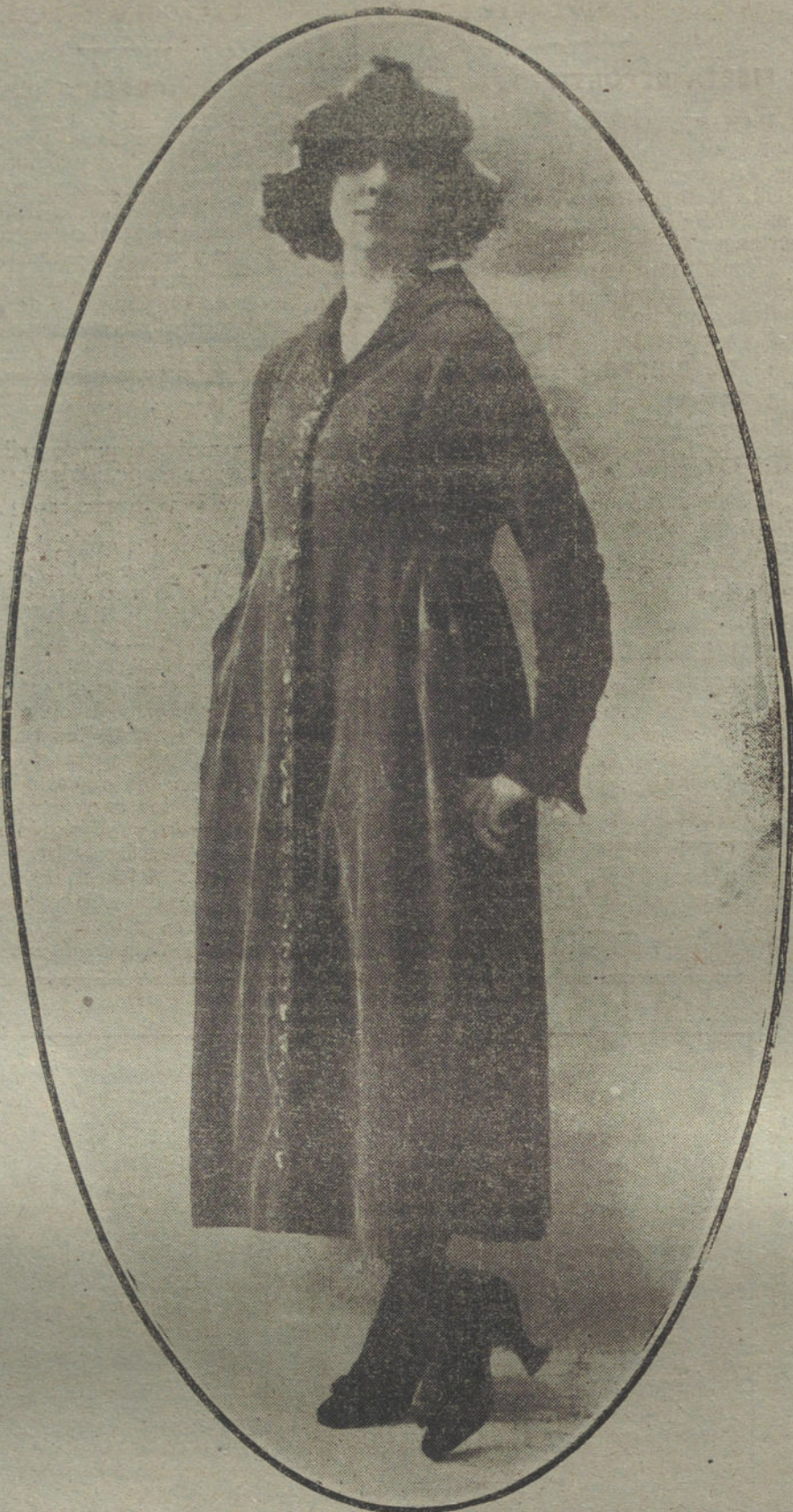
Senecillísimo traje-bata, creación de la casa Tollmann, para el próximo otoño.

sin beneficio del agricultor, elevaban con la especulación los precios.