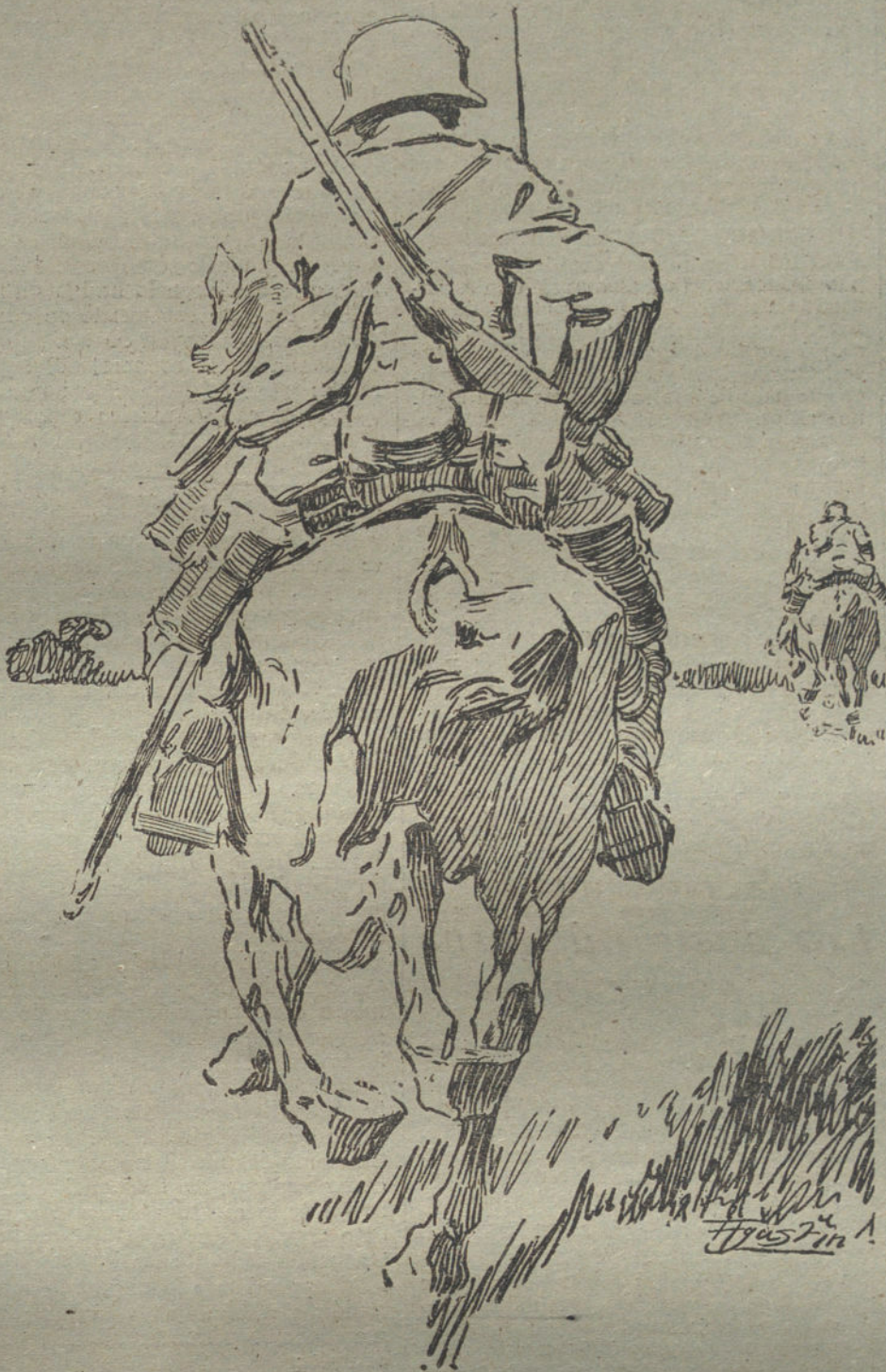
Patrulla de Caballería alemana durante una exploración. (Dibujo de AGUSTIN.)

Al Norte de Higwood, el enemigo contraatacó dos veces, después de hacer que nuestros elementos avanzados volvieran dos veces; pero su infantería fué detenida.