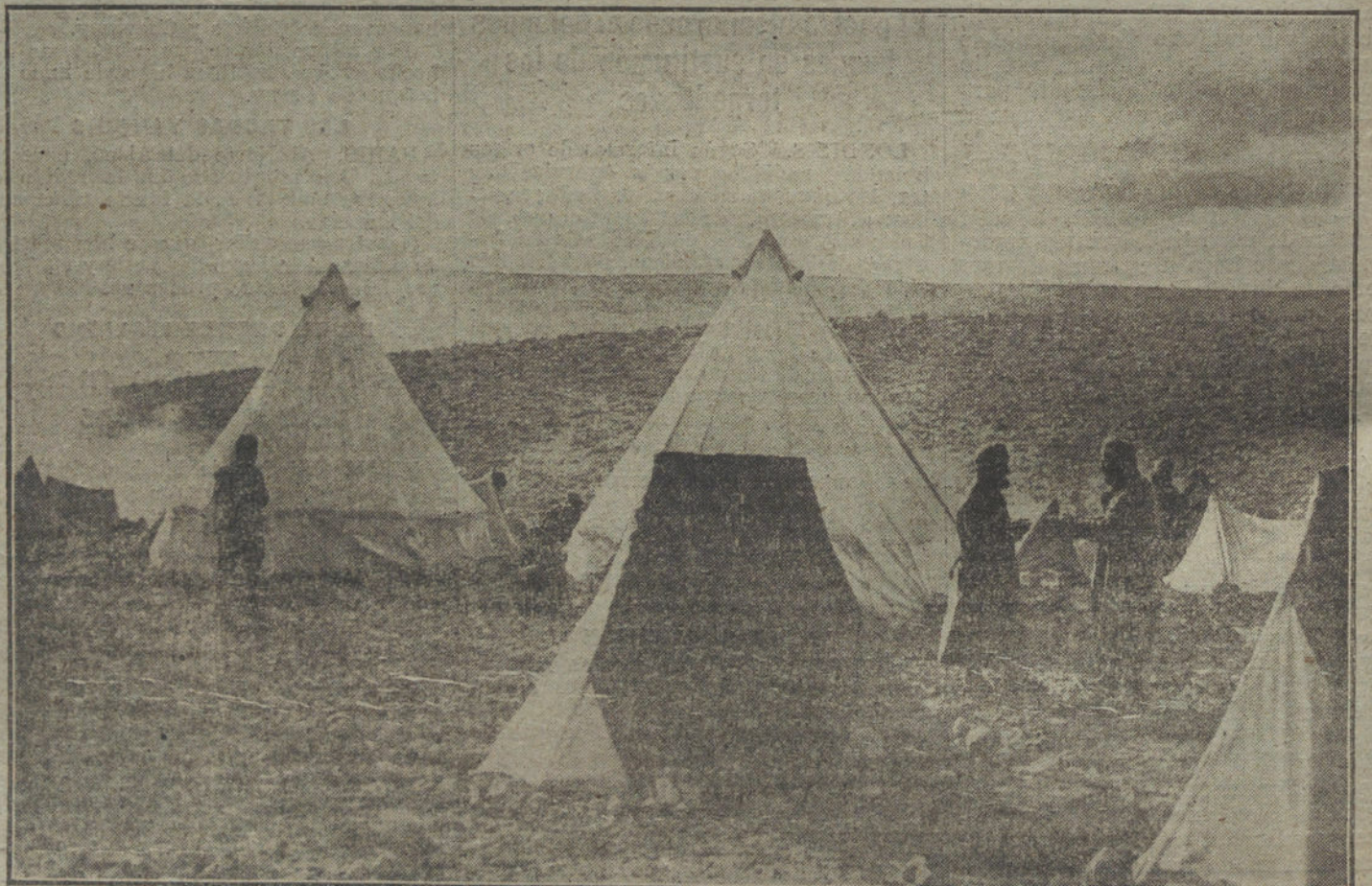
LOS FRANCESES EN ARABIA.—Un rincón del campamento de Onaida.

El Convenio suplementario germanorruso contiene también un acuerdo sobre el pago de cantidades por perjuicios causados en ambos países a súbditos. La fijación de las cantidades se basa en estadísticas ciudadanas, pre-