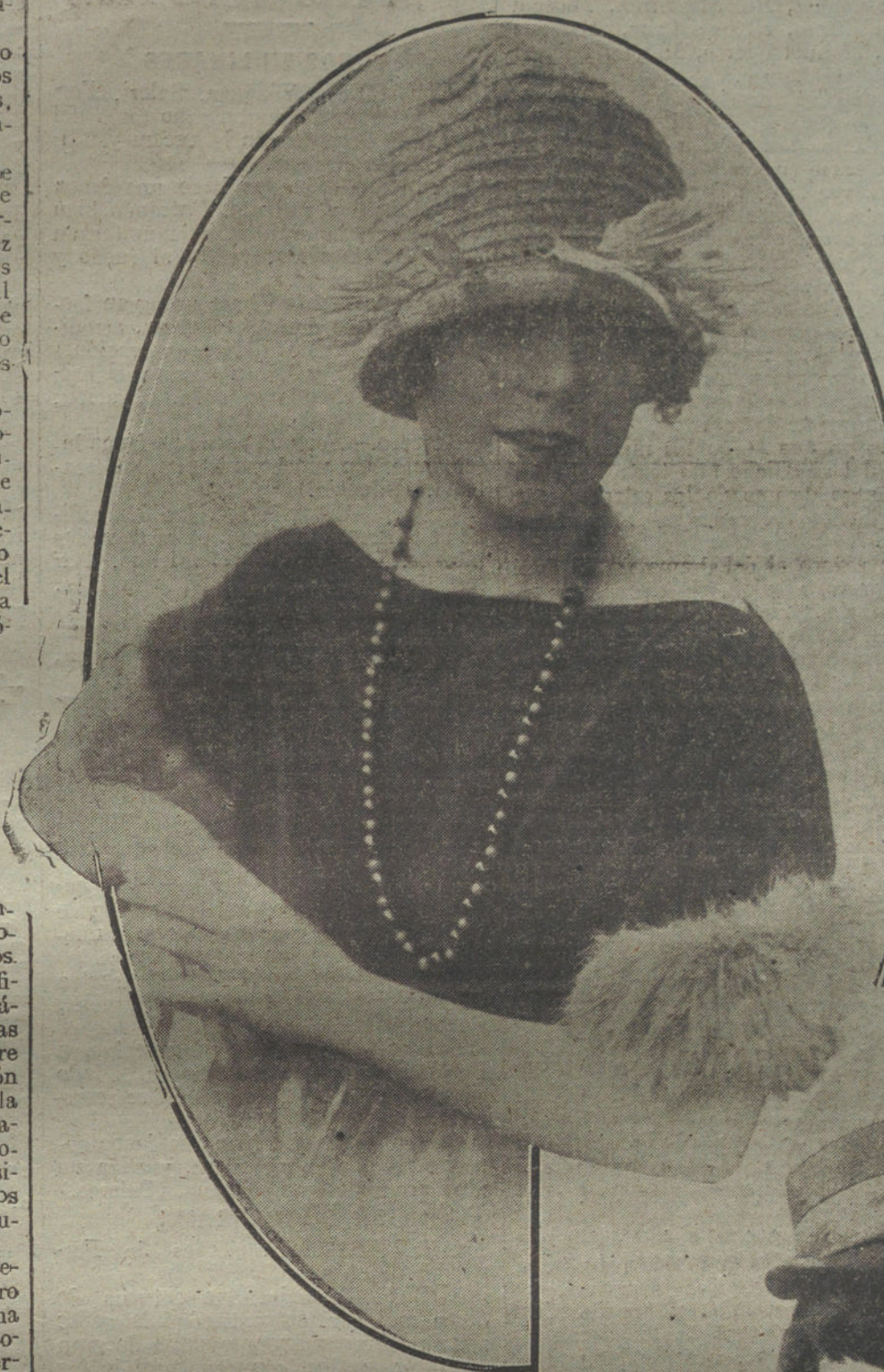
Modelos de gorras, para mañana, tipo francés, creados por la casa Ernestine.

por lo menos mientras sigan en vigor las disposiciones del Gobierno ruso sobre el derecho de herencia, y que el mencionado Convenio no puede ser hecho ilusorio mediante un impuesto sobre herencias.