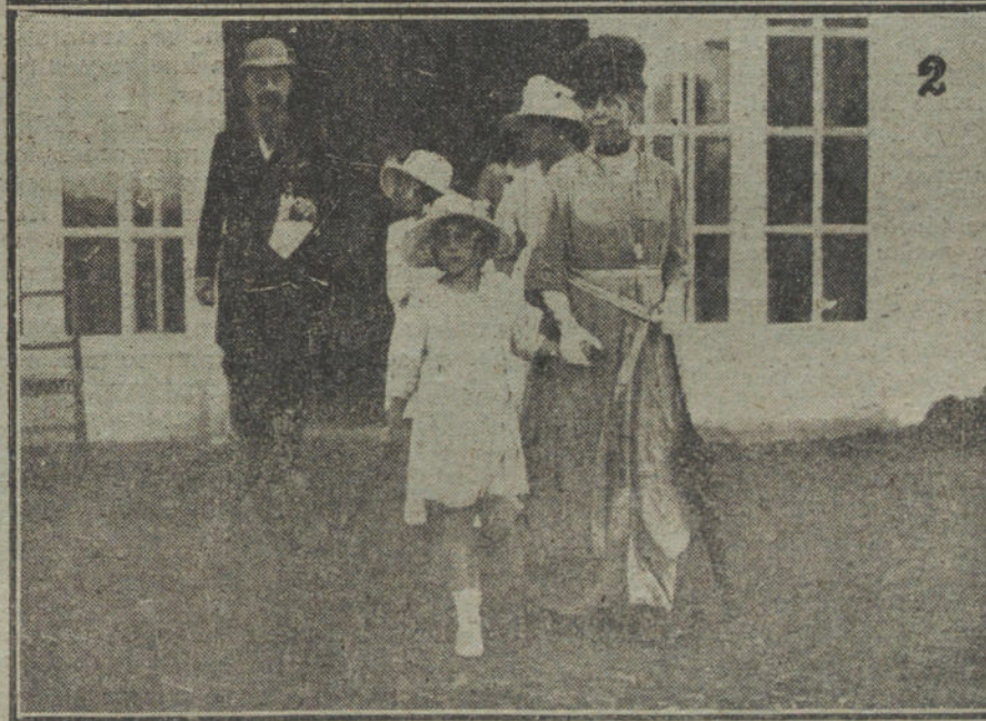
Número 1: S. M. la Reina Victoria con sus augustos hijos paseando por el Hipódromo de San Sebastián.—Núm. 2: S. M. la Reina Cristina y la Infanta Doña Cristina saliendo de visitar el pesaje de caballos de carreras.