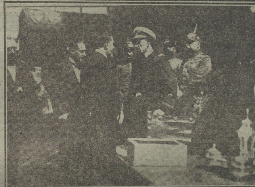
Número 1: S. M. el Rey presidiendo el solemne acto de la colocación de la primera piedra de la Biblioteca municipal de Santander.—Núm. 2: S. M. en el referido acto hablando con el hermano del ilustre Marcelino Menéndez Pelayo.