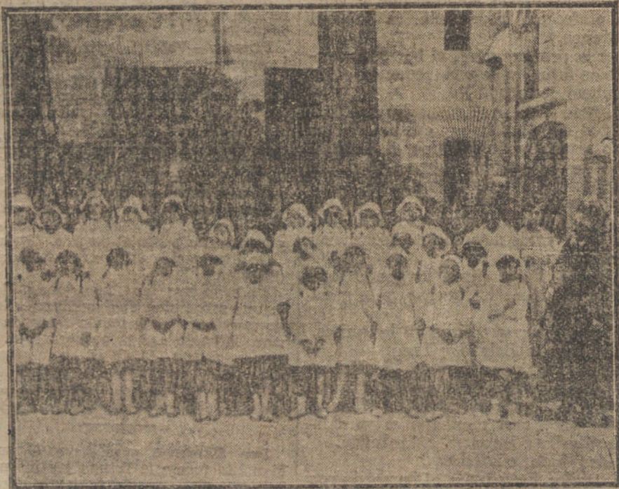
La colonia escolar de la Pedrera, organizada por el Comité Femenino de Higiene Popular, que ha regresado esta mañana á Madrid después de su excursión veraniega.

La facilidad con que se hace este viaje y la baratura de precios hará que se terminen los billetes, como siempre ocurre en esta Plaza.