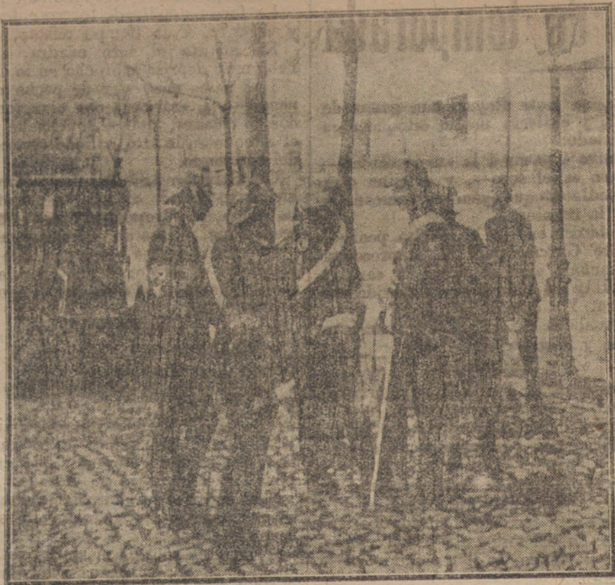
El infante Don Fernando después de tomar posesión del cargo de coronel de la Escolta Real, acto verificado esta mañana.