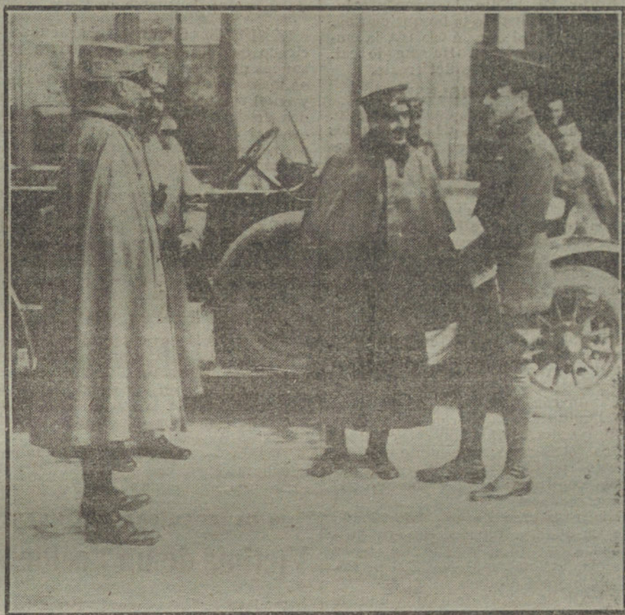
LAS ENSEÑANZAS DE LA GUERRA.—Agregados militares de los países neutrales disponiéndose á visitar el frente alemán en Francia.

También cayeron en poder de éstos, Bouchavesnes y Rancourt, logrando las huestes aliadas alzar los linderos del bosque de Saint-Pierre Vaast. Entre el Oise y el Aisne continuaron las tropas francesas su acción presionante; pero los reiterados ataques de los asaltantes se estrellaron contra la sólida firmeza de la resistencia teuto-