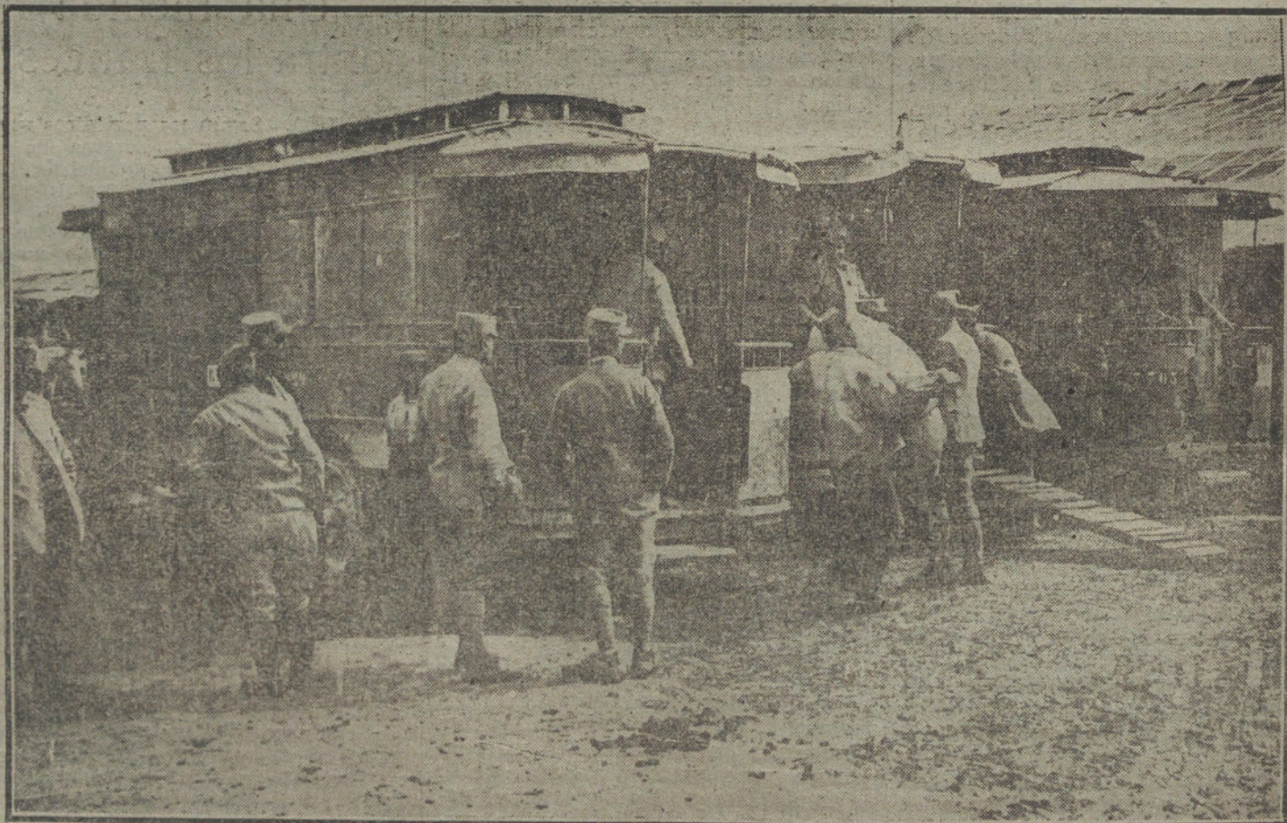
LAS NECESIDADES DE LA GUERRA.—Los antiguos «autobús» parisienses requisados por la Intendencia militar para el transporte de víveres desde la retaguardia de los Ejércitos hasta las primeras líneas de frente.

Deseo, sin embargo, expresarle en este día, a V. E. especialmente, lo mucho que yo estimo la confianza que tiene en mí, facilitándome así en alto grado mi labor.»