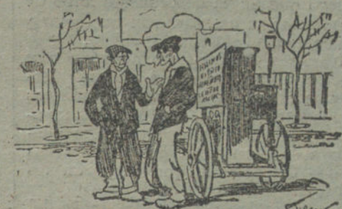
EL MANUBRIO LIBRE.—Y si el alcalde se pone tonto y no nos deja tocar... vamos a la huelga.

los hábitos, intrigas y banderías de una política funesta cuyos pecados purgamos aún.