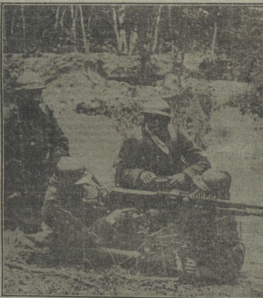
LA LUCHA EN EL FRENTE OCCIDENTAL.—Soldados franceses preparando una ametralladora.

Leemos en «Le Journal»: «El ilustre presidente de la Cámara de Comercio americano en París pronunciaba el 4 de