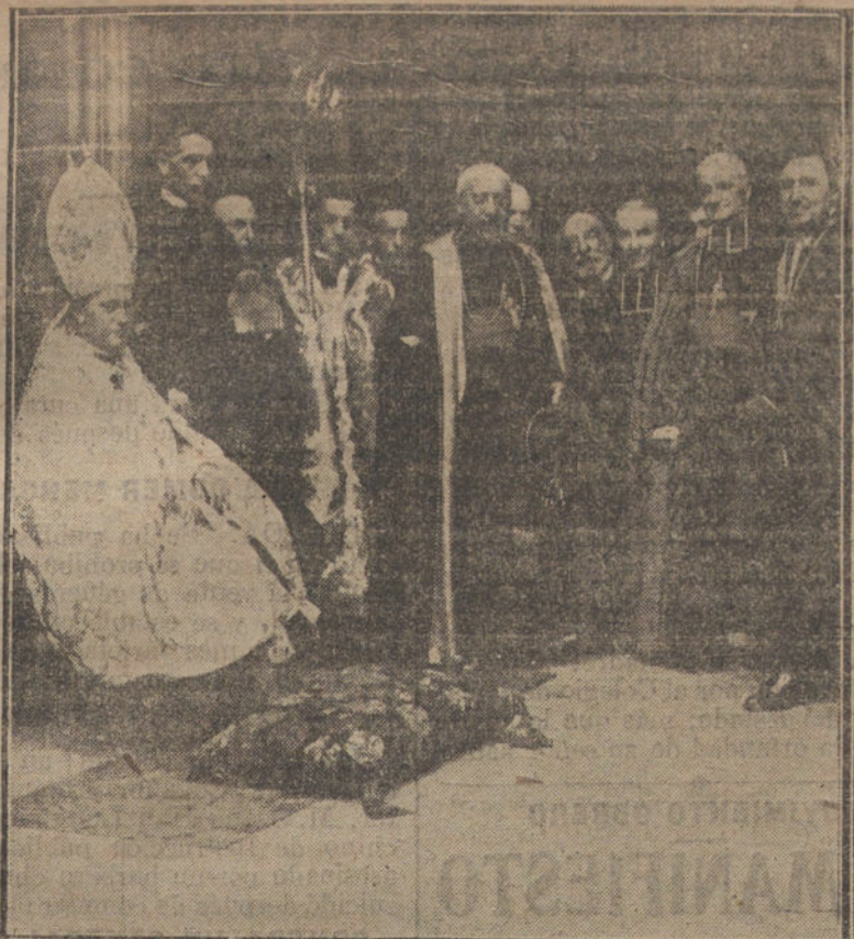
EL CONGRESO DE ESTUDIOS VASCOS. El obispo de la diócesis y los demás pre- lados invitados al acto esperando a Su Majestad el Rey. El Rey a su llegada a Ormaiztegui para presidir el Congreso de estu- dios vascos.