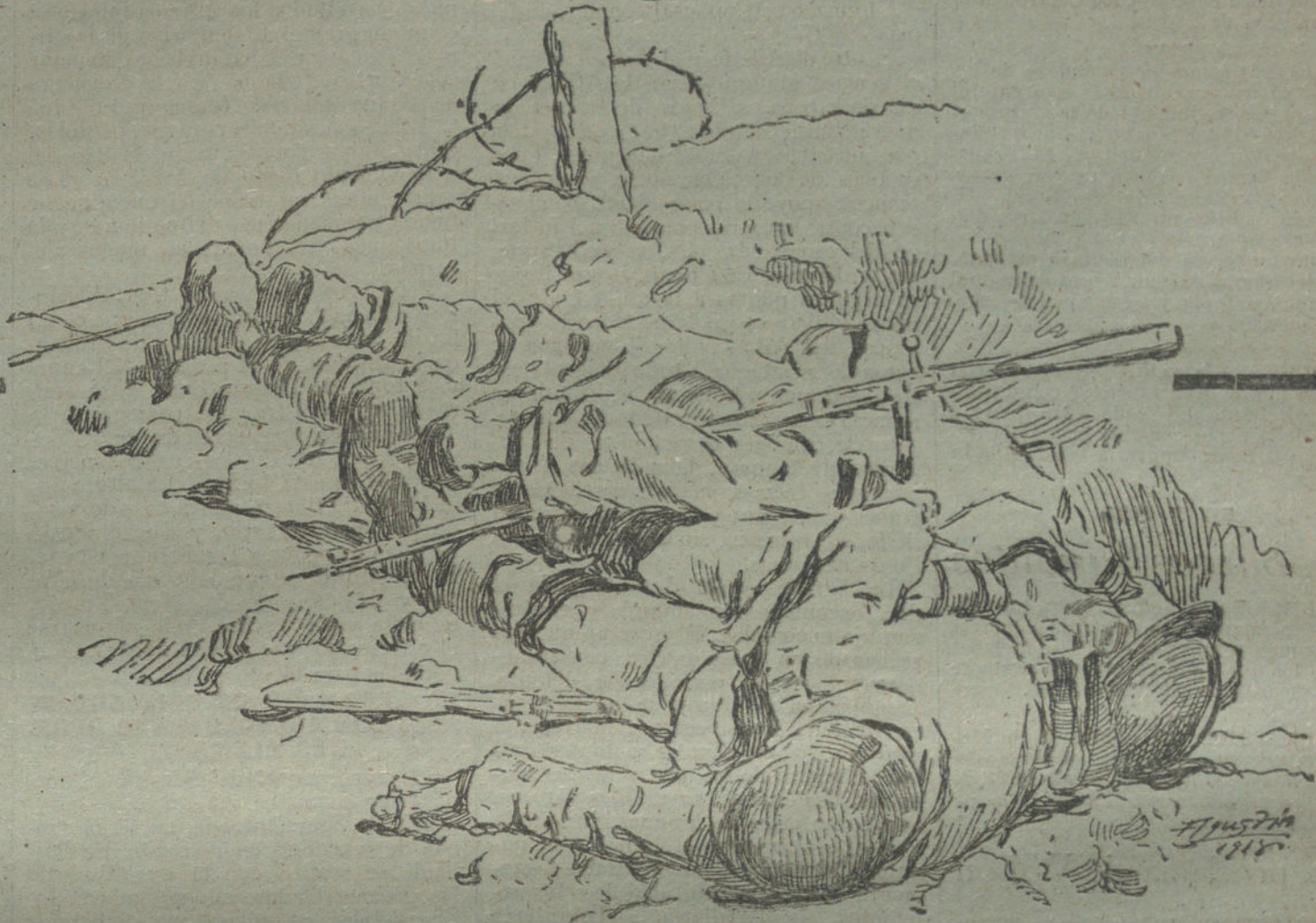
¡NI VENCEDOR, NI VENCIDO! (Dibujo de Agustín.)

Los franceses trataron de avanzar por ambos lados de Nesle, mediante ataques de grandes guerrillones escalonados. Emplearon, proporcionalmente, menor número de tanques, y, en cam-