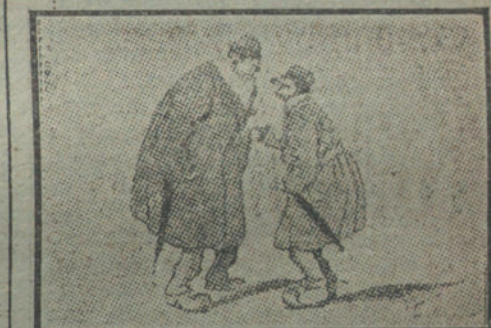
¡Y ASI ESTAMOS!—Escogéndonos, Gedeón; lo que hace falta es que noi amilitaricemos en muchas cosas... ¡que nos acivilicemos en otras.

«Sileno» nos ha ofrecido el caso más elocuente.