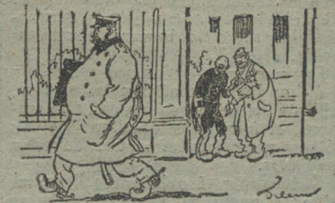
A LA SALIDA DEL CONSEJO.—¡Y los demás ministros, no salen?—¡Ahí van! ¡Los lleva D. Juan La Cierva en el bolsillo!...

Los aguafuertes de Goya son sátiras que han reproducido con toda fidelidad la decadencia aristocrática, social, artística, religiosa y científica de aquel momento histórico.