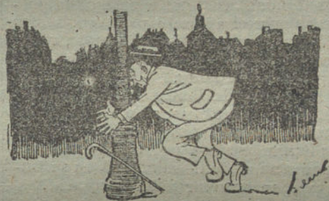
MADRID DE NOCHE.—¡Gracias a Dios que tropieza uno con un farol!

Con «Sileno» se han robustecido los valores de la caricatura política, que en España había tenido un vigoroso precedente con Francisco Ortego en la segunda mitad del siglo XIX, y aun con Alenza, si nos remontáramos a la época de «El Reflejo». Pedro Antonio Villahermosa, desde «Gedeón» principalmente, ha escrito media historia contemporánea, esa media historia que, por ser risa y lágrimas a la vez, sólo saben reflejar bien los caricaturistas. Un espíritu demasiado severo no acertaría a darnos la impresión grotesca y ridícula de los personajes políticos que prepararon y acentuaron con su inconsciente torpeza el desastre colonial, lo mismo que un temperamento demasiado burlón no podría recoger la amargura de aquellas horas tristes anteriores y posteriores a la catástrofe. Hacía falta el historiador reflexivo, el observador sagaz, el crítico sereno y riguroso, el narrador ameno, el cronista despabilado, hondo y agudo. Todo eso halló cómodo albergue en la inteligencia, siempre lozana y fluida, de «Sileno».