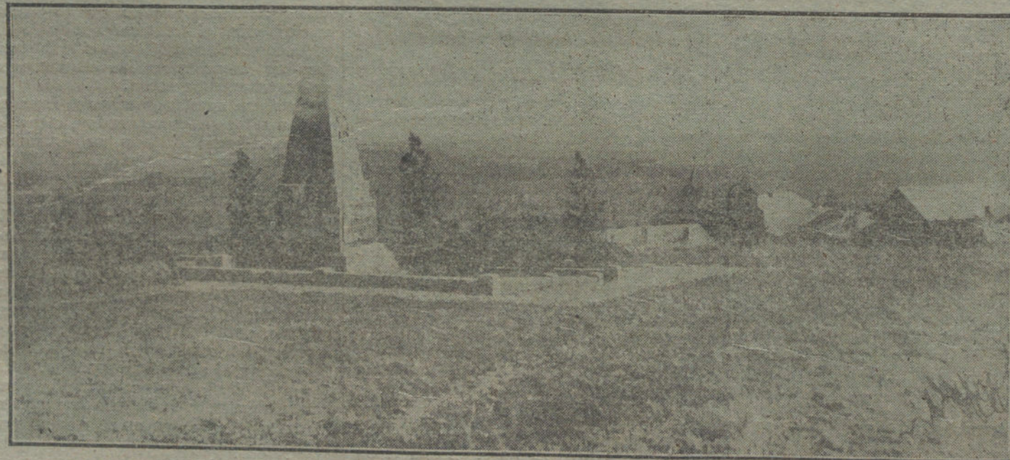
LAS VICTIMAS DE LA GUERRA.—Monumento á los muertos de la batalla del 27 de Agosto de 1914, levantado por 104 alemanes en el frente occidental, en la altura de Noyon, cerca de Sedán.

LONDRES. Comunican de Pekín que, según el parte del general Semenov fechado el 31 de Agosto, los aliados se apoderaron de Ojoviana, por medio de un movimiento envolvente. Hicieron prisioneros y se apoderaron de cuatro cañones y de