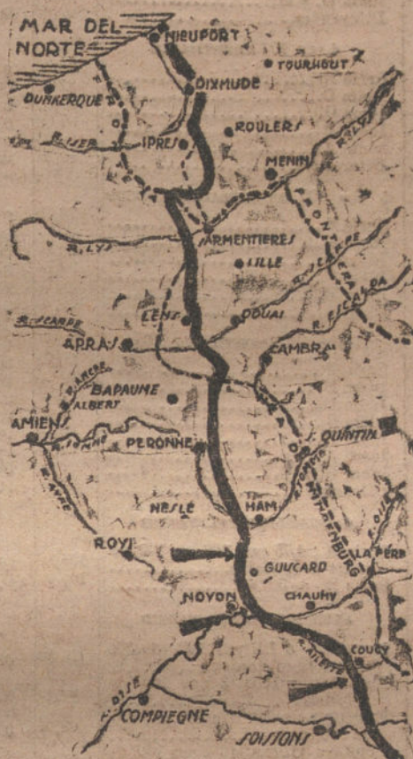
Cercanías del Ailette, donde han tenido lugar los últimos ataques franceses.

KOENIGSWUSTERHAUSEN (4 de Septiembre, a las tres de la tarde.)