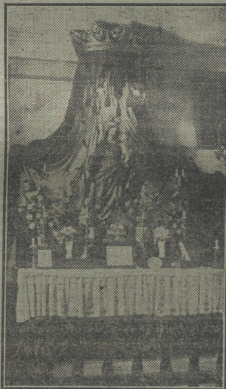
Capilla donde se venera la tradicional imagen de la Virgen de la Esperanza.

te todos los nobles de España, iba creciendo en autoridad y prestigio para cuanto se relacionaba con los santos y humanitarios fines que se perseguían. Y así vivió hasta el año 1734, fecha en que se instituyó en esta corte la Santa y Real Hermandad de María