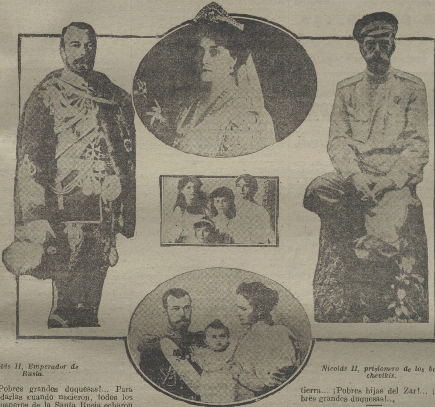
Nicolás II, Emperador de Rusia.