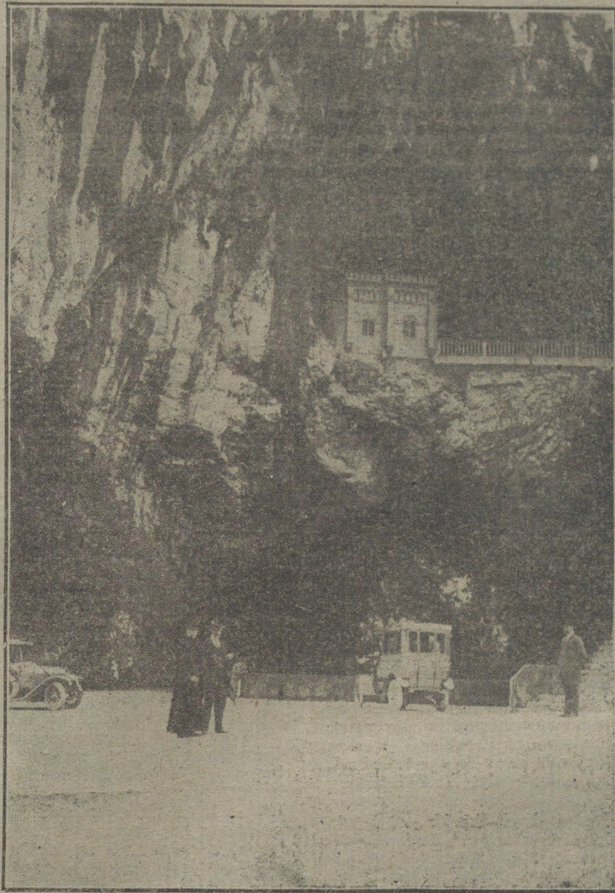
EL CENTENARIO DE COVADONGA.—Histórica cueva.

La leyenda decía, graciosamente: «En fin, ¡libre del Sr. Vasconcellos, por unos días!»