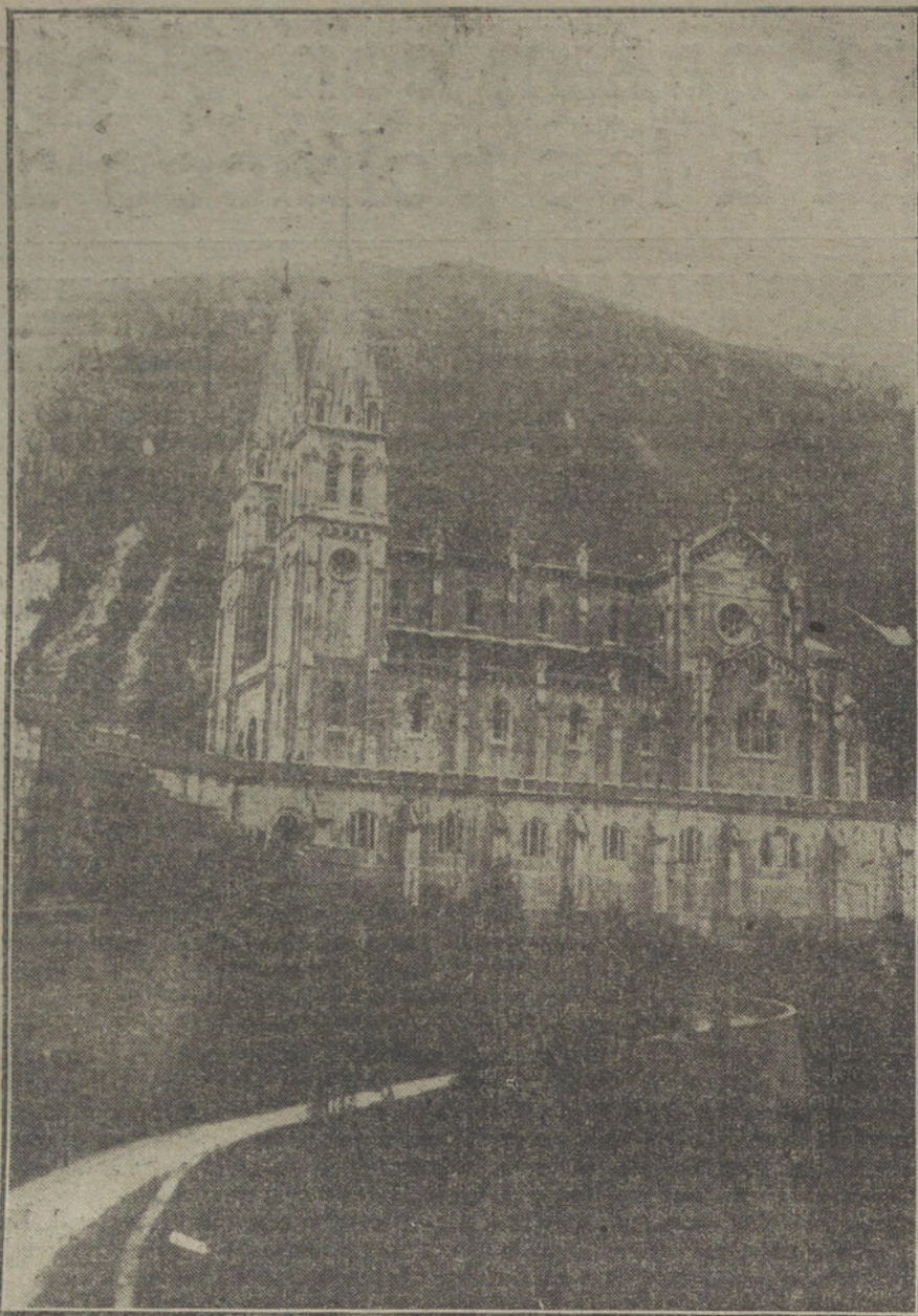
EL CENTENARIO DE COVADONGA.—La Basílica.

«Los aliados han ocupado Obozerskaya, haciendo 150 prisioneros é infligiendo graves pérdidas, después de severas luchas el Usuria»