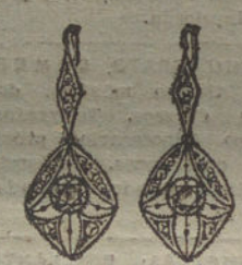
Núm. 9.—4 brillantes y diamantes.