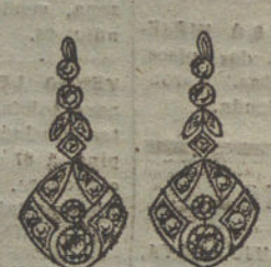
Núm. 11.—8 brillantes y diamantes.