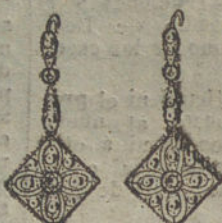
Núm. 2.—4 brillantes y diamantes.