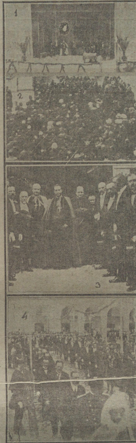
Núm. 1: Aspecto del estrado durante la solemne sesión de clausura del Congreso de Estudios Vascos, en Oñate.—Núm. 2: Un aspecto de la sala durante el acto.—Núm. 3: Autoridades que presidieron la clausura.—Núm. 4: Un detalle de la típica procesión, á usanza antigua, verificada como final de las fiestas.