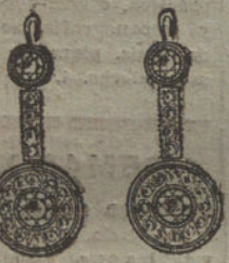
Núm. 7.—4 brillantes y diamantes.