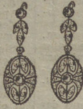
Núm. 3.—4 brillantes y diamantes.