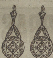
Núm. 6.—2 brillantes y diamantes.