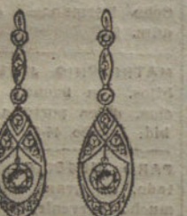
Núm. 10.—6 brillantes y diamantes.