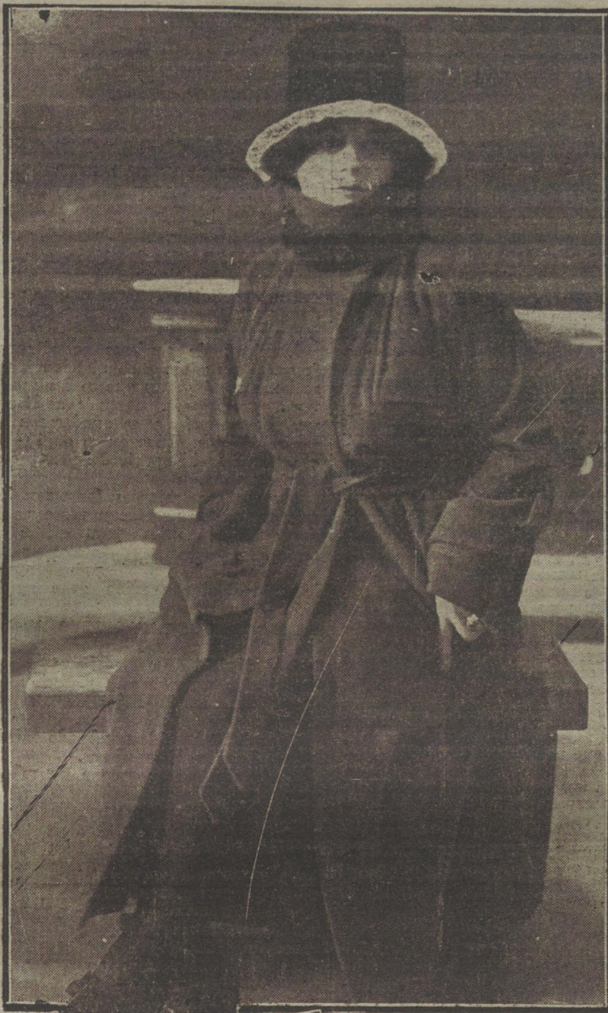
Abrigo y gorra de otoño, modelo de la casa Michel, que ha tenido gran aceptación.