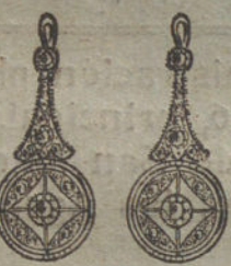
Núm. 4.—4 brillantes y diamantes.