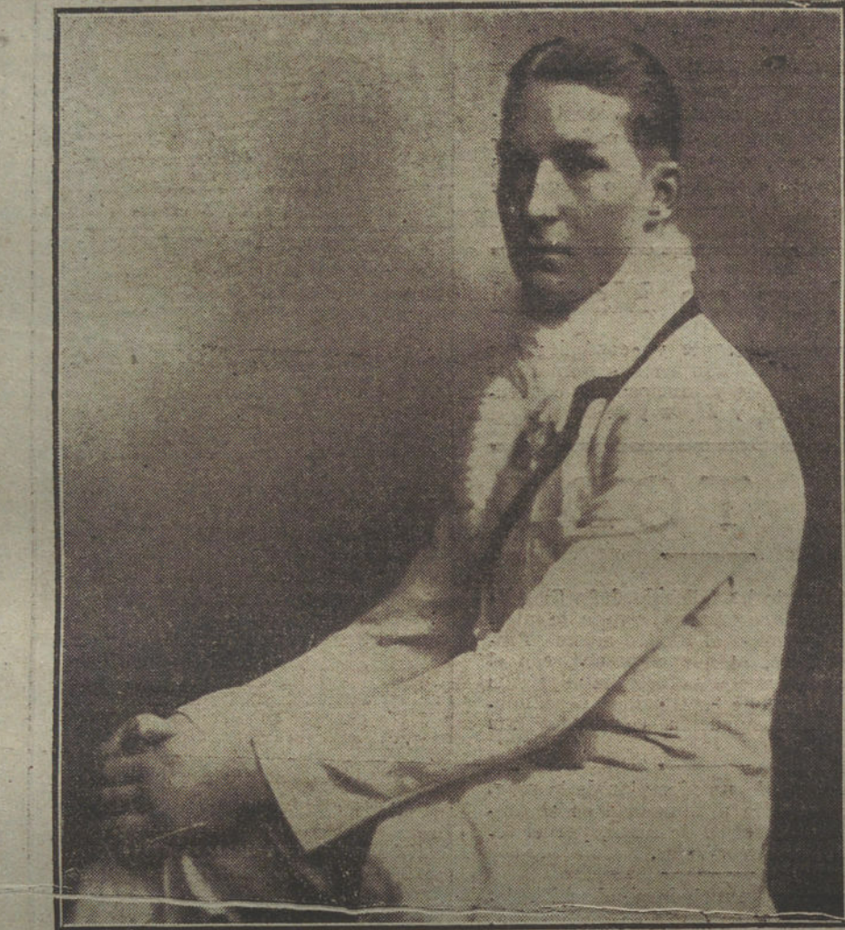
El Príncipe Federico Carlos de Essen, que ha sido nombrado Rey de Finlandia.

«Antes de declarar lo que será la cosecha de 1918-1919, quiero indicar que cuando nos hicieron falta 70 millones de quintales de trigo, no conseguimos más que 59 millones. En cuanto á los abonos, en lugar de 75 millo-