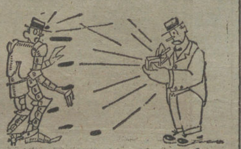
La ofensiva de la Cerillera.