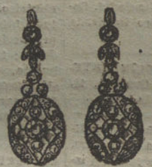
Núm. 8.—8 brillantes y diamantes.