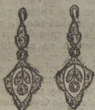
Núm. 1.—4 brillantes y diamantes.

Monturas de platino fino y oro de ley 18 quilates contrastado