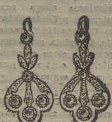
Núm. 12.—10 brillantes y diamantes.