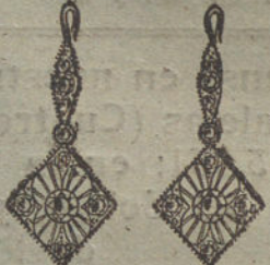
Núm. 5.—4 brillantes y diamantes.