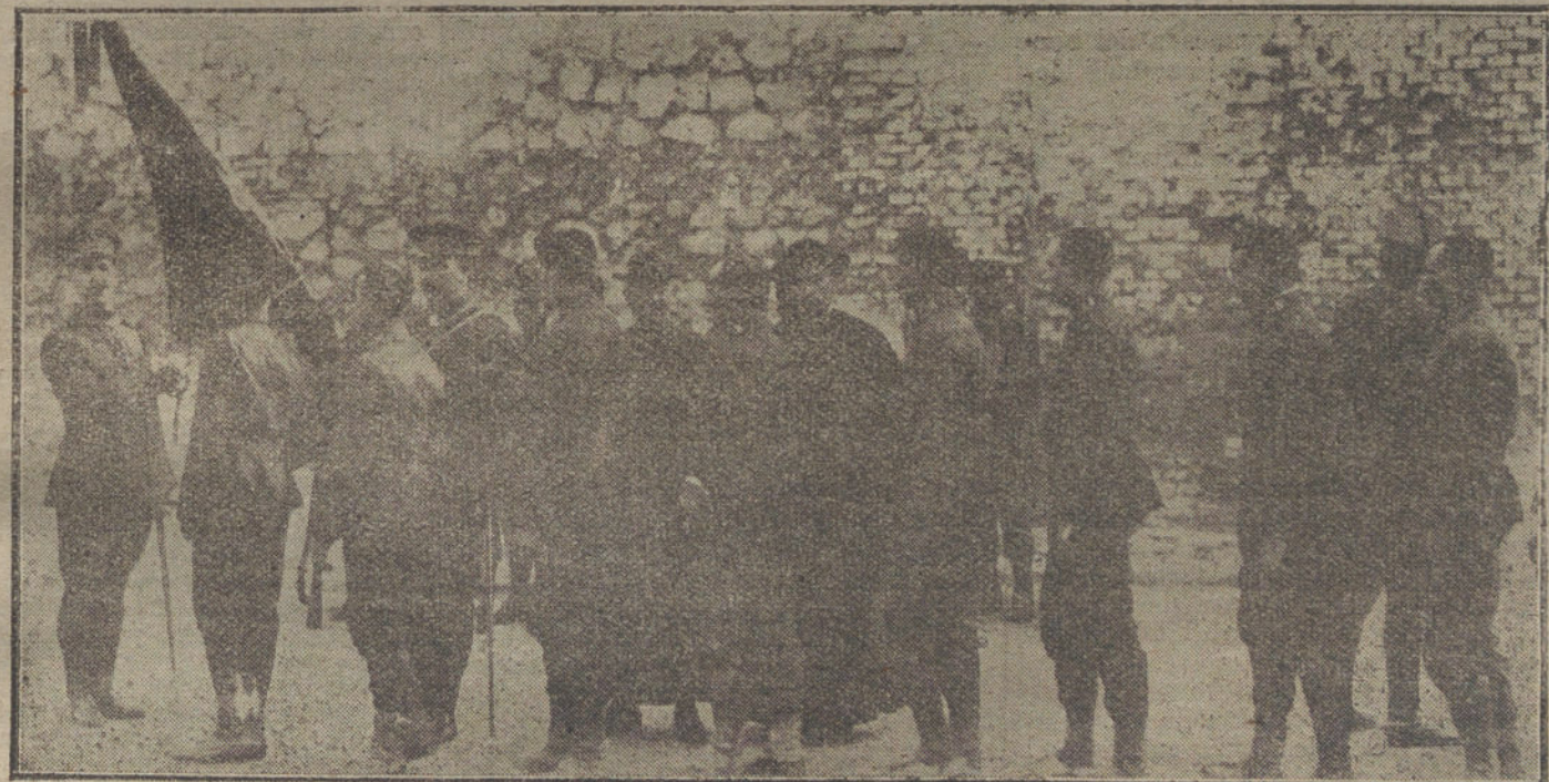
Los nuevos reclutas del cupo de instrucción, pertenecientes al regimiento de León, jurando la bandera, esta mañana, en el cuartel de San Francisco.

En cambio, los carabineros opinan todo lo contrario que los guardias.