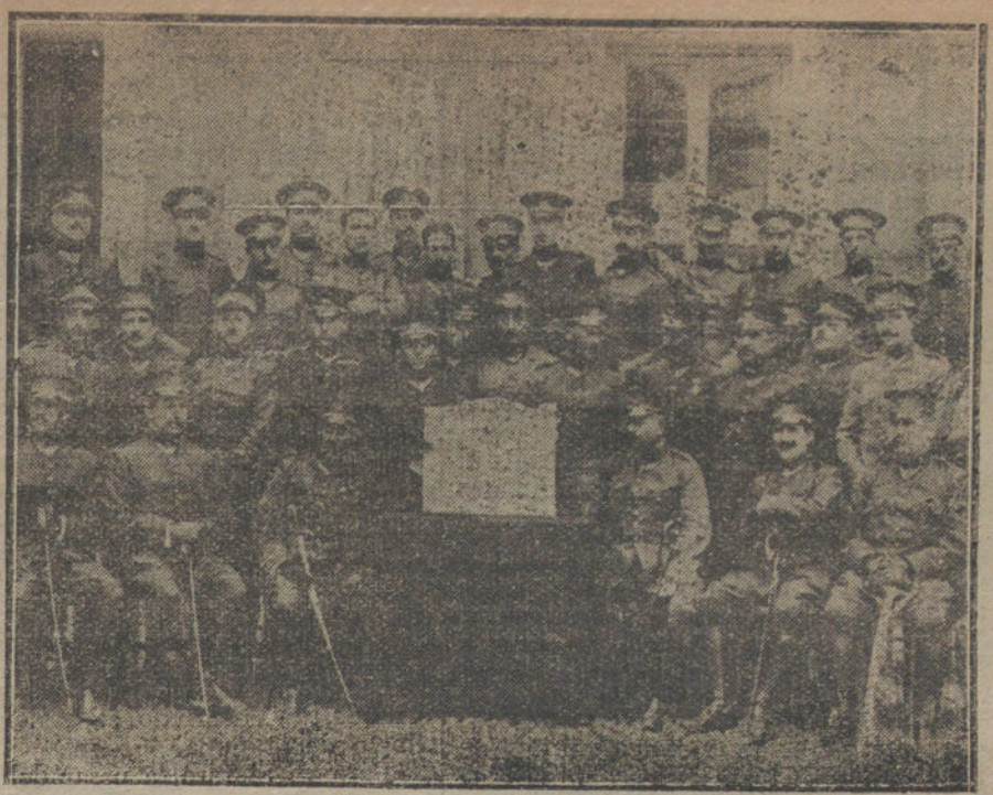
Entrega de la placa regalada por Bilbao al regimiento de León, por servicios prestados en aquella capital durante los sucesos de Agosto, acto verificado esta mañana.

¿Cómo se ha transformado esa pieza del nuevo Aretino en una comedia pulcra y con ilustraciones sentimentales?