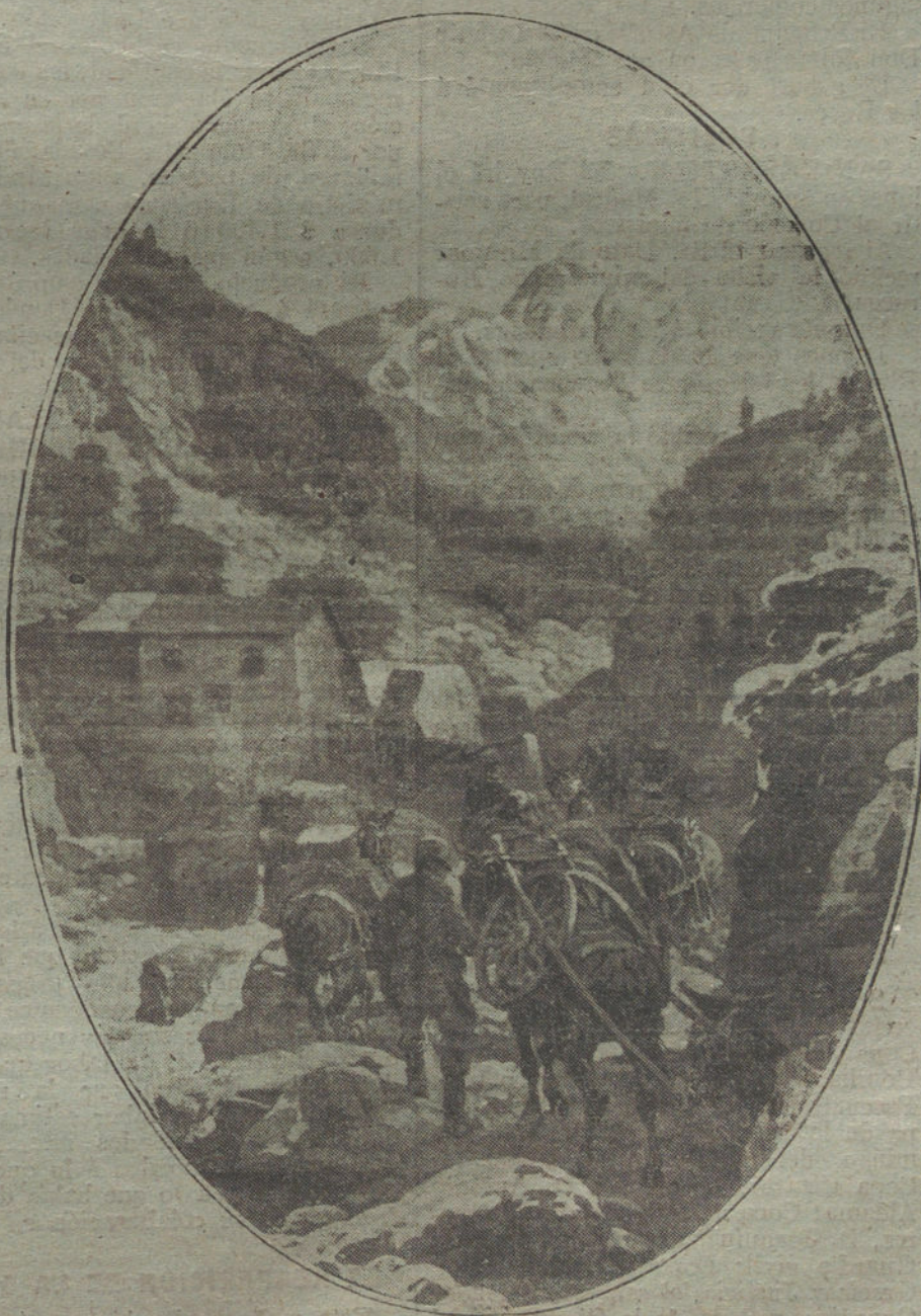
LAS DIFICULTADES DE LA GUERRA.—Transporte de municiones de los austro-húngaros a las alturas fortificadas de la frontera italiana.