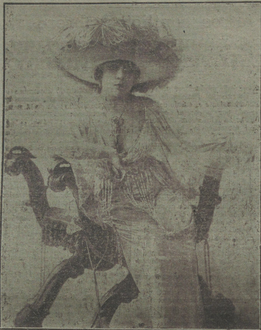
Elegante equipo de teatro, confeccionado con sedas, gasas, plumas y puerria de tonos suaves, modelo presentado por la Wigny.