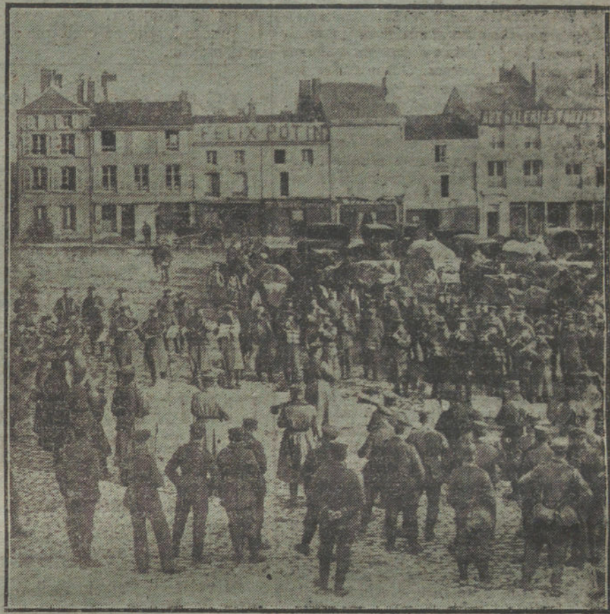
EN LAS TIERRAS CONQUISTADAS.—Banda militar alemana dando un concierto en la plaza de uno de los pueblos del Norte de Francia, ocupados por los alemanes desde el comienzo de la guerra.