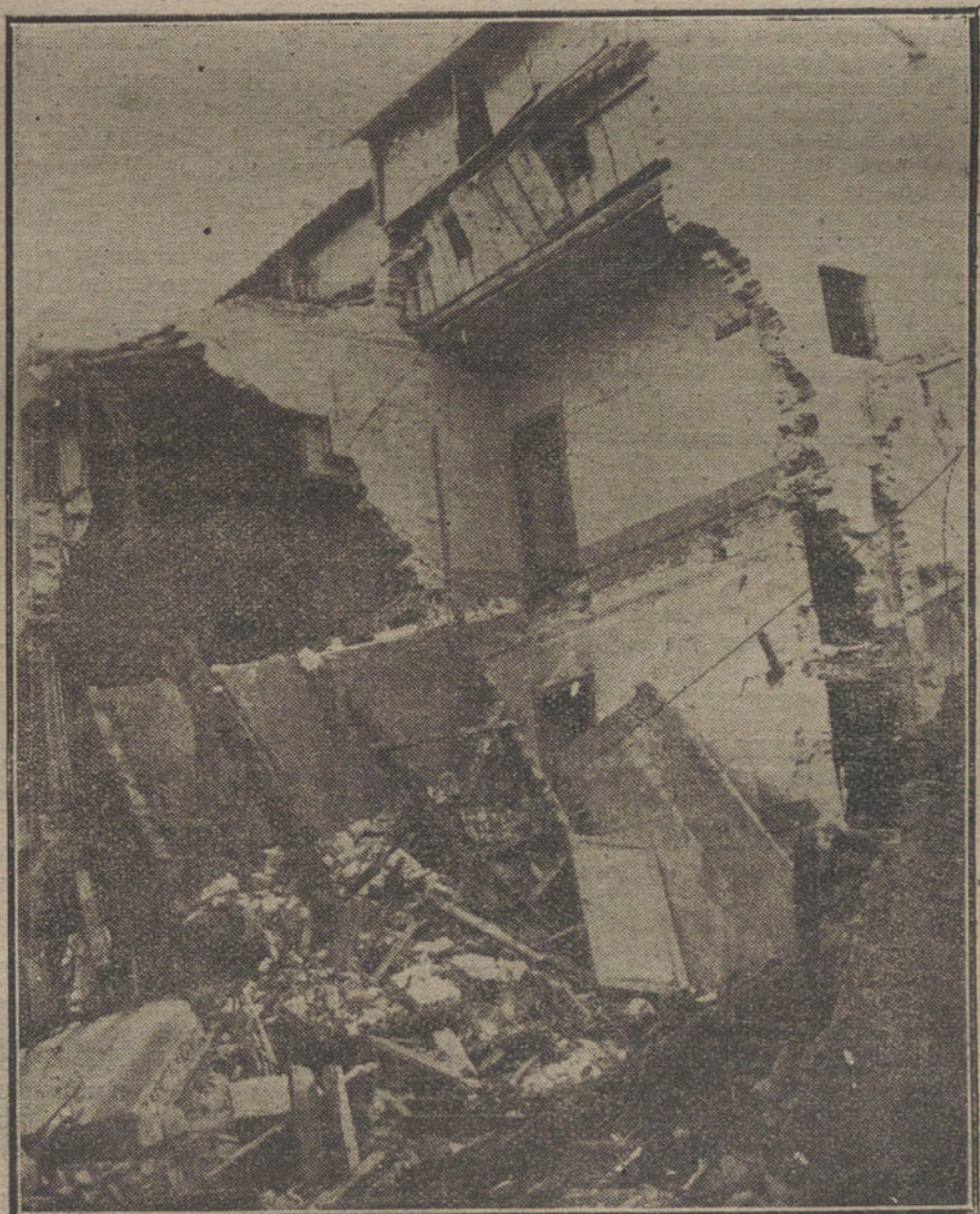
LOS DAÑOS DE LA GUERRA.—Efectos de la explosión de una granada en una de las ciudades del Norte de Francia que han sufrido los bombardeos de armas Artillerías beligerantes.

Por lo tanto, la guerra, la verdadera guerra, está entablada ahora entre los Gobiernos y el pueblo. ¿No es éste el mejor síntoma del fin de la guerra?