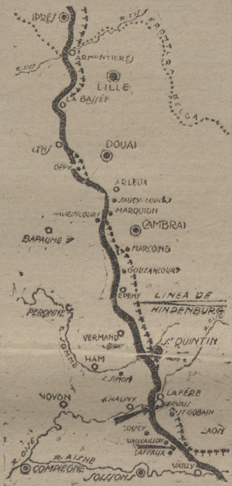
Línea de Hindenburg, donde ha sido detenido el avance aliado.

NAUEN (18 de Septiembre, a las tres de la tarde.)