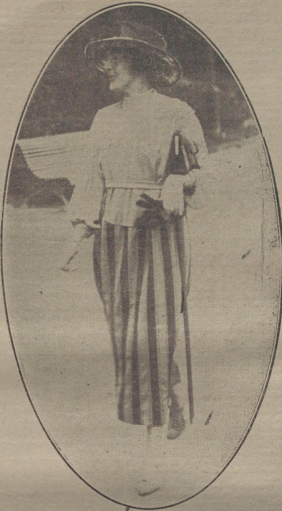
Modelo de traje de mañana, presentado por la casa Wigny.