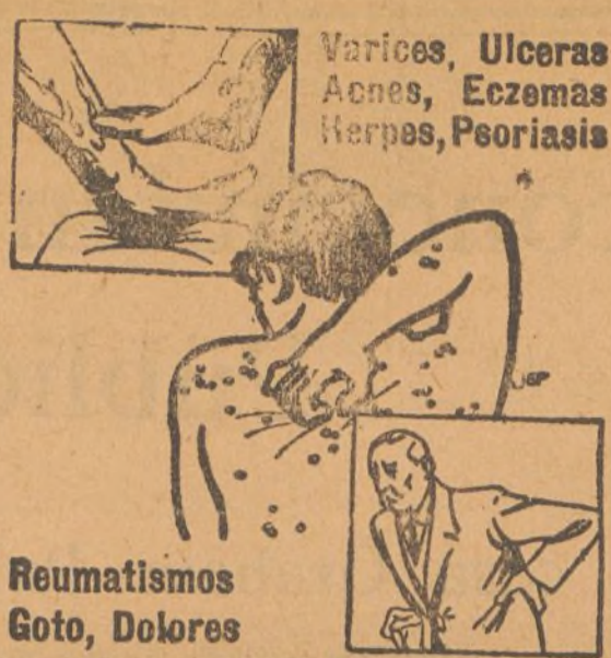
Varices, Ulceras, Añes, Eczemas, Herpes, Psoriasis

Mañana sábado, primero de Diciembre, se pasará la revista de Comisario del expresado mes por las fuerzas y organismos militares presentes en esta plaza.