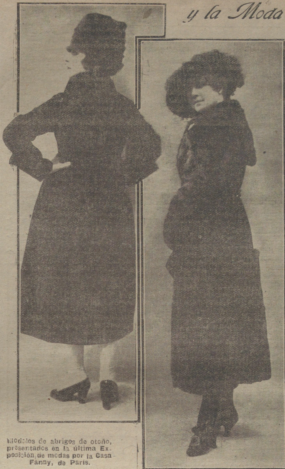
Modelos de abrigos de otoño, presentados en la última Exposición de modas por la Casa Fanny, de París.

«La Reichspost» dice que Austria-Hungría dirigió su Nota á los Gobiernos de la Entente de acuerdo perfecto con el Gobierno alemán; pero el momento para la publicación de la Nota pareció, sin embargo, inoportuno al Gobierno alemán. Aseguran que Burian tuvo una larga entrevista con el presidente de la Delegación austriaca. Burian se mostró muy conforme con