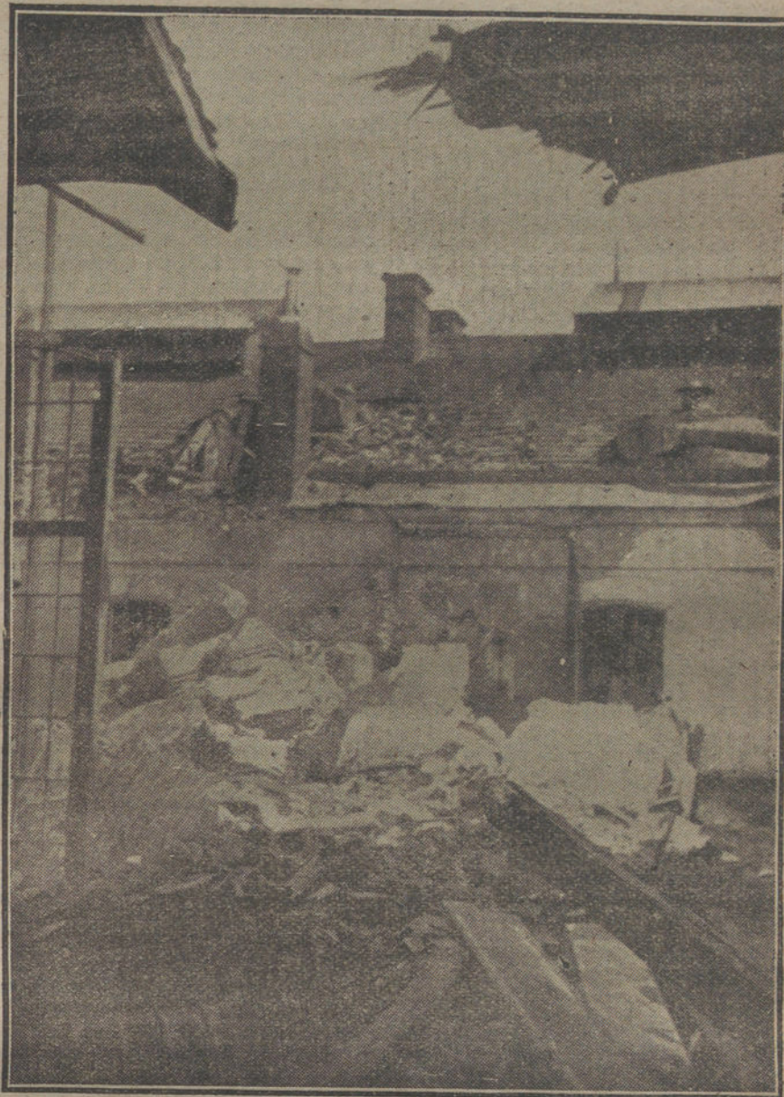
LOS DAÑOS DE LA GUERRA. —Efecto causado por la explosión de un proyectil de un mortero de 30,5, en una fábrica, en cuya chimenea habían instalado los franceses un observatorio militar.

que se vende la harina en Tetuán es casi doble al tasado en la Península, con lo que se encarece enormemente el pan, artículo el más necesario para la vida.»