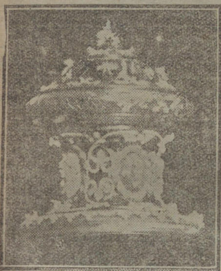
Tapadera de uno de los vasos orientales desaparecidos, con valiosas incrustaciones de piedras y camaféos.

Este extremo importantísimo trata de averiguarlo la Policía, pues de compro-