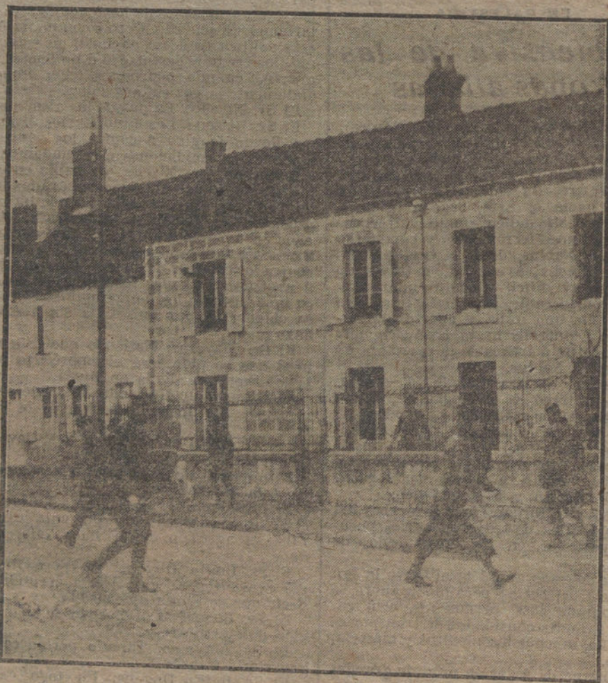
LOS AMERICANOS EN FRANCIA.—Edificio donde se ha instalado el Cuartel general americano.

El ministro de Abastecimientos ha dictado una Real orden circular para los gobernadores disponiendo que pa-