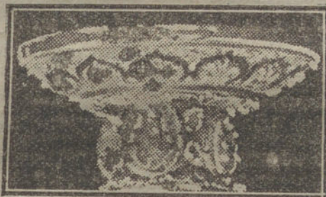
Detalles del pie de la copa del siglo XVI, reinado de Carlos IX, que ha sido robada.

El vicepresidente del Patronato del Museo de Pinturas, D. Jacinto Octavio