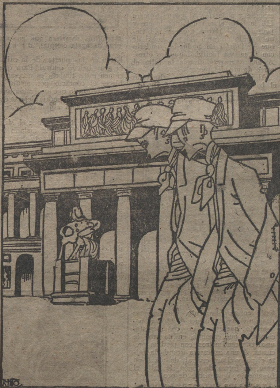
LA SEGURIDAD EN EL MUSEO DEL PRADO

Todo esto que ha dicho el Sr. Lázaro, algunas otras cosas que no reproducimos, también manifestadas por él, y otras muchas que no ha dicho, pero que sin duda no ignora, confirman nuestro criterio de que la causa de esos continuados ultrajes debe buscarse en la desorganización de los servicios. Hemos visto dolorosamente impresionados, que con mal disimulado apasionamiento se pretende hacer recaer la responsabilidad sobre cargos determinados. Se habla de cesantías y dimisiones con injustificada ligereza. Se lanzan nombres con marcada intención. ¿Es que la importancia del suceso se compadece con esas pobres argumentaciones, haciendo recaer la culpa sobre los que no están investidos de la autoridad necesaria? Al margen del suceso, el Patronato del Museo ha encontrado sus defensores, como los ha hallado el director, el subdirector, el conserje, los celadores, la Dirección general, el subsecretario y el ministro. ¿No es más justo que la responsabilidad caiga sobre todos, sin ex-