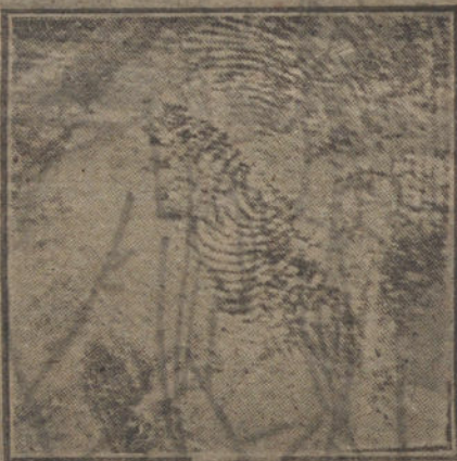
Una de las huellas dactilares, recogida en la cara interna de los cristales de la vitrina robada, según la fotografía obtenida por los encargados judiciales del servicio dactilográfico.

Al jarrón número 107 le falta todo el basamento, de oro y piedras. Un magnífico frutero, que tiene forma de esquife, carece de toda la rodela que