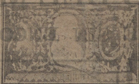
Magníficos camafecos que guardaban la urna de ágata oriental, del siglo XVI.

Hemos oído decir—consta que no lo afirmamos—que la instalación de los timbres de alarma no es tan completa como se dijo en un principio. Existen, sí, unos timbres; pero no en todas las puertas de las dependencias interiores.