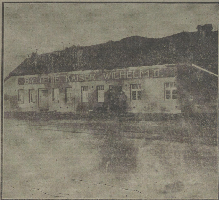
LAS NECESIDADES DE LA GUERRA.—Abrigos de una batería alemana, en su instalación de las dunas de Flandes.

Abastecimientos.—Real orden prorrogando por un mes el plazo de quince días concedido por la circular de la Comisaría general de Abastecimientos de 17 de Agosto próximo pasado, para que todos los agricultores que aspiran a obtener los estímulos a la producción que acuerden las Cortes, presenten en la Alcaldía de los términos municipales donde radiquen sus fincas declaraciones juradas en que hagan constar las superficies que hubieren destinado al cultivo de trigo durante el año agrícola de 1917 a 1918.