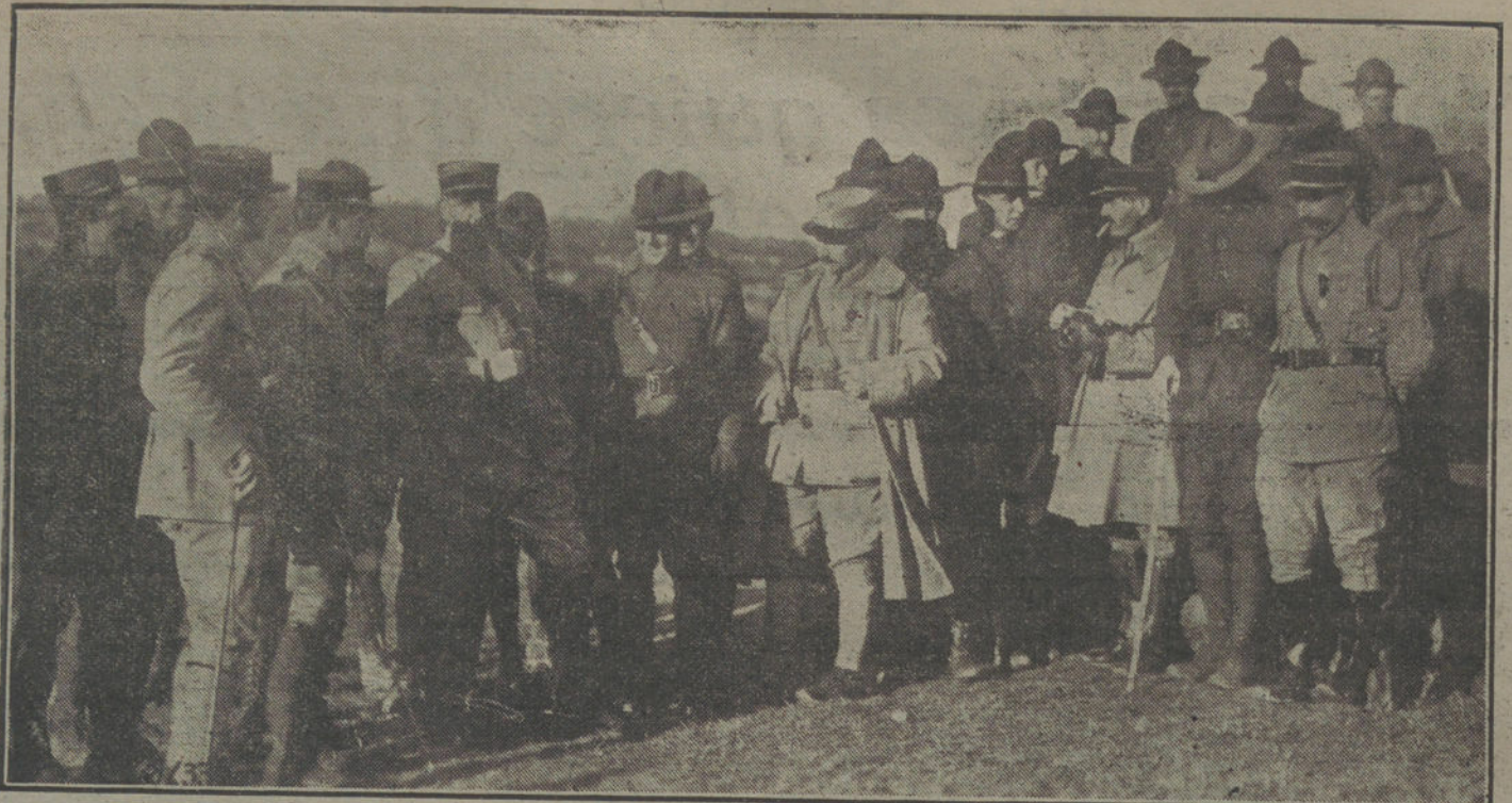
LOS AMERICANOS EN FRANCIA.—Oficiales franceses, americanos e ingleses, que han dirigido las operaciones de la ofensiva combinada, antes de marchar a sus puestos de la línea de combate.

Personal facultativo por oposición en el Hospital de San Juan de Dios.