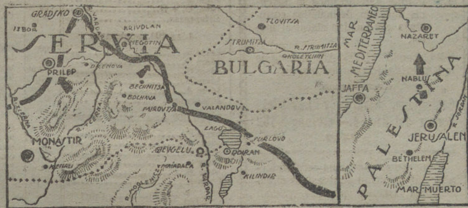
La línea de combate en los nuevos frentes balcánico y de Palestina.

PARIS (Torre Eiffel). (24 de Septiembre, a las tres de la tarde.)