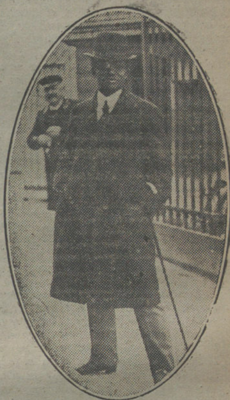
Mr. Legitimus, primer diputado negro admitido en la Cámara francesa, y que servía de diversión al Parlamento de la República, en días en los que no se sospechaba que los negros pudieran, más tarde, salvar a Francia.

no habían visto nunca un barco ni una escalera. Fue muy difícil embarearlos, se caían al subir ó al bajar por las escalas, y no podían acostumbrarse a tener el cuerpo ceñido por el uniforme y los pies atormentados por los zapatos. Su gran distracción, durante la travesía, consistió en afilarse los dientes con unas pequeñas limas de madera. Si los alemanes los hubieran visto en tal ocupación, hubieran experimentado verdadero pavor.