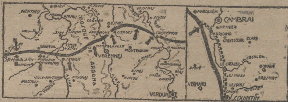
Los frentes de Verdun y Cambrai, donde han tenido lugar los últimos ataques de los aliados.

NAUEN (28 de Septiembre, á las tres de la tarde.)