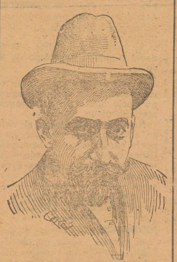
El genial dramaturgo don Jacinto Benavente a quien hoy tributa España un fervoroso homenaje de admiración y simpatía.