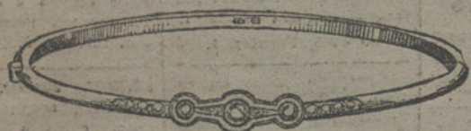
Núm. 1.—Tres brillantes y diamantes. Pesetas 200.