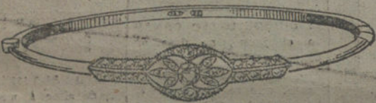
Núm. 4.—Un brillante y diamantes. Pesetas 275.