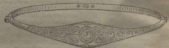
Núm. 12.—Cinco brillantes y diamantes. Pesetas 550.