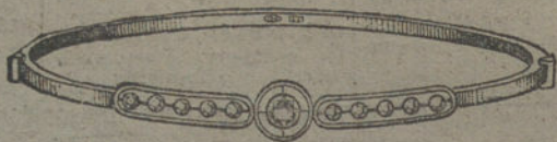
Núm. 2.—Un brillante y diamantes. Pesetas 225.