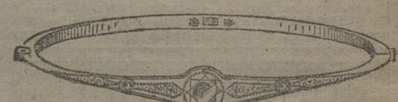
Núm. 18.—Tres brillantes y diamantes. Pesetas 1.000.

Factura de garantía en todas las compras