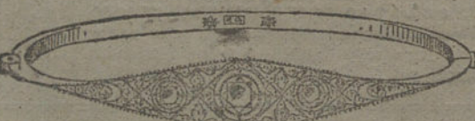
Núm. 14.—Tres brillantes y diamantes. Pesetas 725.