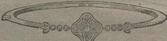
Núm. 8.—Un brillante y diamantes. Pesetas 425.