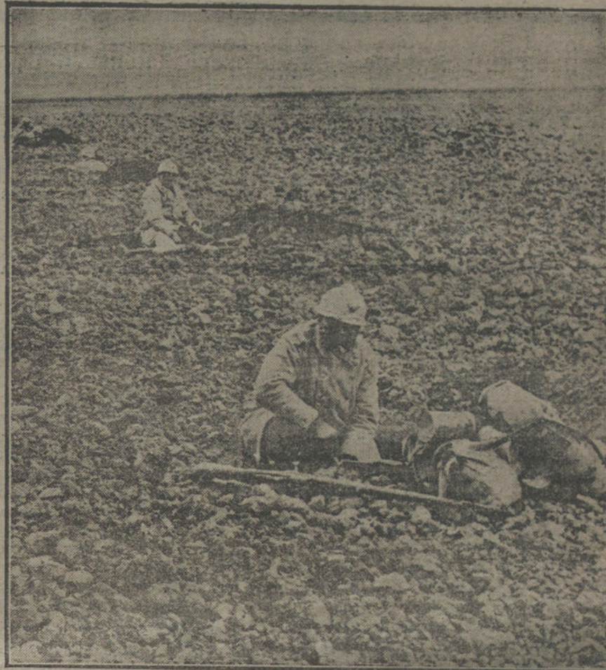
COMO SE HACE LA GUERRA. —Soldados franceses, distribuidos en pequeños fosos de la primera línea de fuego, y preparados para un combate.

En 1503 ó 1504, se imprimió en París una carta de Vespucci en la que aparecía como el primer descubridor del Nuevo Mundo. En dos años alcanzó doce impresiones en latín, siete en alemán, una en holandés y otras en francés ó italiano. En 1507 se publicó