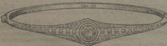
Núm. 16.—Nueve brillantes y diamantes. Pesetas 875.