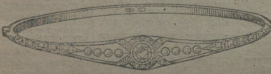
Núm. 10.—Nueve brillantes y diamantes. Pesetas 475.