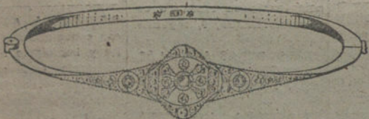
Núm. 7.—Siete brillantes y diamantes. Pesetas 400.