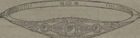
Núm. 17.—Cinco brillantes y diamantes. Pesetas 900.