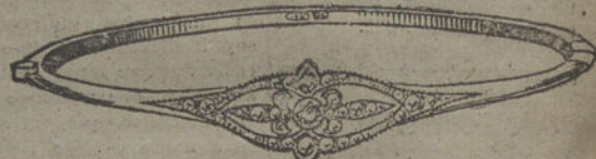
Núm. 3.—Un brillante y diamantes. Pesetas 250.