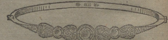
Núm. 15.—Tres brillantes y diamantes. Pesetas 800.