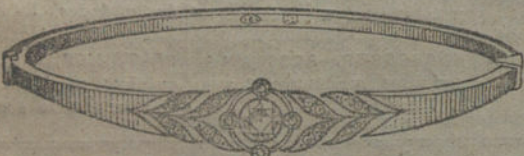
Núm. 13.—Cinco brillantes y diamantes. Pesetas 600.