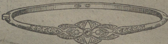
Núm. 5.—Tres brillantes y diamantes. Pesetas 300.