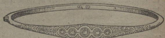
Núm. 6.—Cinco brillantes y diamantes. Pesetas 350.