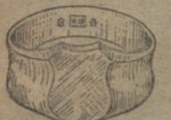
Núm. 4.—Gramos 8 Pesetas 30.