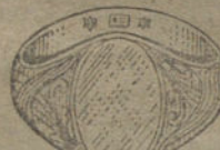
Núm. 11.—Gramos 15 Pesetas 56,25.