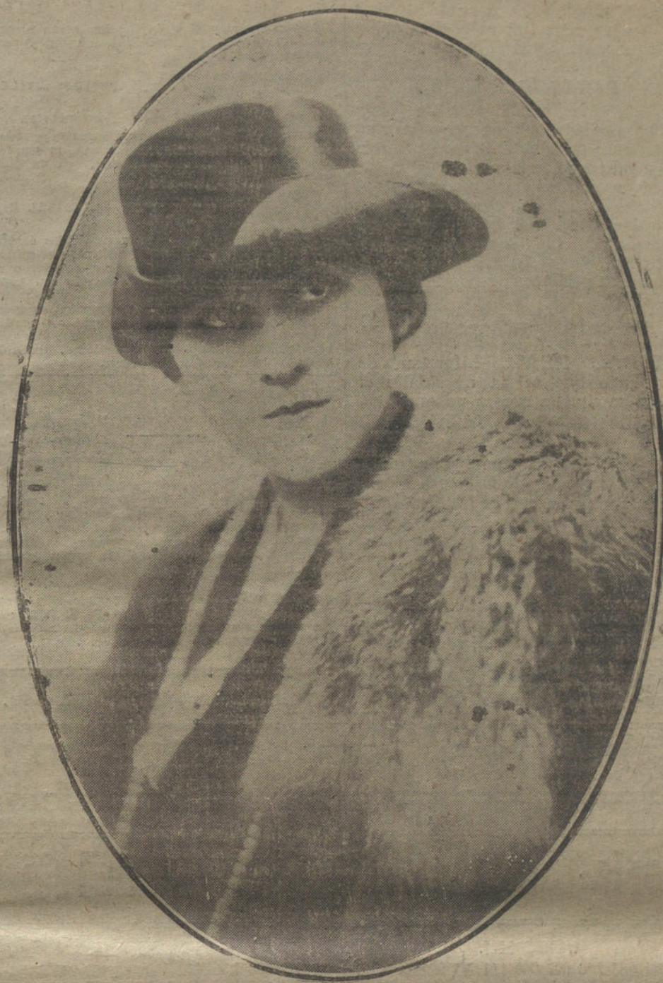
Sencillo sombrero de veludito negro, planchado, modelo de otoño, de la casa Faty.