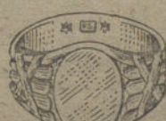
Núm. 6.—Gramos 10 Pesetas 37,50.