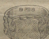
Núm. 8.—Gramos 12 Pesetas 45.