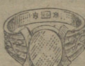
Núm. 5.—Gramos 9 Pesetas 33,75.