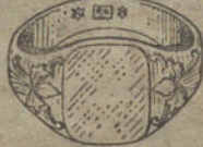
Núm. 3.—Gramos 7 Pesetas 26,25.