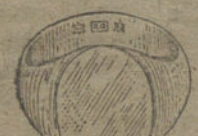
Núm. 14.—Gramos 19 Pesetas 71,25.