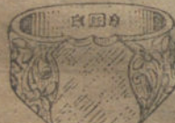
Núm. 13.—Gramos 18 Pesetas 67,50.