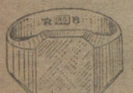
Núm. 10.—Gramos 14 Pesetas 52,50.