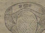
Núm. 15.—Gramos 20 Pesetas 75.

Factura de garantía en todas las compras