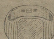
Núm. 12.—Gramos 16 Pesetas 60.