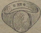
Núm. 2.—Gramos 6 Pesetas 22,50.