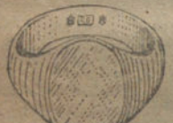
Núm. 7.—Gramos 11 Pesetas 41,25.