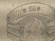
Núm. 9.—Gramos 13 Pesetas 48,75.