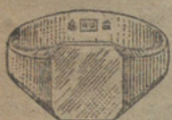
Núm. 1.—Gramos 5 Pesetas 18,75