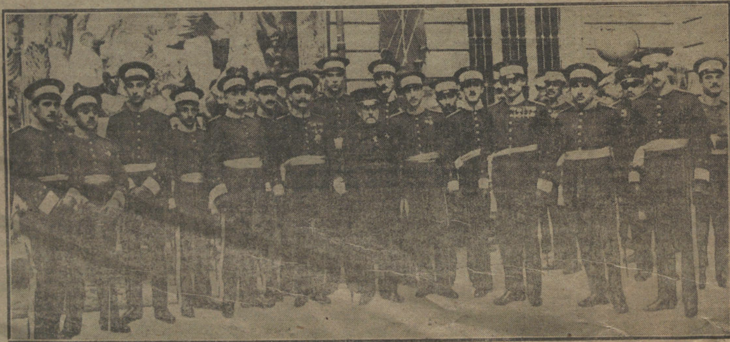
Los nuevos capitanes de Estado Mayor, después de la imposición de fajas, verificada ayer tarde en el depósito del Ministerio de la Guerra.

Al medio día, las fuerzas de caza alemanas se habían apoderado por completo del dominio aéreo sobre el campo de batalla. A causa de las graves pérdidas sufridas por el adversario, la actividad aérea de éste disminuyó notablemente. El enemigo mostró más cuidado en la utilización de sus fuerzas, reduciéndose á formar un cierre hasta alturas muy grandes de-