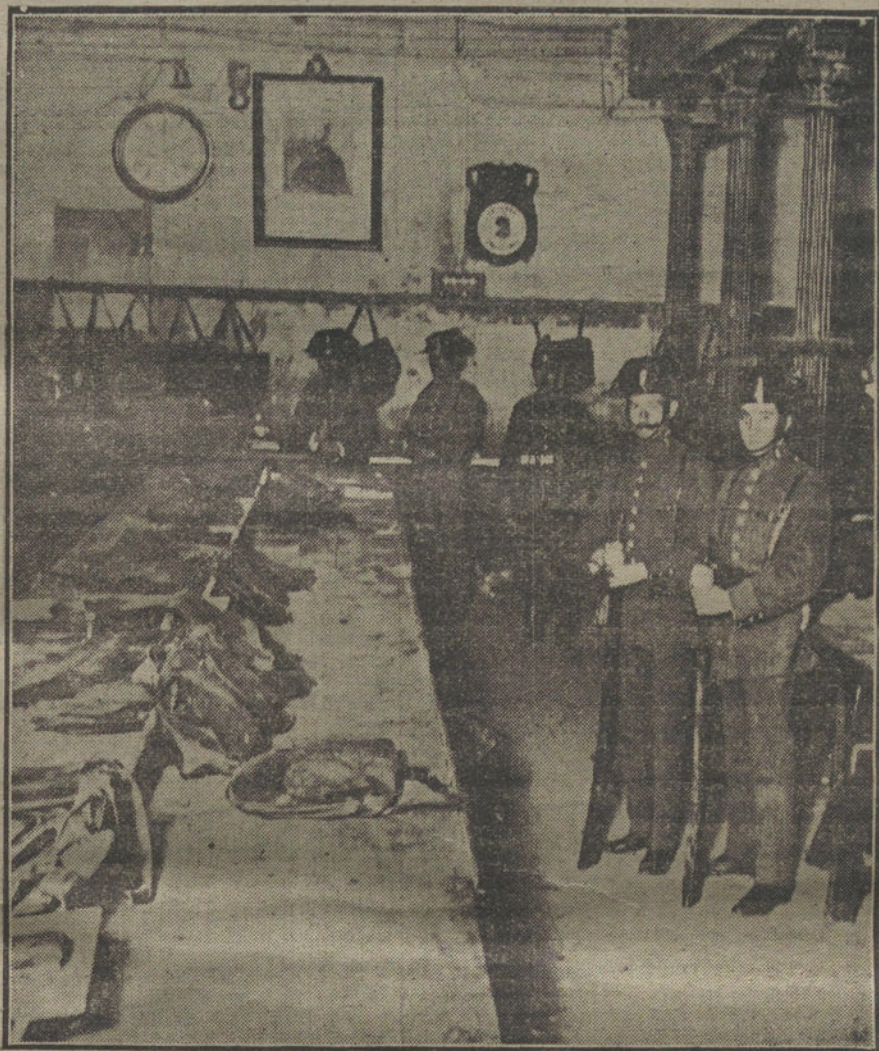
Aspecto de la Cartería de la Casa de Correos, custodiada por la Guardia civil, con motivo de la huelga.

PARO INSOSPECHADO.—LAS PETICIONES.—AGITACION EN LA CASA DE CORREOS. INTERVENCION DE LA FUERZA PUBLICA.—LAS AUTORIDADES.—LO QUE SABEN EN GOBERNACION.—EL PLEITO DE LOS CAMAREROS.—MAS COACCIONES.—LA HUELGA DE COCHEROS, SOLUCIONADA.—RESTABLECIMIENTO DEL SERVICIO DE COCHES