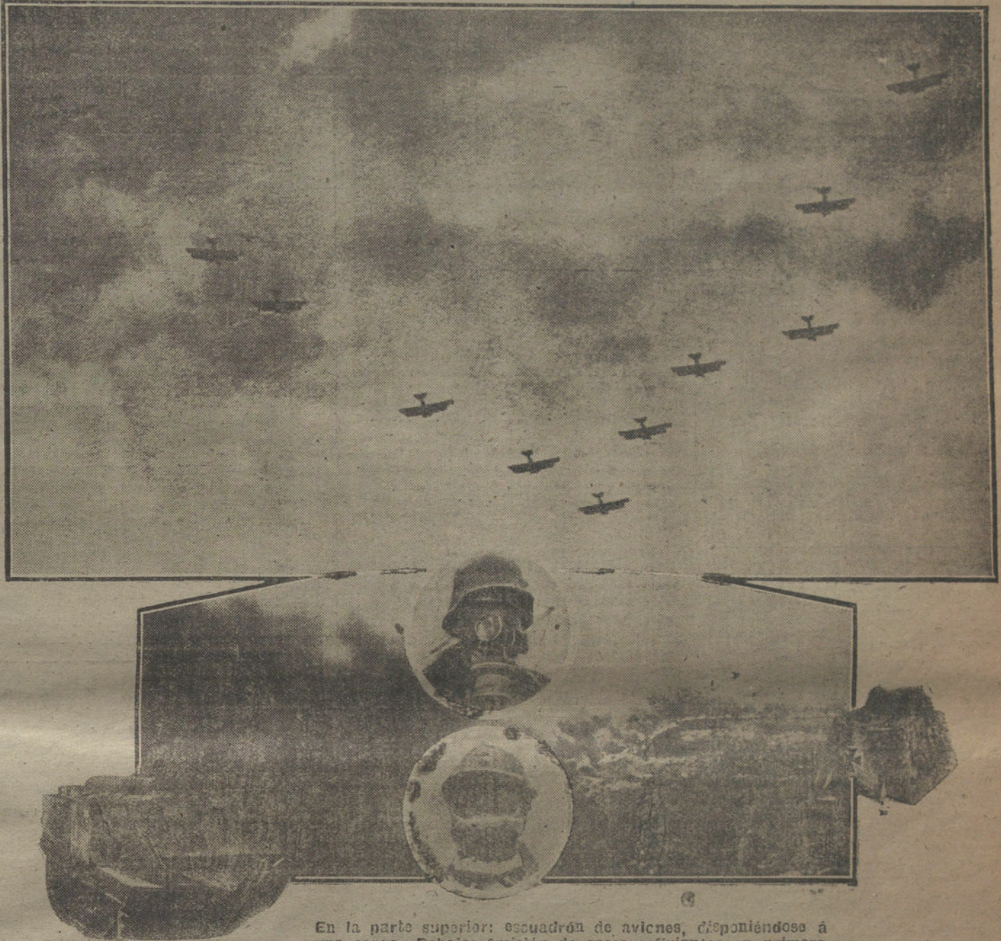
En la parte superior: escuadrón de aviones, disponiéndose a una carga. Debajo: emisión de gases asfixiantes en primera línea. En los círculos: escafandra alemana (arriba) y escafandra francesa (debajo). A los lados: tanque francés (izquierda), y tanque alemán (derecha).

LA ANTIGUA TRAGEDIA, SIN «DEUS EX MACHINA». — LA TRANSICION. — EL PRIMER ACTO DEL NUEVO DRAMA INVEROSIMIL. — EL SEGUNDO ACTO. — TERCERA JORNADA. — AÑOS QUE VALEN POR SIGLOS EN EL PROGRESO DEL MAL. — LA PIRA.