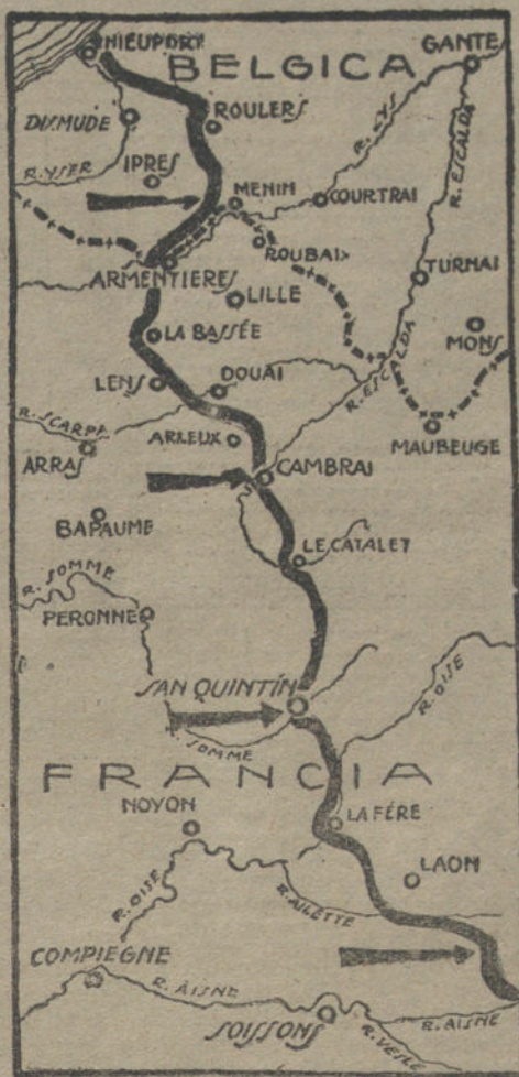
Gráfico de la marcha de las operaciones en el frente occidental.

No me he movido hasta ahora de Gobernación, donde acabo de almorzar, y tengo la satisfacción de que el principio de autoridad ha quedado a salvo, cumpliéndose lo ordenado y desalojándose el local de Cartería, sin que haya habido que lamentar excesos de