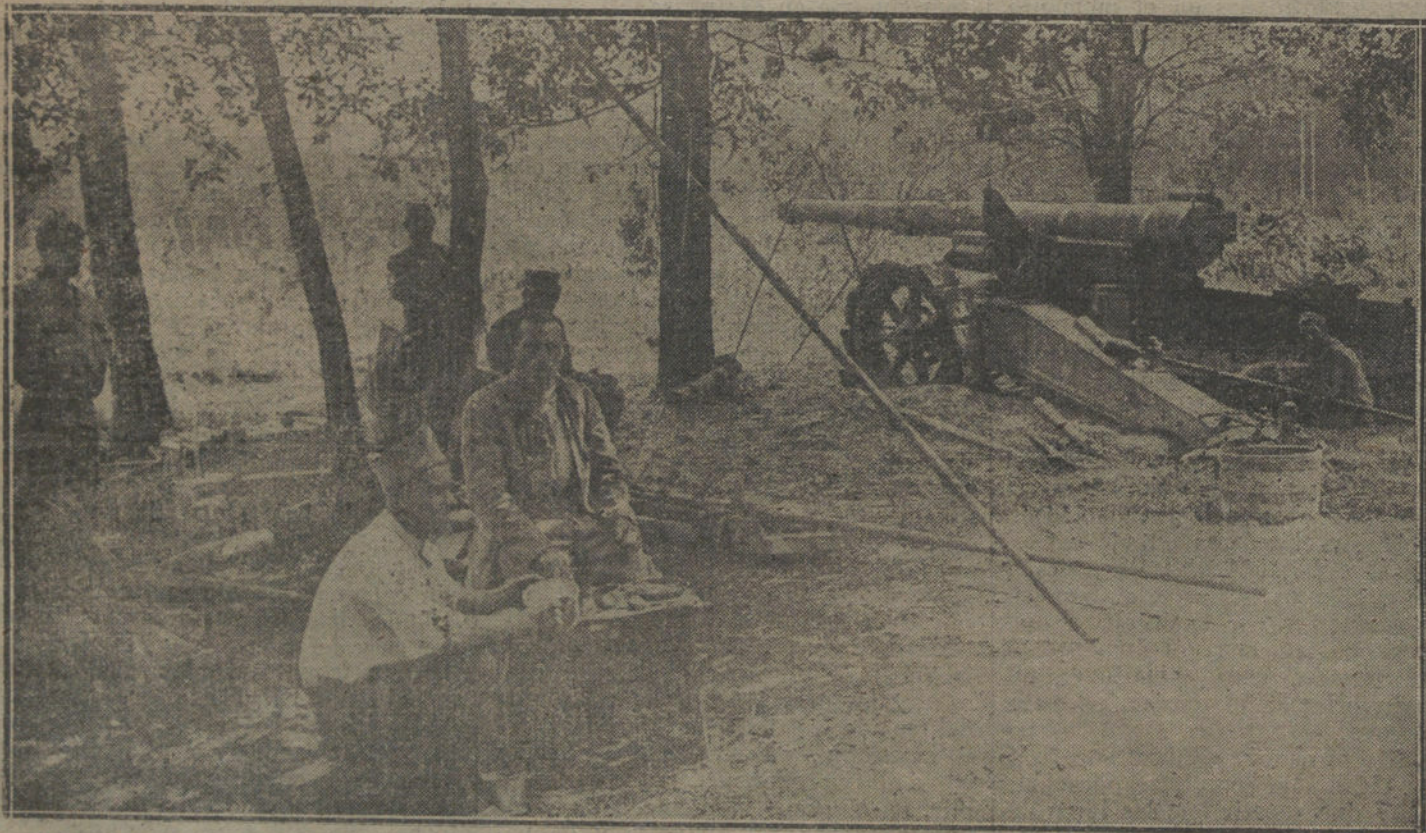
DE LA OFENSIVA ALIADA.—Cañón francés de largo alcance, refugiado en un bosque de los Vosgos.