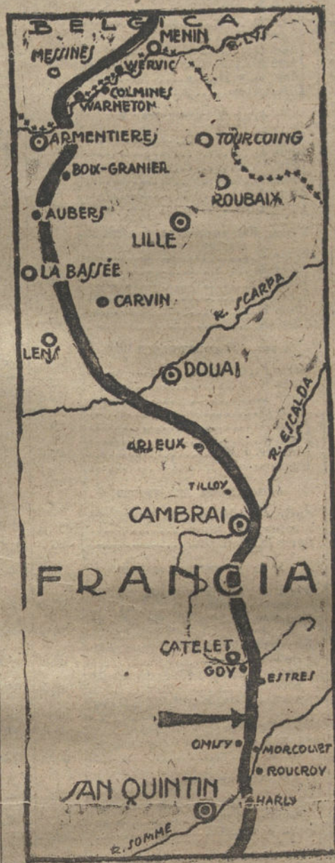
Sector de San Quintín a la frontera belga, donde se han desarrollado los últimos combates.

PARIS (Torre Eiffel) (5 de Octubre, a las tres de la tarde.)