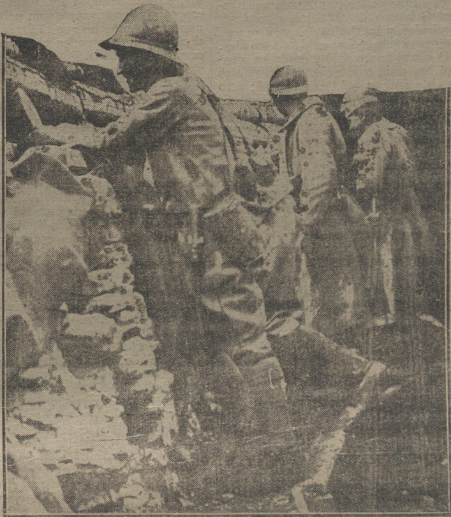
COMO SE HACE LA GUERRA.—Soldados franceses en una trinchera, esperando la orden de romper el fuego.

«Para nadie es ya un secreto que el Gobierno está en crisis. La verborrea indiscreta del Sr. Alba ha revelado, por otra parte, algo de lo ocurrido en los últimos Consejos, y que ha venido a darnos la razón en lo que a la vida del Gobierno, que profetizamos efímera, dijimos en notas anteriores, y que tanto soliviantó a la Prensa madrileña. No era difícil, sin embargo, predecir que surgiría la situación actual.