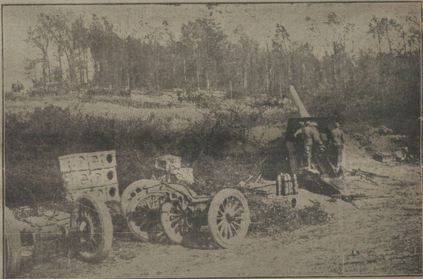
COMO SE HACE LA GUERRA.—Cañón de largo alcance en una posición descubierta, disparando contra el adversario.