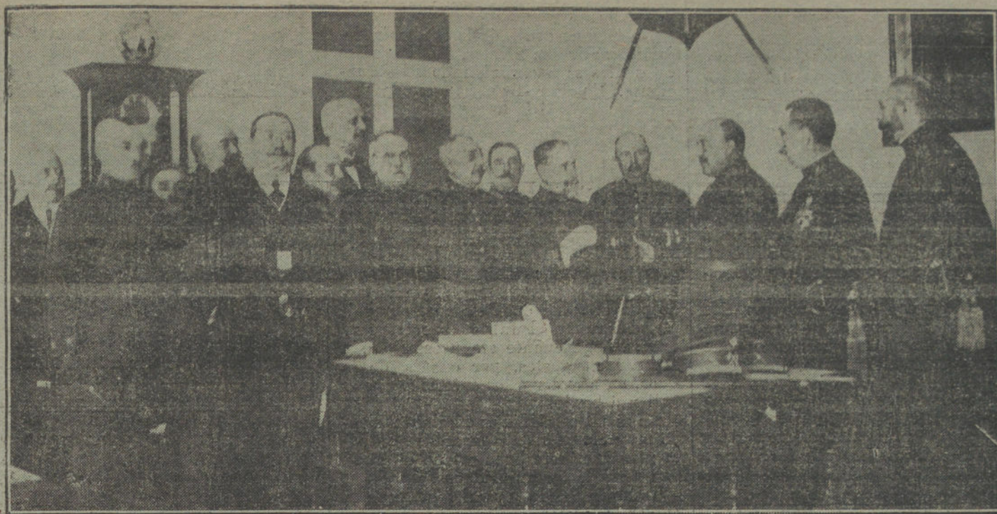
Entrega al general Aguilera del álbum que le regalan sus compañeros de promoción, como homenaje por su reciente nombramiento de capitán general de Madrid.

Otra, disponiendo que se inscriba en el Registro especial creado en este ministerio por la ley de 14 de Mayo de 1908, la Sociedad de seguros sobre enfermedades denominada Baronesa de Previsión.