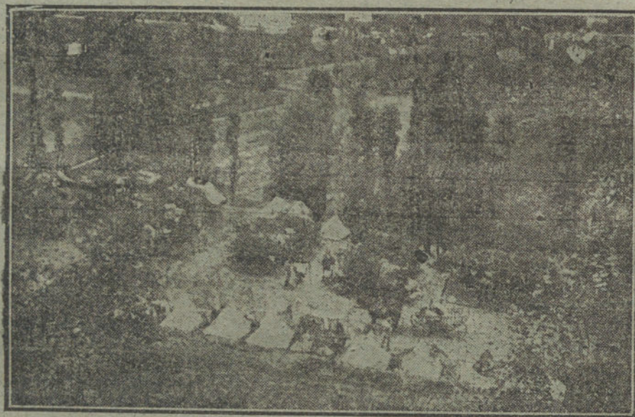
Vista de un campamento austriaco en el frente italiano, oculto a la vista de los aviadores.