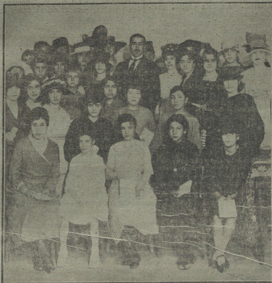
Reparto de premios en el Centro de Cultura Hispanoamericana, para la mujer. El director de Estudios con las señoritas premiadas.

El Infante Don Carlos abrazó a su hijo D. Alfonso, diciéndole que recuerde siempre el juramento que acababa de prestar.