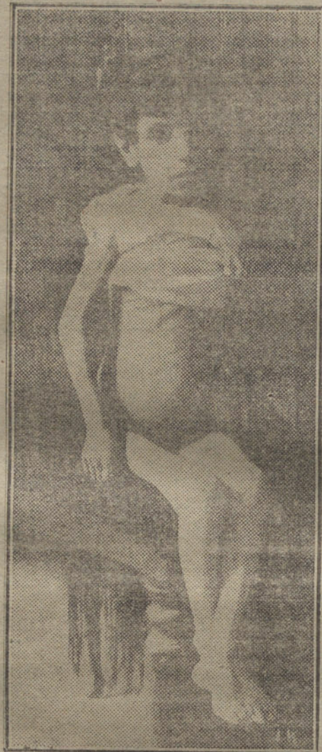
La niña secuestrada, instantes después de ser puesta en libertad.