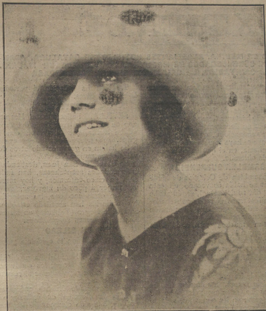
Sencillo sombrero de mañana, confeccionado en raso ó tafetán claros, modelos de otoño, de la casa Fanny.

biblioteca, que para uso del profesorado de la Casa de Socorro ha logrado reunir, mediante la esplendidez de su Junta administrativa.