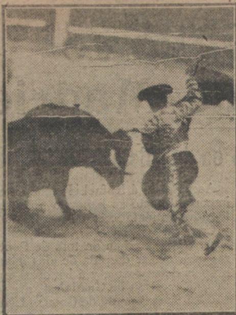
El Gallo veroniquizando.

Camará quiebra y le aplauden; Limeño cuarteja un par con estilo de gran banderillero, y Joselito cuadra en la cara y mete un par apretadísimo é inmejorable. Se lleva la ovación del tercio.