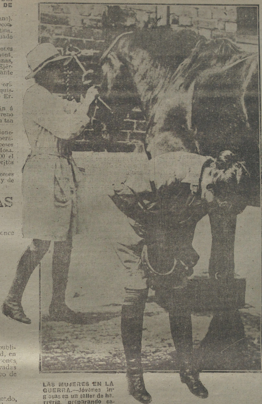
LAS MUJERES EN LA GUERRA.—Jóvenes ingesas en un taller de herrería, preparando casballos para línea de fuego.

CARTAGENA. Hallándose á pocas millas del cabo de Palos el torpedero español número 17, que se pone al habla con el crucero «Reina Regente», que en viaje de instrucción con los aspirantes de Marina salió de aquí el lunes último.