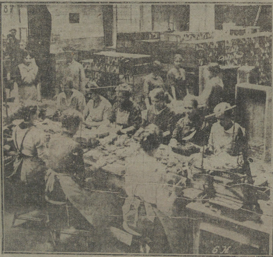
LA MUJER EN LA GUERRA.—El trabajo de la mujer en las fábricas de municiones en Alemania. (Fot. HOFFER.)

El número de prisioneros hechos por nosotros ayer pasa de 8.000, y hemos tomado numerosos cañones.