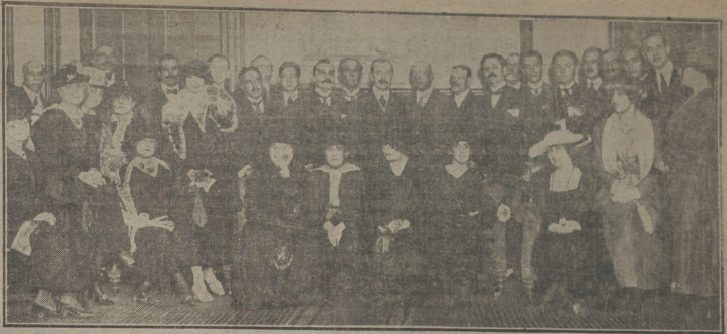
El ministro de Cuba en España, Sr. García Kolly, con el personal de la Legación y concurrentes a la recepción verificada esta almediodía en dicha Legación de Cuba.

Esta tiple de zarzuela, gentilmente bella, abandona el campo lírico, para dedicarse a las variedades.