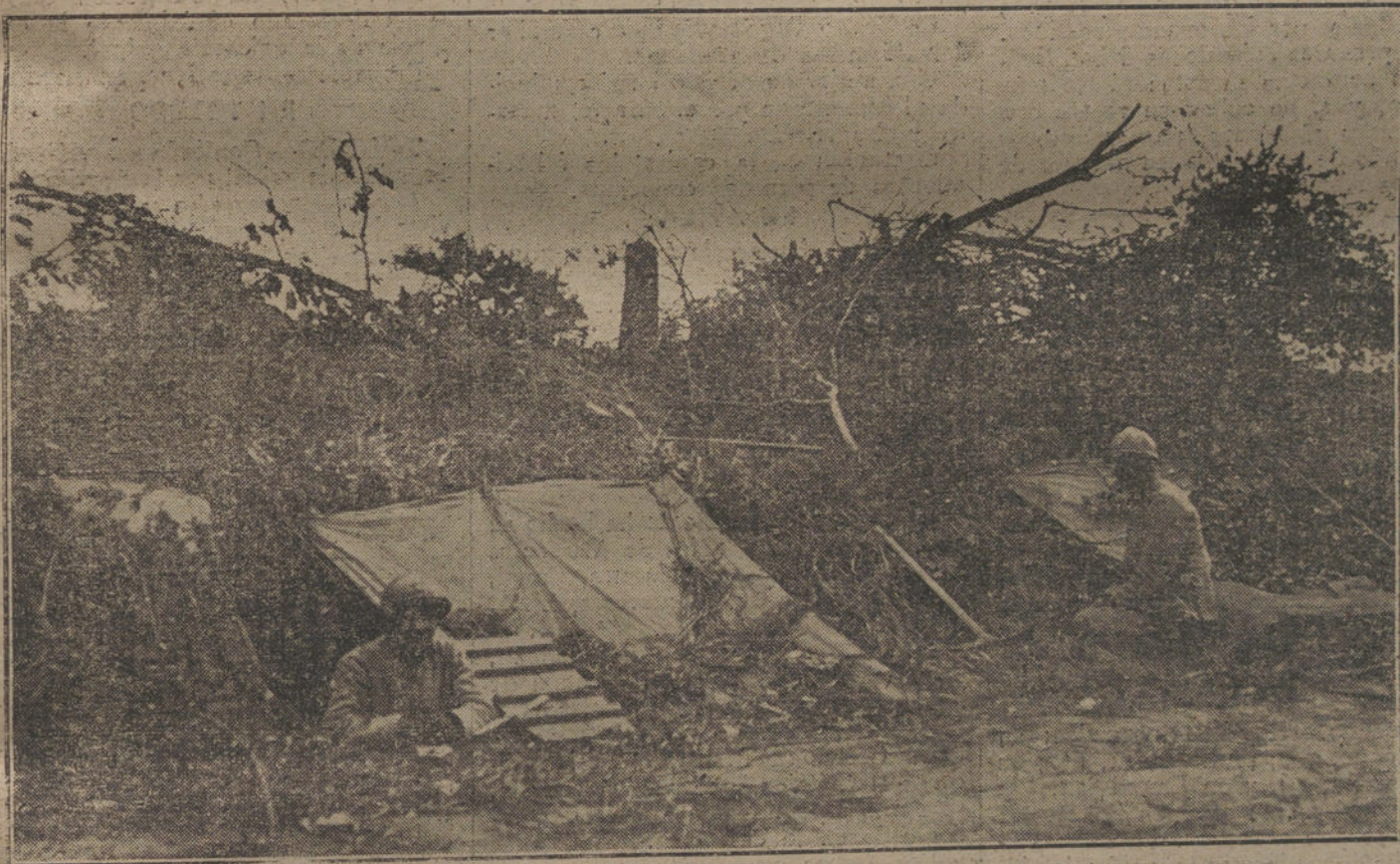
LA LUCHA EN FRANCIA.—Abrigos construídos por los franceses en las trincheras de la primera línea.