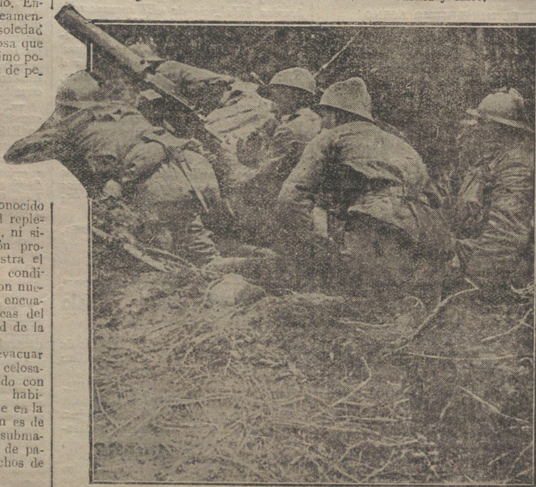
MIENTRAS LLEGA LA PAZ. Una ametralladora, servida por soldados franceses. En posición de disparar.

VIENA. Frente italiano.—En las Slove Aldeas fueron rechazados asaltos de reconocimiento italianos.