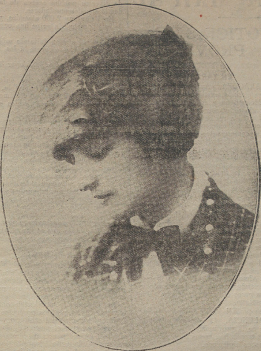
Gorra de felpa, adornada con un sencillo lazo, modelo creado por la casa Tourneur