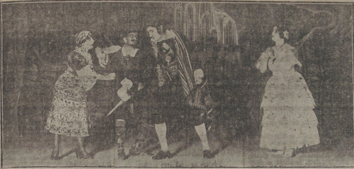
Una escena del segundo acto de «Los calabreses», zarzuela estrenada anoche en el teatro de Apolo.

NUMERO DEL TELEFONO DE LA REDACCION Y TALLERES DE «LA TRIBUNA» (JARDINES 4, 6 Y 8). 4.494