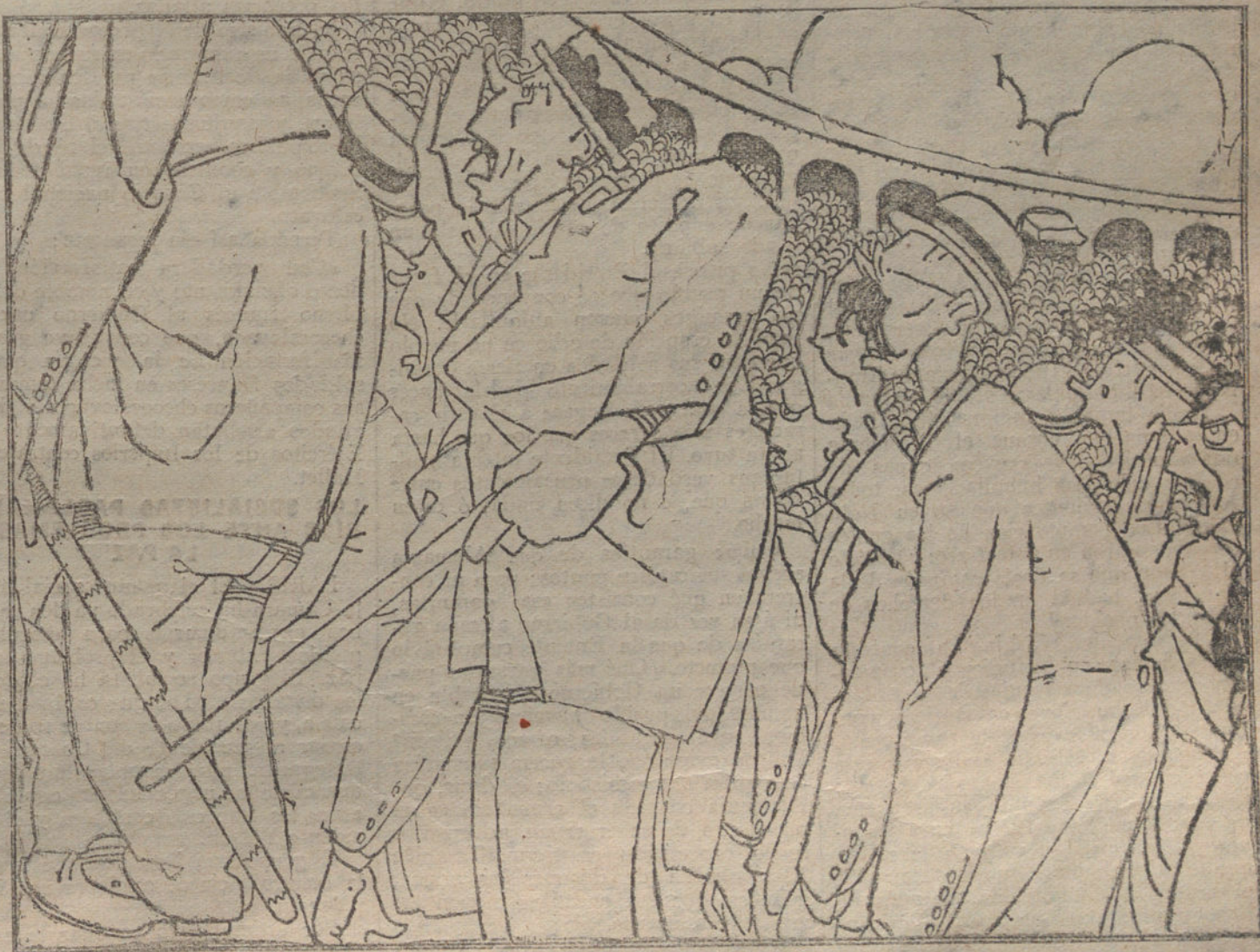
CONTRA EL PRESIDENTE

Wilson se opone, con su actitud, á que se realicen los bellos ideales del mundo que nosotros estábamos en vías