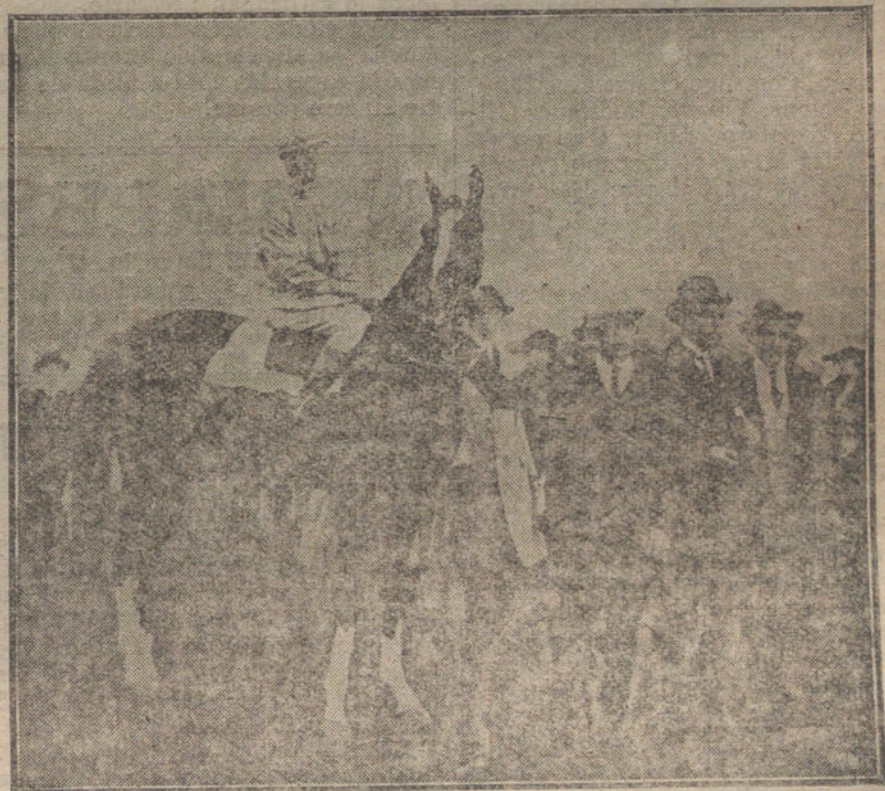
INAUGURACION DE LAS CARRERAS DE CABALLOS.—«Mañana», del marqués de Villamejor, ganador de la cuarta carrera, verificada ayer en el Hipódromo de la Castellana.