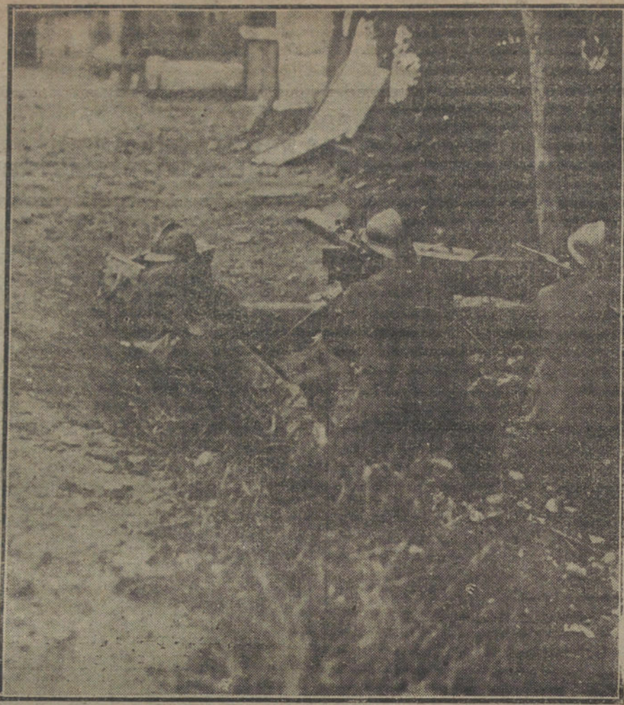
MIENTRAS LLEGA LA PAZ.—Ametralladoras francesas, defendiendo un pueblo.

Pues bien; para resolver este problema hemos de abandonar la farmacopea a que, hasta ahora, se ha acudido para tratarlo; aquella farmacopea que en España se aplicaba a todos los problemas de soberanía, aunque sean muy distintos; aquella que aplicamos a Flandes, a Portugal y a Cuba. ¡Y mirad lo diferente que ha de ser el problema catalán de todos éstos que, sometidos al mismo tratamiento, no han tenido ni tendrán igual solución! Hay que abandonar ya el sistema clásico de enviar a Cataluña el ejército de provocar las luchas sociales; de combatir con mercedes y distincio-