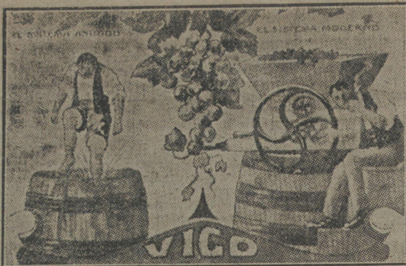
FUNDICION DE JOSE F. LANDIN