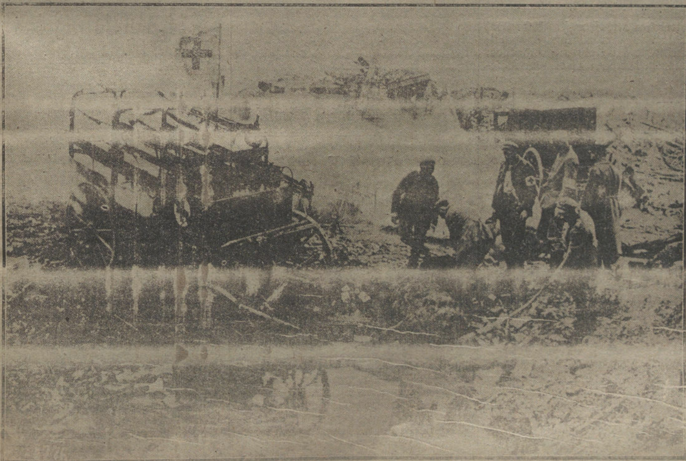
LOS BARCOS DE LA GUERRA.—En la imagen, bajo el signo de la Cruz, en la Exposición del año 1900, (ver. HOFFER)

Por el gran interés con que ha sido acogido por las clases productoras de toda España, promete ser este Concurso-Exposición una manifestación esplendorosa de la producción nacional en los ramos de la Alimentación, de la Agricultura y de la Higiene individual y general.