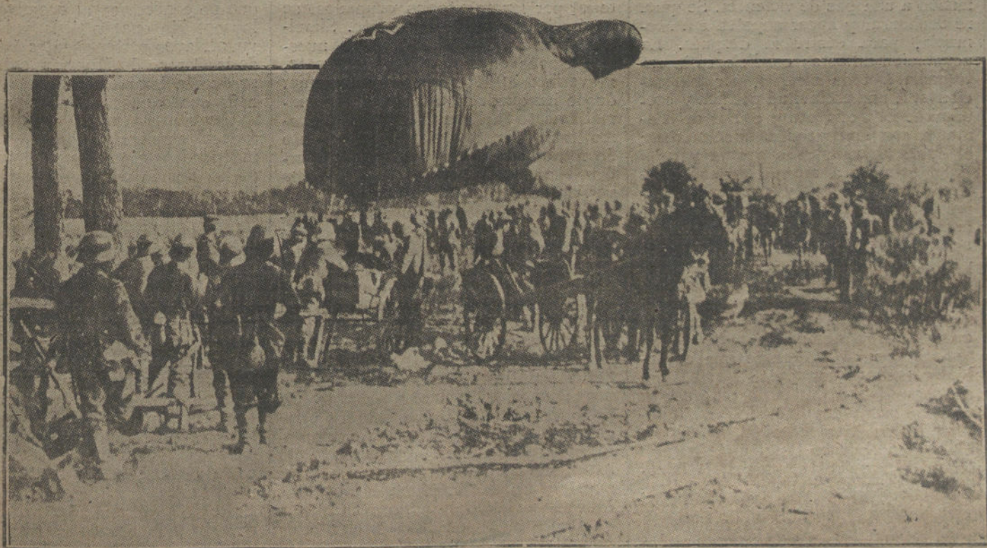
MIENTRAS LLEGA LA PAZ.—Un globo cautivo colgando, es observado al anochecer. Disputa de haber hecho obser-vaciones durante el día.

VIENA. La respuesta de Wilson á Austria-Hungría es diversa, juz-gada por la Prensa; pero todos los pe-riódicos están de acuerdo en que Wil-son no recoge la pregunta que real-mente le hizo Austria-Hungría, y cual-quiera que sea el significado que se halle en la respuesta, no contiene una contestación á las proposiciones austro-húngaras; será, pues, necesario pre-guntar nuevamente á Wilson cuál es su actitud ante las preguntas princi-pales relativas al advenimiento del ar-misticio y de la paz. Además, observan los periódicos que los motivos que adu-ce Wilson para no ocuparse de la pro-posición del Gobierno austrohúngaro, ya que después de la declaración de sus 14 puntos se han producido determi-nados acontecimientos de la mayor im-portancia, están en contradicción con la respuesta dada por el Gobierno ame-ricano el 15 de Septiembre á la pro-posición de paz de Burian, en cuya respuesta decía el Gobierno que ya te-nía expuesto su programa de paz. Pero actualmente, y ya antes de esta res-puesta americana, han tenido lugar aquellos acontecimientos á los que hace referencia la última Nota de Wilson; el reconocimiento del carácter de las tropas checoslovacas, como fuerza be-ligerante, así como el reconocimiento del Consejo nacional checoslovaco de París, como representación legal del Estado checoslovaco. Tampoco se sos-tiene la manifestación de la Nota de Wilson respecto á los yugoeslavos, á