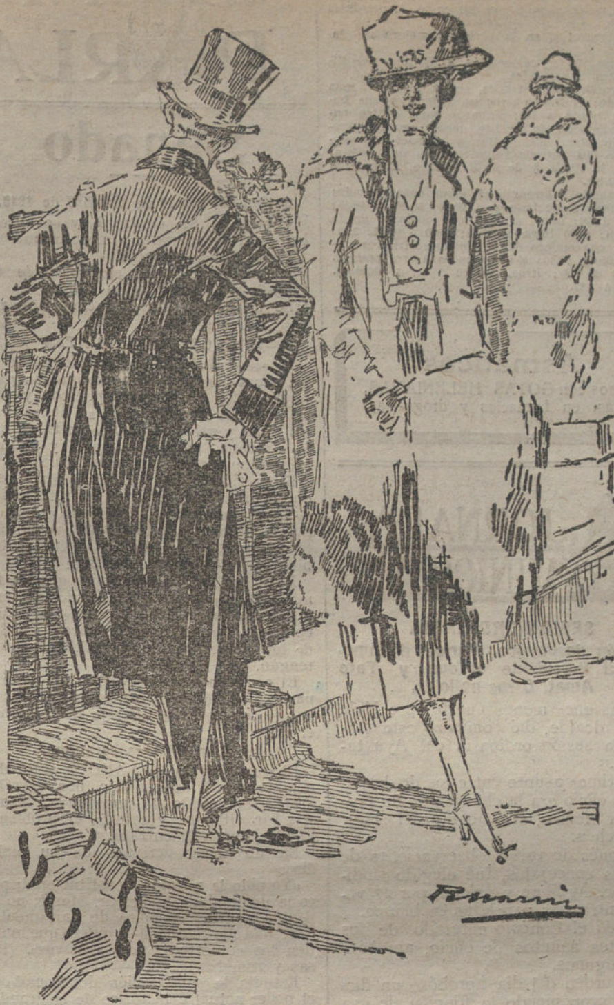
Impresión de las carreras de caballos de ayer. (Dibujo de RICARDO MARIN.)

Se registraron considerables bajas entre el vecindario flamenco. Al Sudeste de Tournai han quedado destruidas por el fuego inglés las siguientes localidades: Antoing, Peronne, Fontanoy y Varchin. Al Norte de Tournai fué avariado el convento de Mont St. Auvert por granadas inglesas, y destruidas las casas vecinas. En Quatre Vents fueron muertos una mujer y dos niños, y al Sudeste de Frayeburg y en la parte occidental de Tournai