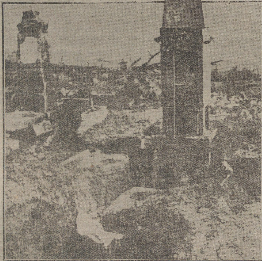
MIENTRAS LLEGA LA PAZ.—Trinchera inglesa en el Cementerio de San Quintín. El monumento, a la derecha de la fotografía, fue utilizado por los aliados como punto de observación.

LONDRES. «Durante una incursión felizmente ejecutada por nosotros en la mañana del 29, al Noroeste de Engloftaine, hemos hecho más de 70 prisioneros