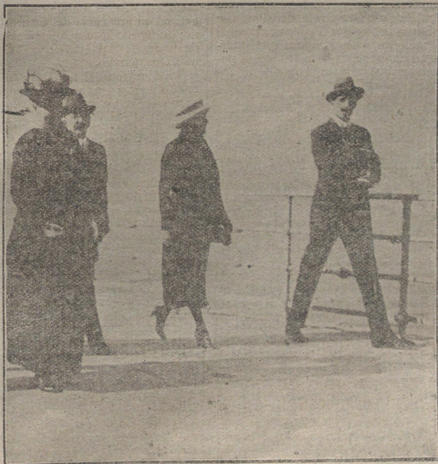
Su Majestad el Rey, durante el primer paseo que ha realizado después de su enfermedad, visitando las obras del monte Urgull, acompañado de Su Majestad la Reina María Cristina.

Con la venia de los interloutores, S. y J. Alvarez Quintero.