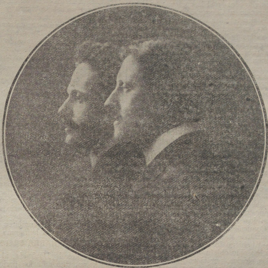
DON JUAN Y UNA BELLA