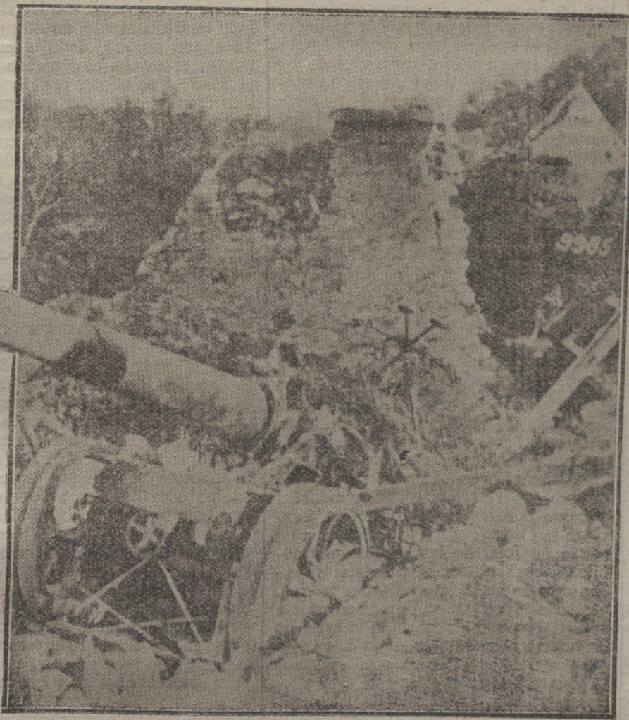
LAS ARMAS DE GUERRA.—Cañón francés, cogido por los alemanes y utilizado, después de recompuerto.

La responsabilidad es enorme, y los acontecimientos apremian de una manera insistente, para hacerla mayor y más inmediata. Austria ya inicia la descomposición de sus Estados. Checoslovacos y yugoeslavos, y austrogermanos y húngaros, tienden a divorciarse. Alsacia y Lorena pide también su independencia. Polonia quiere vigorizarse uniendo la parte rusa, austriaca y alemana. De esta suerte, el casillado báltico podrá considerarse