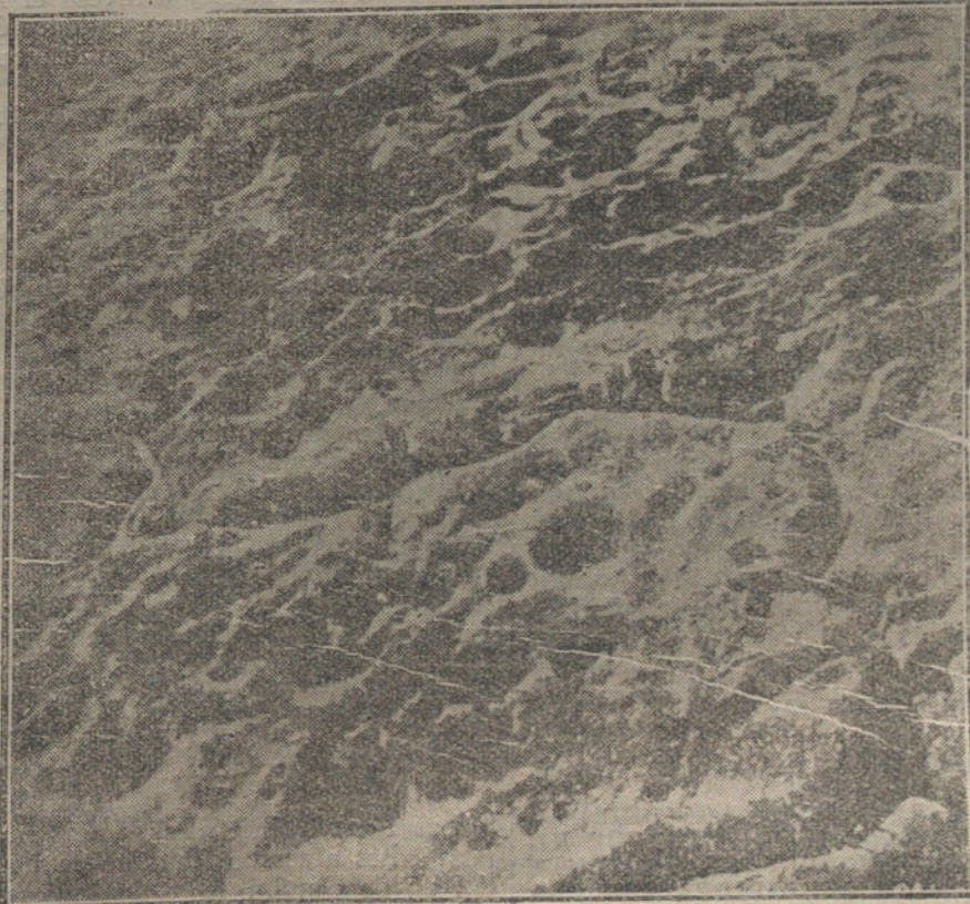
Aspecto desolador del campo de batalla en el Norte de Francia. Vista tomada desde un aeroplano alemán a 200 metros de altura.

En el frente de Verdún, la jornada se caracterizó por violento cañoneo al Este del Mosa. Al Este de Beumont fué rechazado un arado enemigo sobre nuevas líneas.