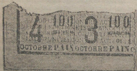
Uno de los tikés para la adquisición de pan.

En Bellegarde me han dado mi carta de pan. Ya no recibiré ese pan de caridad que me han dado por caridad cuando decía que no tenía carta, y que era como el que recibe el pobre del zurrón por entre la rendija de la puerta entreabierta, después de varios como-vendedores aldabonazos y un «Ave María Purísima», dicho con un visible arrepentimiento de vivir. Yo entregué mi «tiké» con un ostensible orgullo de tener un perfecto derecho a mi mendrugito de pan.