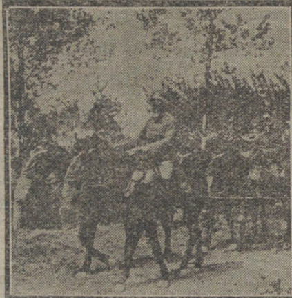
Núm. 1.—Prisioneros franceses atravesando las minas de Verdun para ser internados en Alemania.—Núm. 2, Columna de prisioneros franceses camino del campo de concentración.—Núm. 3, Tropas alemanas en marcha por una localidad del Norte de Francia.—Núm. 4, Columna alemana de aprovisionamiento, durante una marcha entre nubes de gases asfixiantes.

suboficiales que opten por el ascenso. Los oficiales de la Escala práctica ascenderán al empleo inmediato, con ocasión de vacante de la superior categoría, dentro de la respectiva Arma ó Cuerpo.