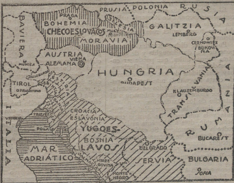
El mismo mapa, según el reparto de nacionalidades, hecho con la paz añada.

su aliada América, cosa que tampoco les conviene.