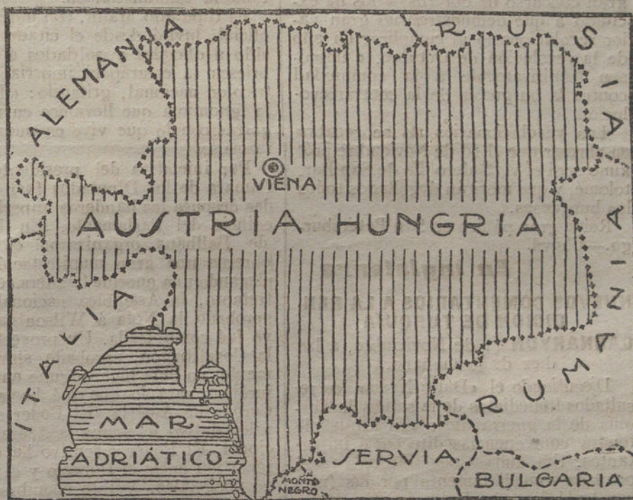
El mapa de Austria-Hungría antes de la guerra.

Nos hallamos, pues, ante el dilema, para los aliados, de aceptar las bases de Wilson, con las cuales, hecha la paz, Alemania quedará en condiciones, no de superioridad, sino de igualdad, con Francia e Inglaterra, o de oponerse a ellas, en cuyo caso los pueblos asociados se encontrarán enfrente de