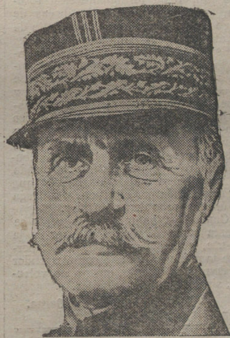
Mañana, hoy quizás, lucirá sólo, sobre el mar de lo desconocido, como único, como faro del mundo antiguo, del mundo pretérito, el fuego de Foch...