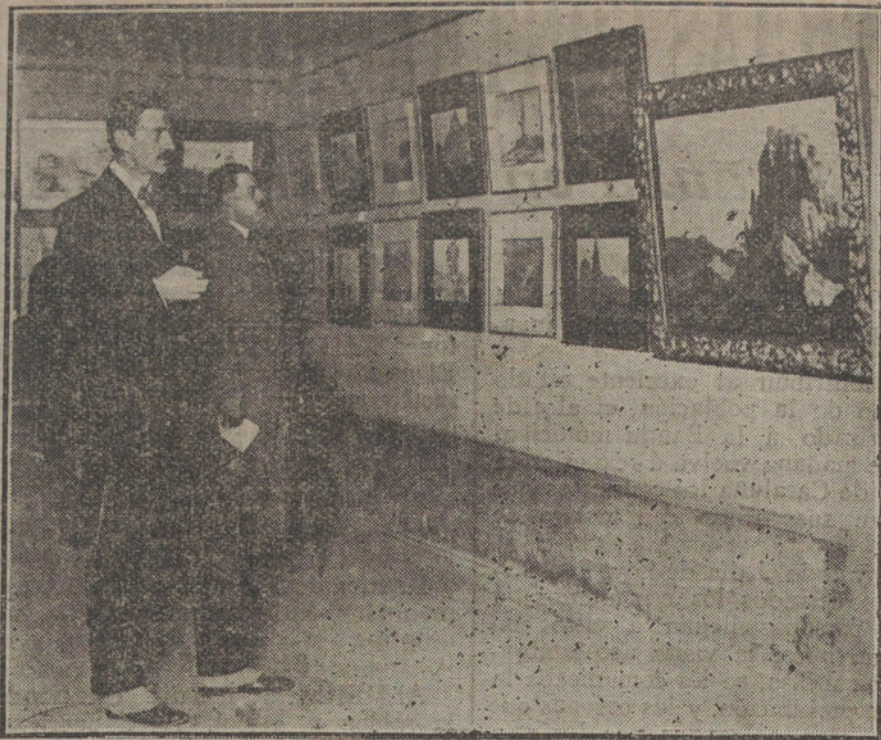
Un detalle de la Exposición de «Pisajes españoles», de Mr. Wyndham Tryon inaugurada anoche en el Ateneo.

Y ya dentro del local, comenzó la elección.