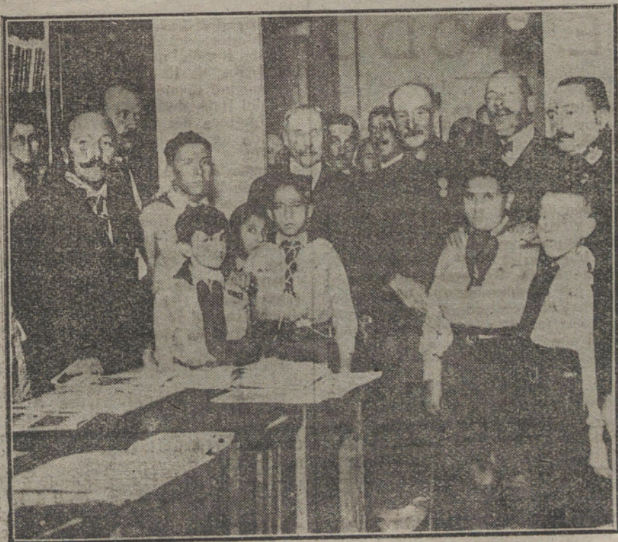
Visita de Sir. Robert Baden Powell al Club de los exploradores madrileños.

¿Adónde van á parar los hombres del desastre con su política de hostilidad á los regionalistas? Nosotros, que estamos bien informados de su pensamiento, podemos asegurar que lo único que se pretende es impedir que gobiernen los hombres de Cataluña, y escaquear el problema regionalista, haciendo imposible la reforma de la Constitución. Es decir, que en los momentos en que toda Europa se transforma, y en que Wilson, el ídolo de los viejos políticos españoles, quiere que se reconozca la personalidad de todos los pueblos y el derecho de cada cual á regir sus destinos, se intenta aplazar el único gran problema que tiene España: el de su reconstitución interior, presentándonos ante el mundo completamente desorganizados como nación.