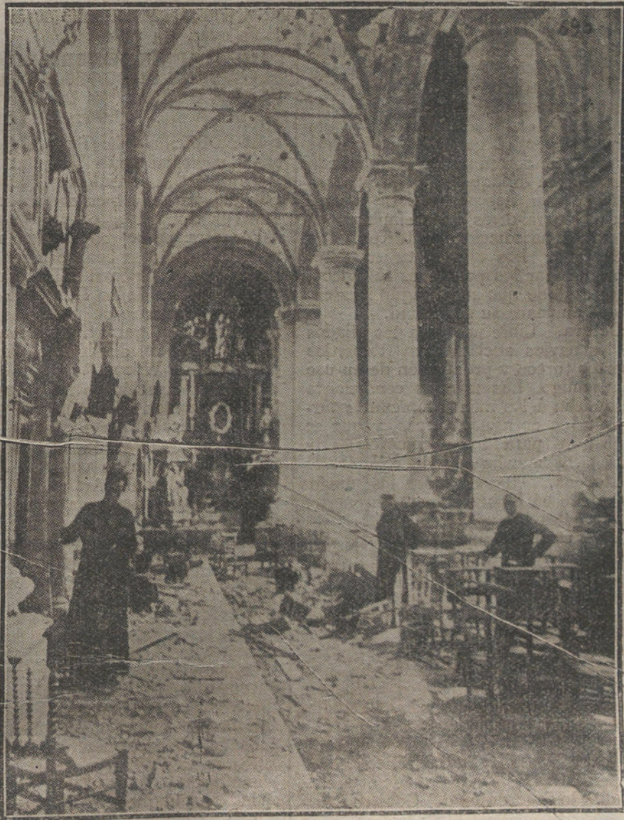
MIENTRAS SE ESPERA LA PAZ.—La iglesia de Walburga, en Bruselas, bombardeada por los aviadores ingleses.

Ahora, la incógnita es si los soldados civilizados de la Entente se resignarán a pasar los meses de frío en tierras desiertas, sin los recursos de un sistema de atrincheramientos que ningún general podrá pensar en establecer, y que no hay tiempo para construir antes de la primera helada. Para los gobernantes imperialistas de la