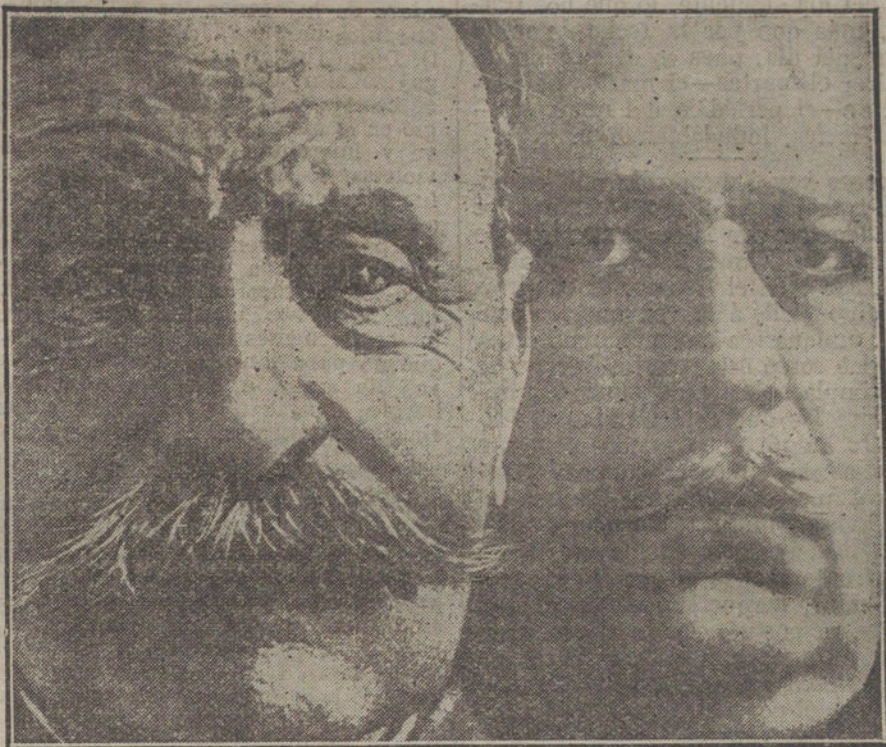
Foch es «el hombre del fuego»; también lo era Ludendorff, antes de que el fuego de allende el Rhin se apagara con la inundación bolcheviki...