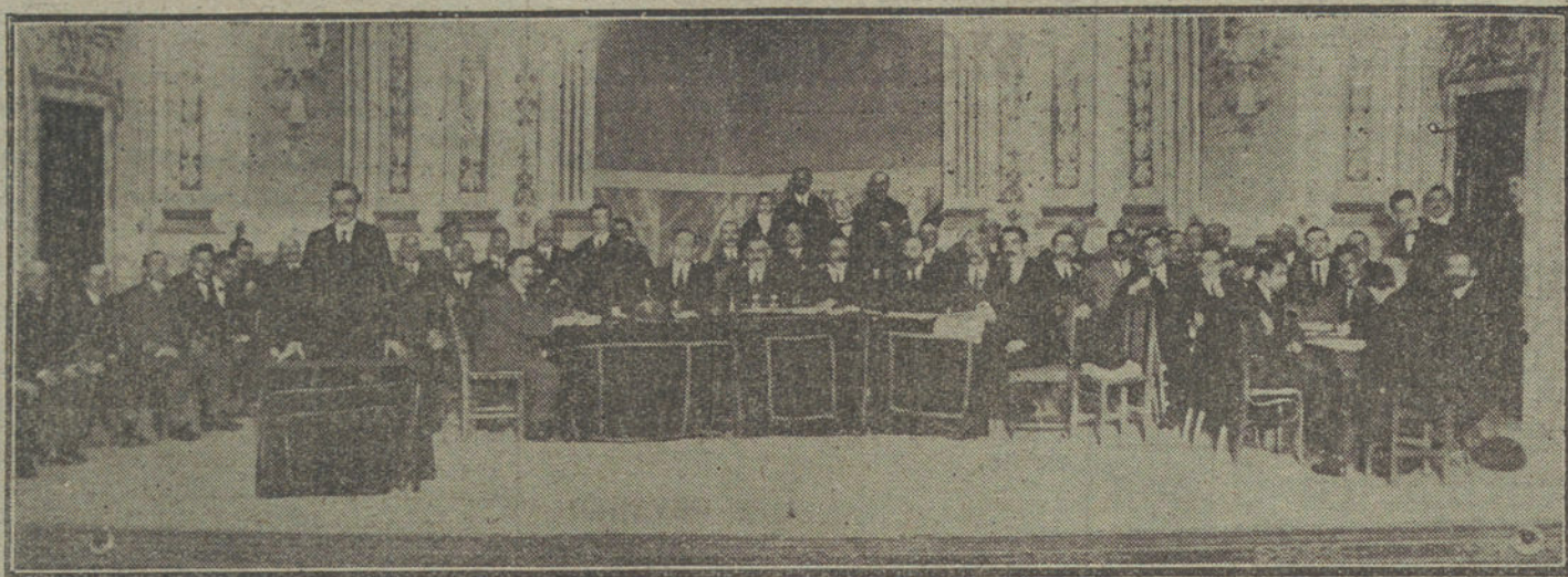
Presidencia de la Asamblea Nacional de protesta contra el aumento de la contribución, celebrada en el teatro del Centro.

Esta mañana, á las once, se celebró en el teatro del Centro la anunciada Asamblea industrial y mercantil, para protestar del anunciado aumento del 30 por 100 en la contribución.