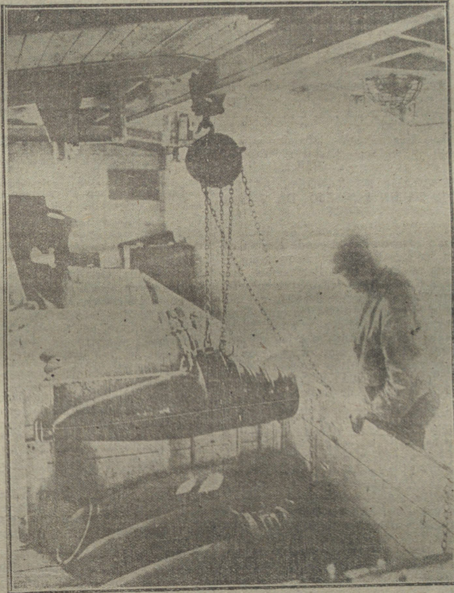
ENTRE LA PAZ Y LA GUERRA.—Cámara de municiones de un cañón francés de 305, montado sobre ferrocarril, apresado por los alemanes en las operaciones de resistencia del frente occidental.

Está próximo el instante en que Wilson ponga á prueba su sinceridad. Si cree que la paz que ha proclamado es la de la justicia imparcial, que garantice la vida libre y próspera de los pueblos; si, en su creencia, le confirman los sufragios de su nación la norma de conducta á seguir por el Presidente norteamericano, es tan simple como diáfana: damandar una vez más una respuesta categórica de sus asociados para que acepten la doctrina coisabida. Bien claro lo expuso en su discurso del 27 de Septiembre: