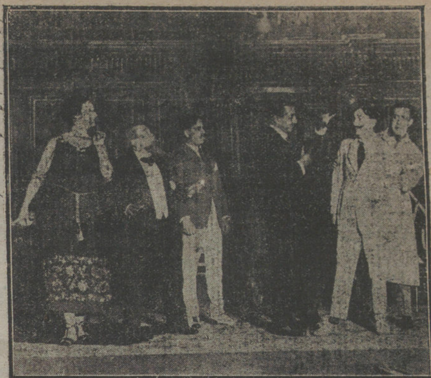
Escena final de la obra «La fórmula 3K3» estrenada anoche en el teatro de Cervantes.

contra manifestaciones concluyentes de autoridades y testigos variadísimos, que acreditan la inocencia de los procesados.