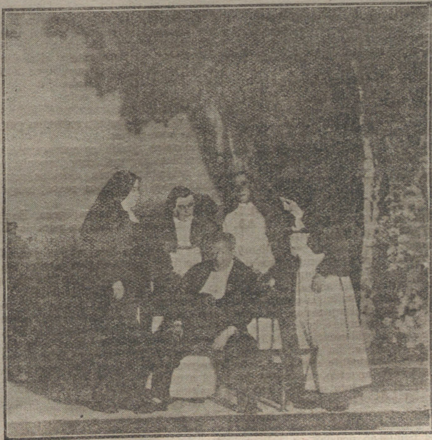
Una escena de «Sor Esperanza», obra que se estrena esta noche en el teatro de la Zarzuela.

Juego de alcoba con incrustaciones de limoncello y majajua, y comedor de caoba y palo rosa, se venden en buenas condiciones, garantizándose que están sin estrenar. Precio 35.499.—Administración LA TRIBUNA