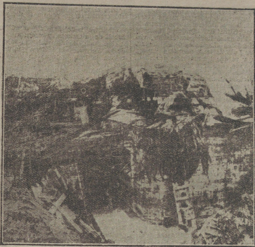
MIENTRAS LLEGA LA PAZ.—Posición de combate de un batallón alemán, protegido contra los aviones enemigos.

BERLIN. (Radiograma de Nauen.) Dicen de Helsingfors que el Gobierno finlandés ha contestado a la intención francesa de entrometerse en las cuestiones constitucionales finlandesas con una Nota, en la cual declara que, al proclamarse la independencia, existían aún las antiguas leyes fundamentales de los tiempos suecos, y que hoy rigen todavía. Según dichas leyes, Finlandia es una Monarquía. El Gobierno finlandés rechaza además la afirmación de que Finlandia era un vasallo de Alemania. Afirma que Alemania fue la única en hacer caso al grito de socorro finlandés. Añade que Finlandia no está ocupada por tropas alemanas, y que la responsabilidad constitucional de los miembros del Gobierno finlandés garantiza que la política del Rey elegido no esté en pugna con los deseos del pueblo.