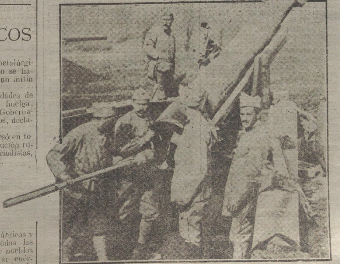
LOS ULTIMOS DIAS DE LA GUERRA. —Cañón francés de 155, en una posición de las avanzadas de Picardía.

Y aquella parálisis vino cautelosa, con astuto sigilo, presentándose de improviso y arrojando cuantos diques se intentó.