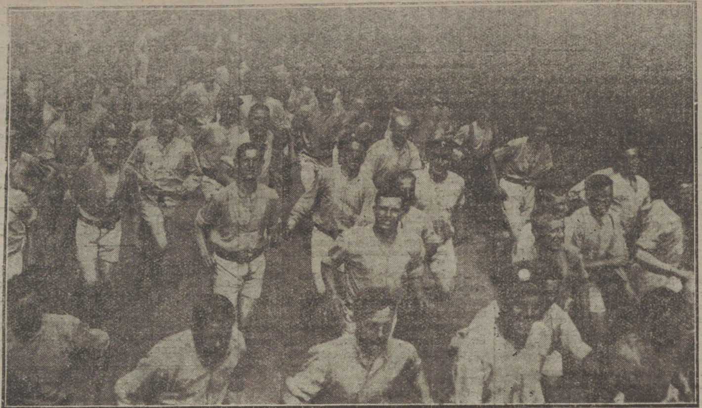
DESPUES DE LA GUERRA.—Heridos americanos, durante los ejercicios deportivos, que realizan en la convalecencia.

Yo, al saber que no era más que eso, no le hice caso. Sin embargo, aquí se atemoriza uno. Al que cae con la enfermedad, sea quien sea, lo llevan al hospital; se han suprimido temporalmente los honores á los militares de alta graduación que fallecen estos días; pero como eso alarmaba al repetirse inusitadamente, se han cerrado los teatros, los cinematógrafos, los cafés y hasta las reuniones al aire libre y todos los juegos de «sport». En este ambiente grisáceo se nota más la alarma, es más triste y más desconsolada. Los entierros se verifican de noche, y ese señor que va delante de ellos con sombrero de copa, levita y una placa en el