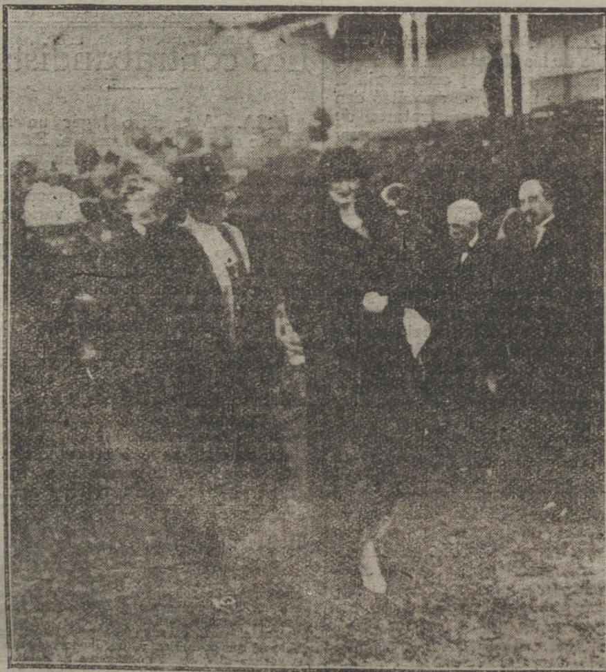
AYER EN EL HIPODROMO.—Su Majestad la Reina Doña Victoria, pasando por el stand.

El discurso del presidente británico parecía en sus comienzos, más que un resumen saldando los errores bélicos y diplomáticos de sus adversarios, un himno á la paz, un humanitario afán de poner término á la pelea, sin ulteriores represalias: pero ¡ay!, la discer-