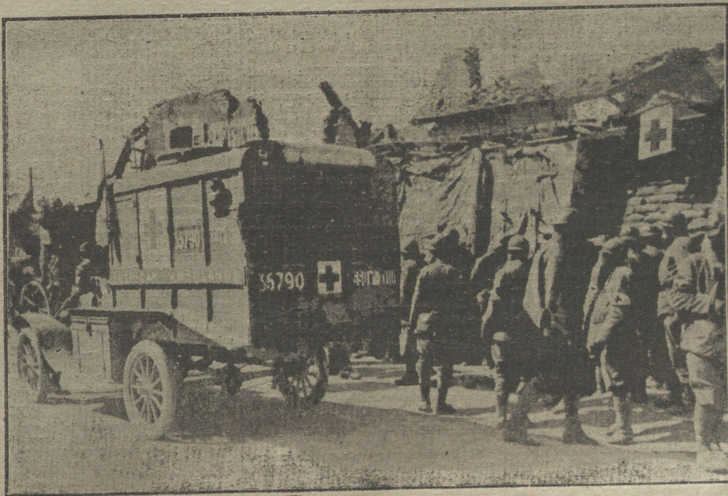
LAS VÍCTIMAS DE LA GUERRA.—Una ambulancia de la Cruz Roja americana, en una de las localidades evacuadas

En la reunión ha reinado una perfecta unidad de criterio.