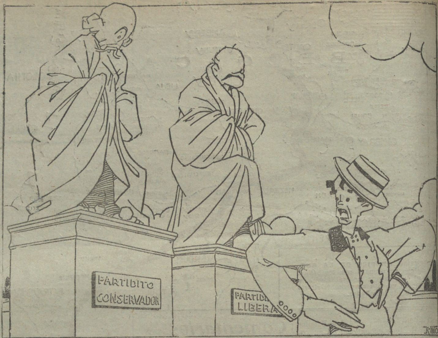
ESTOS MARMOLES PARECE... —«¡Alzas, fantasmas vanos,—que os volveré con mis manos—á vuestro lecho de piedra!» (Caricatura de K. HIFO.)

El «Lokal Anzeiger», denominado ahora «Redglad», se ha convertido en el órgano de los socialistas más radicales del grupo de Spartacus. Y la «Gaceta de Alemania del Norte», llamada ahora «La Int. nacional», será editada en el porvenir por el primer editor en Leipzig, de la «Gaceta del Pueblo».—Hallet.