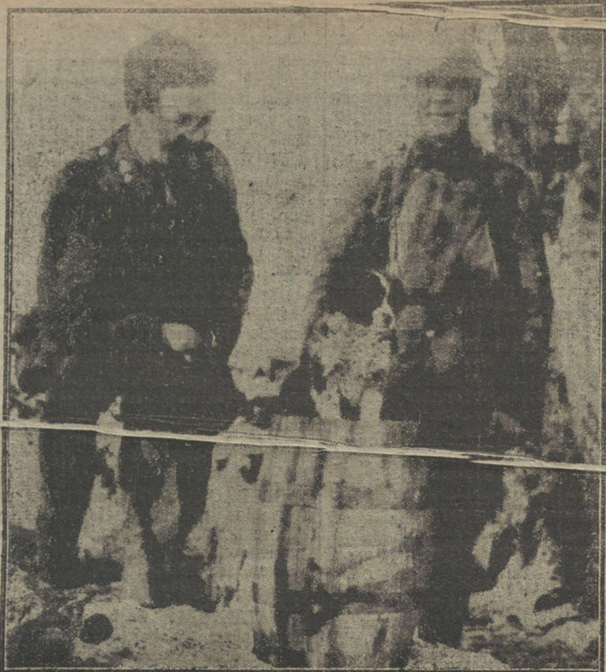
LA GUERRA, PINTOESCA.—Un perro «mascota», del Ejército francés.

Las monedas que usamos en este país, que nos dan, que damos, que llevamos en el bolsillo, son una lección de política suiza práctica y rotunda. Son todas de plata, grandes duros, muchas monedas de dos francos, muchas pesetas y muchos dos realitos. Los duros son, sobre todo, franceses, italianos y belgas;