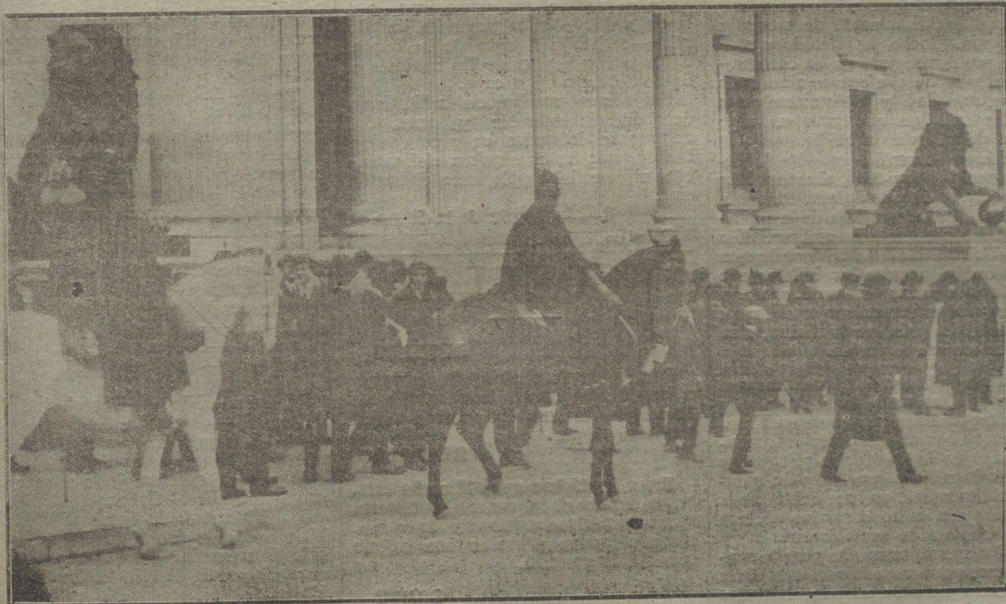
Aspecto de los alrededores del Congreso, momentos antes de la sesión, y espectáculo que ha ofrecido la fuerza pública, al disolver la manifestación de protesta contra el Gobierno.

Tercera parte.—A. Vila: El año mil. Poema sinfónico (primera vez). G. Faure: Pavane. Weber: Euryante. Obertura.