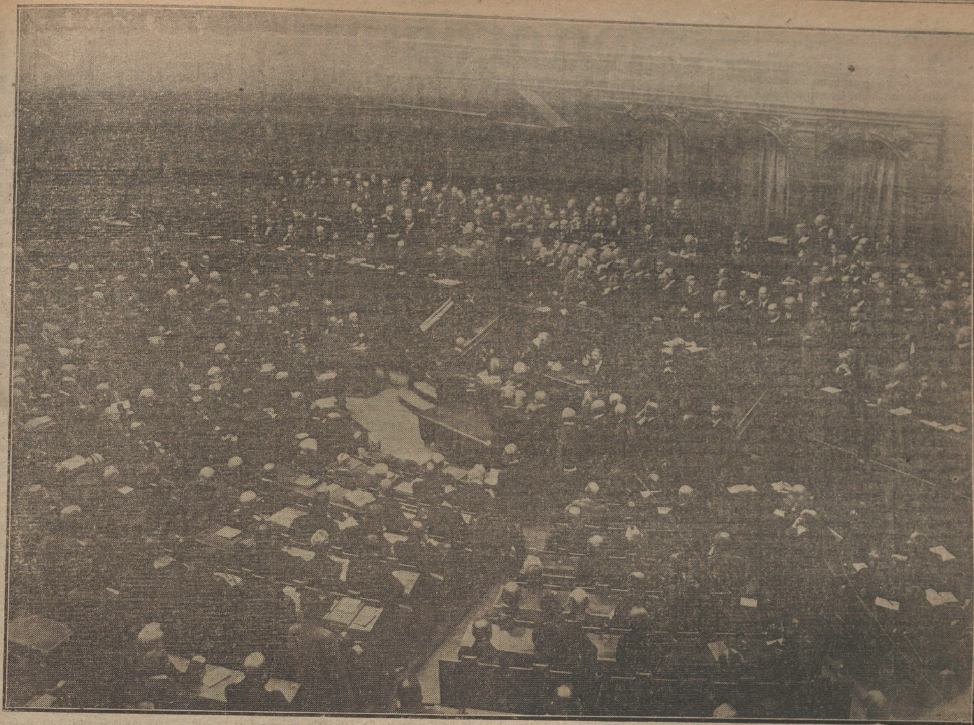
COMO EMPEZO LA PAZ.—Aspecto del Reichstag durante la lectura de la primera Nota alemana á Wilson.