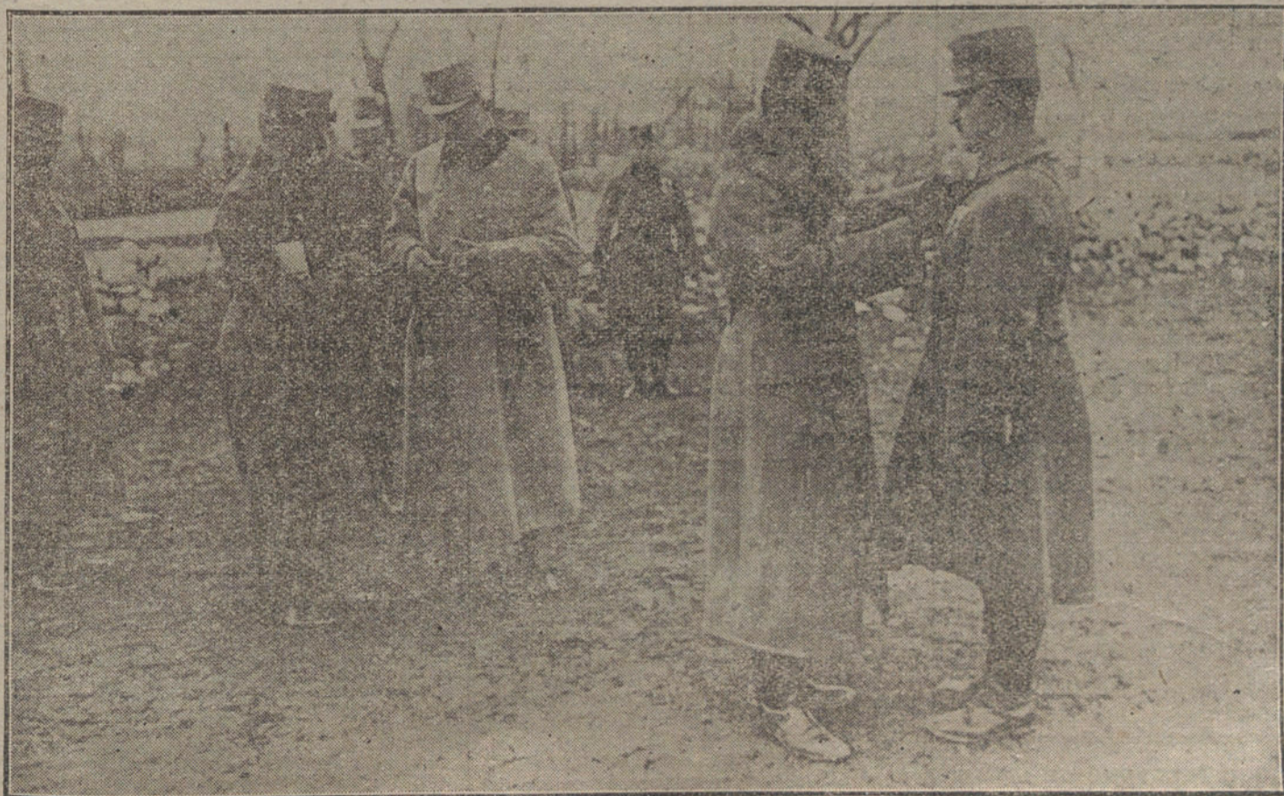
RECUERDOS DE LA GUERRA.—El Emperador Carlos, en una de sus visitas al frente balcánico, condecorando á los soldados distinguidos.

Fué conducido á una botica próxima y allí vieron que se trataba de un caso de sonambulismo. En un coche le trasladaron á su casa, y aunque ya despierto, aún no se daba clara cuenta de cuanto le había ocurrido.