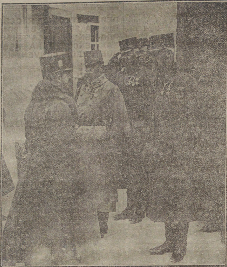
RECUERDOS DE LA GUERRA.—El Emperador Carlos, durante su permanencia en el frente italiano.

Al mismo tiempo, los alemanes reciben la misma ración señalada a las fuerzas aliadas.—Hallet.