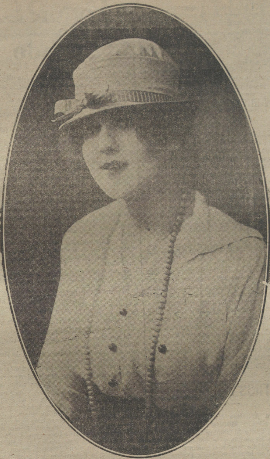
Senillísima gorra de raso azul, con banda roja, modelo de la casa Alice.

denburg en las batallas de Tannenberg y de los lagos masurianos, estamos á merced de una banda de chovinistas, sin encontrar amparo alguno?»