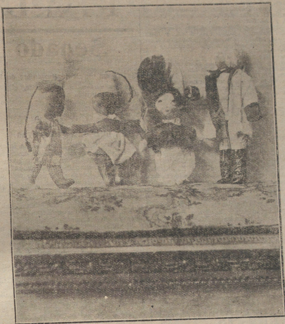
Modelos para la confección y vestido de muñecas de trapo.