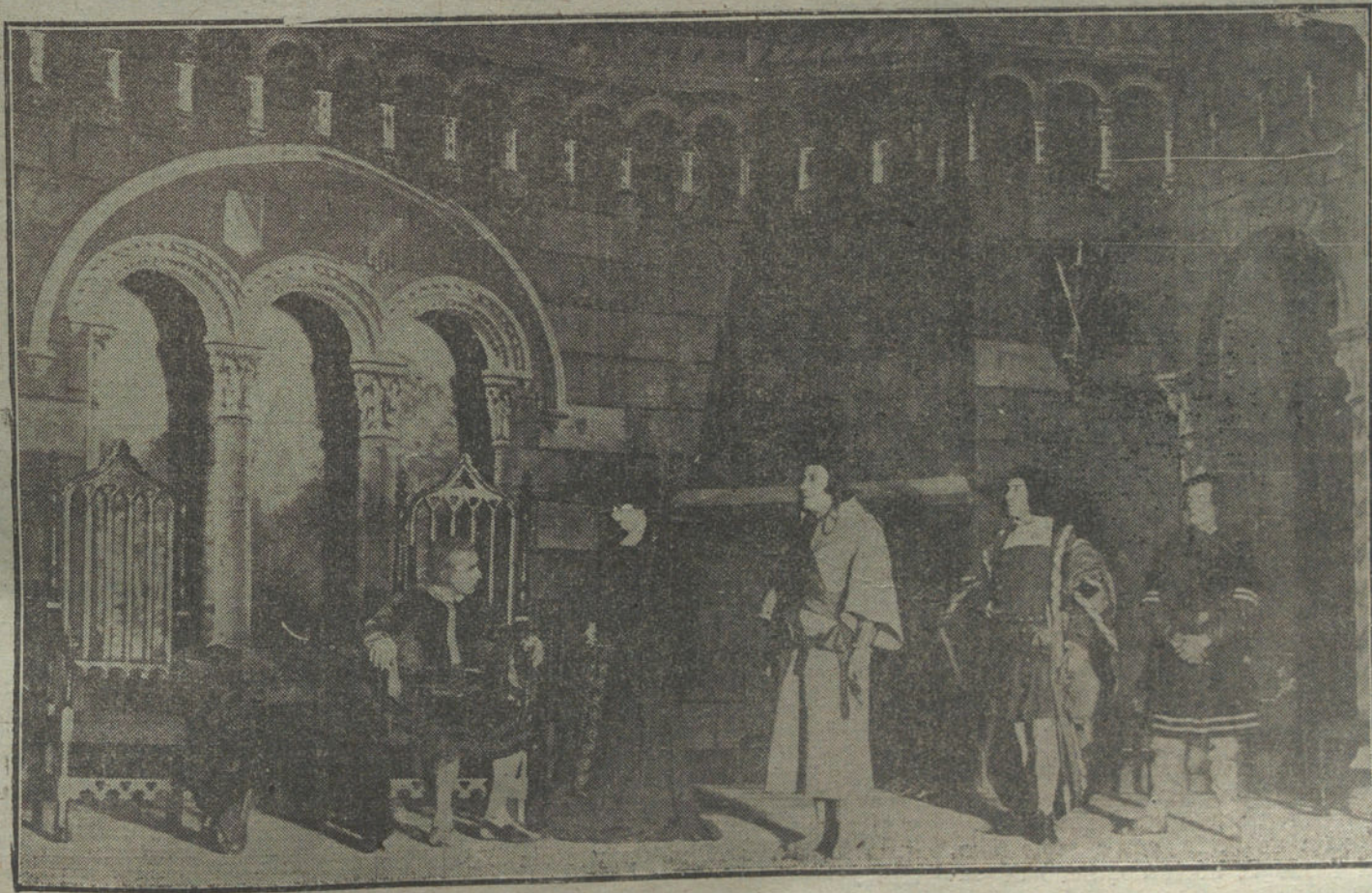
Una escena de la refundición de la obra de Lope de Vega, «Las famosas asturianas», estrenada anoche en el teatro de la Zarzuela.

«Conociendo los nobles ideales de usted y los generosos sentimientos de su corazón, le suplicamos trate en su periódico de la cuestión de indulto, propuesto en el Congreso, y que aceptó el señor ministro de Gracia y Justicia, deseando que sea total, o al menos de la mitad de las condenas, sin excluir a nadie, para conmemorar dignamente y con esplendor el momento sublime de la paz, la nueva aurora de los derechos del hombre. De su elevado entendimiento esperamos el apoyo que forme opinión de piedad para nuestras desgracias, y vuelva a renacer la alegría en nuestras casas, entre tantas familias que lloran.»