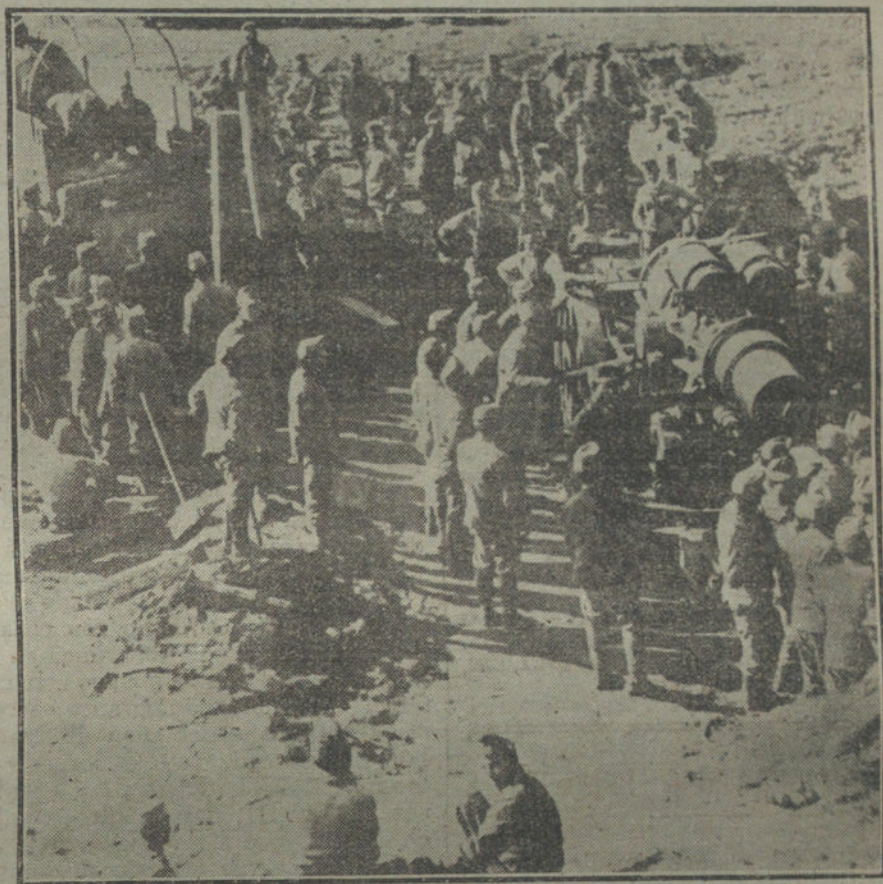
ANTECEDENTES DEL ARMISTICIO.—Tropas austrohúngaras, retirando un pesado mortero de sitio, de los lugares del frente italiano.

He aquí el peligro para los aliados. Mientras se deja a Alemania en condiciones de vitalidad, las Potencias occidentales, las Potencias de todo el mundo, tendrán frente a sus egoísmos comerciales la competencia de ese gran pueblo que trabaja más, que rinde más producto y que vende, por lo tanto