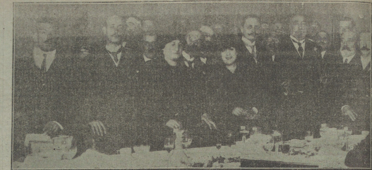
Mesa presidencial del banquete celebrado ayer por los concurrentes al Congreso Nacional de Pesca Marítima.

Pero este recuerdo trae a mi memoria, como de la mano, otro prodigio de-