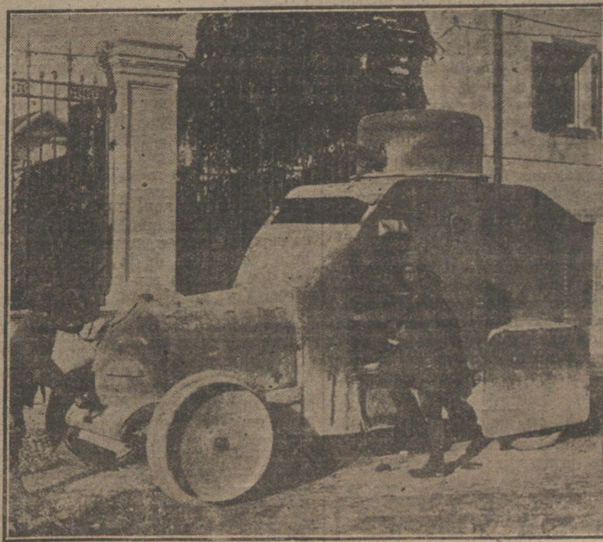
DESPUES DEL ARMISTICIO.—Uno de los tanques italianos, cogidos por los austriacos durante la campaña, y que habrá de ser devuelto, en virtud del armisticio.

Esperamos que el señor ministro de la Guerra atienda este caso, si cree que es de justicia, siquiera sea para quitar del ánimo toda idea de favoritismo.