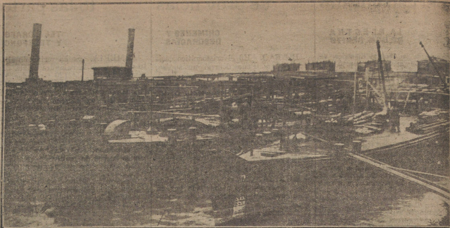
DE LA GUERRA A LA PAZ.—Barcazas preparadas en el Danubio, cerca de Svislov, para la desmovilización de las tropas austriacas que operan en Rumania.