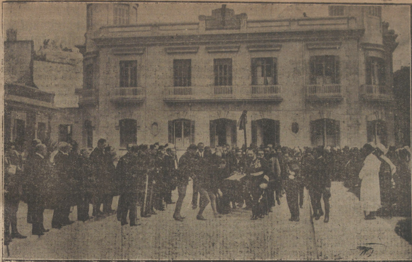
ENTIERRO DEL GENERAL JORDANA EN TETUAN.—Jefes y oficiales sacando el féretro del Palacio de la Residencia.

documentos que se encontraron sobre el cadáver de Wamba, en el monasterio de Pampliega, los cuales, y un paje de cuadros, fueron entregados a Felipe II cuando visitó el sepulcro de su difunto compañero y gótico antecesor, y archivados luego en la biblioteca del Escorial, sirvieron más tarde para que un canónigo de Sigüenza, llamado Rui Pere, fabricase un auto sacramental, que es el mismo que, un poco modificado y con varios personajes nuevos, se presentará mañana en la Comedia.