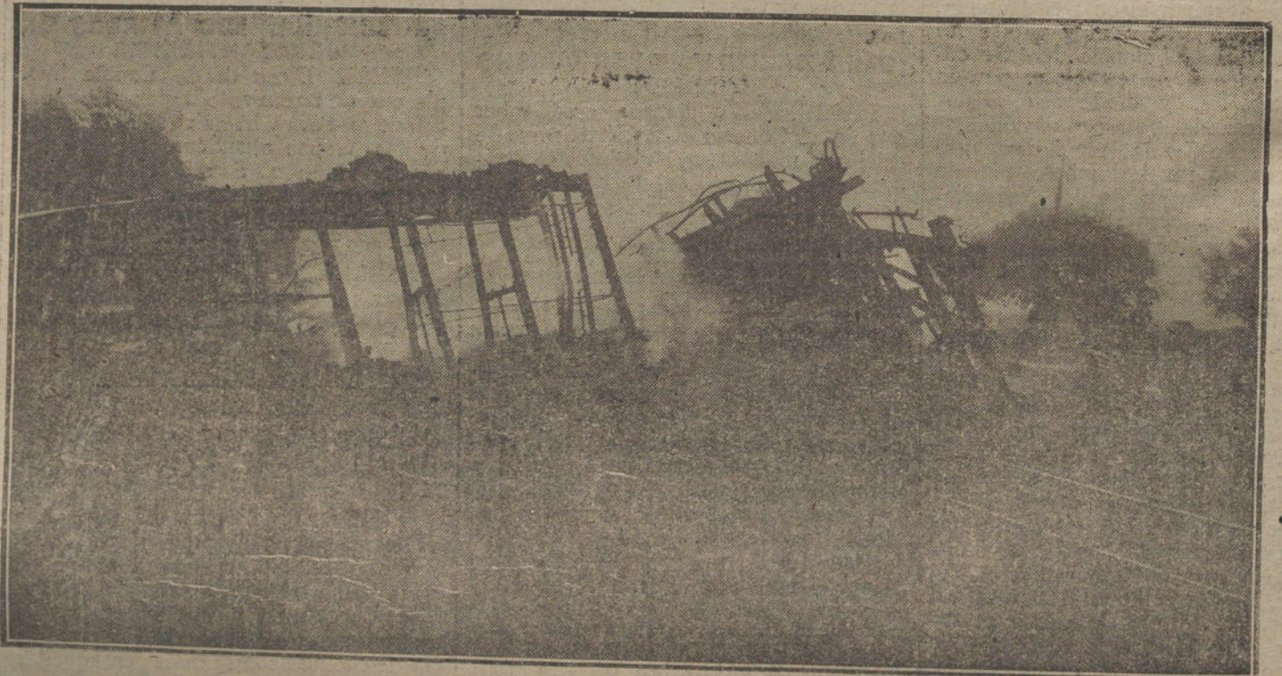
CATASTROFE FERROVIARIA.—Posición en que quedaron los dos trenes de mercancías después del choque ocurrido el día 23 ante las estaciones de Mora la Nueva y Arco.