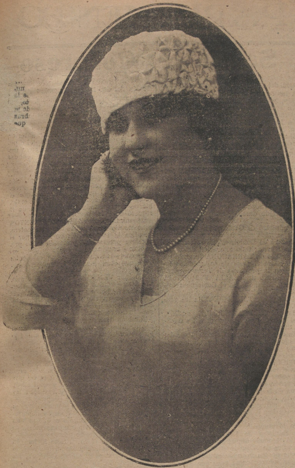
Sencillo gorro de satén plisado ó terciopelo de seda, en color claro, modelo de la Casa Amelie.