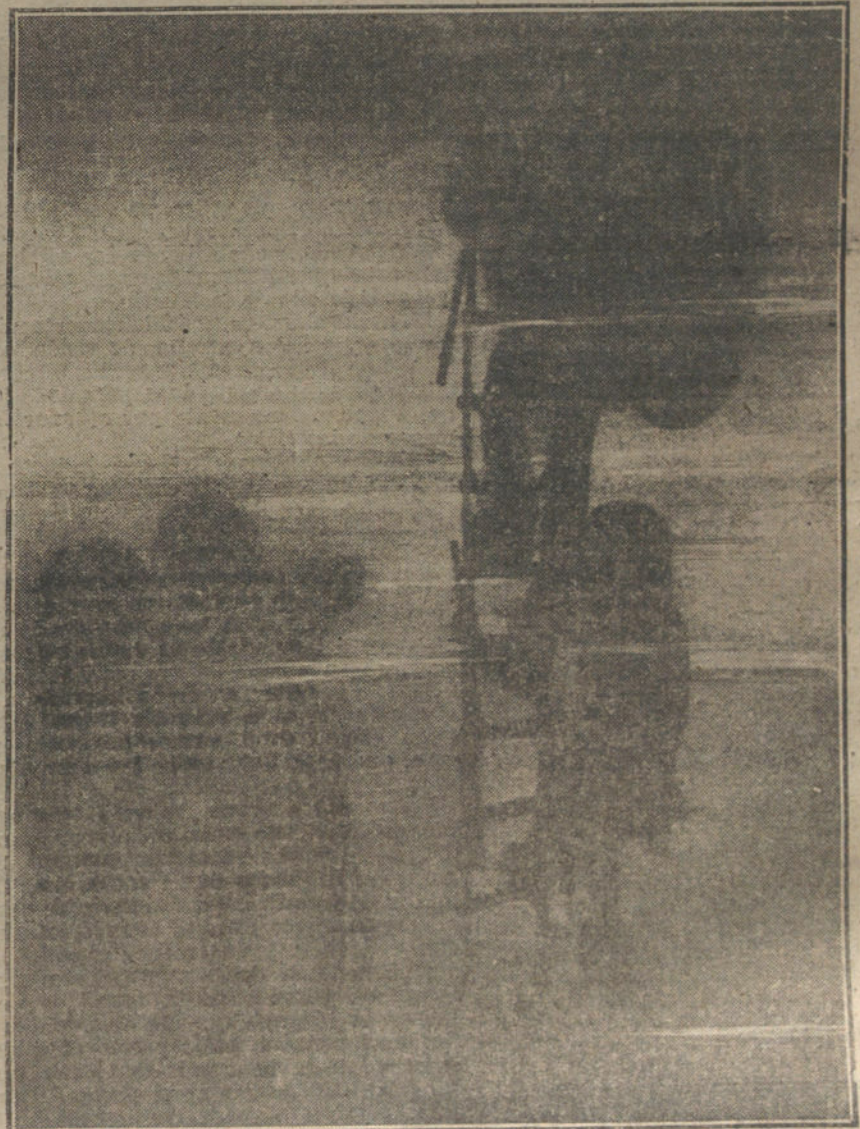
Los buzos del «Salvage Department», ciegan, con elementos provisionales, los orificios abiertos por el torpedo en el casco de un buque.

Había de ser Inglaterra, la nación más castigada por la guerra en el mar, quien buscara con mayor empeño la