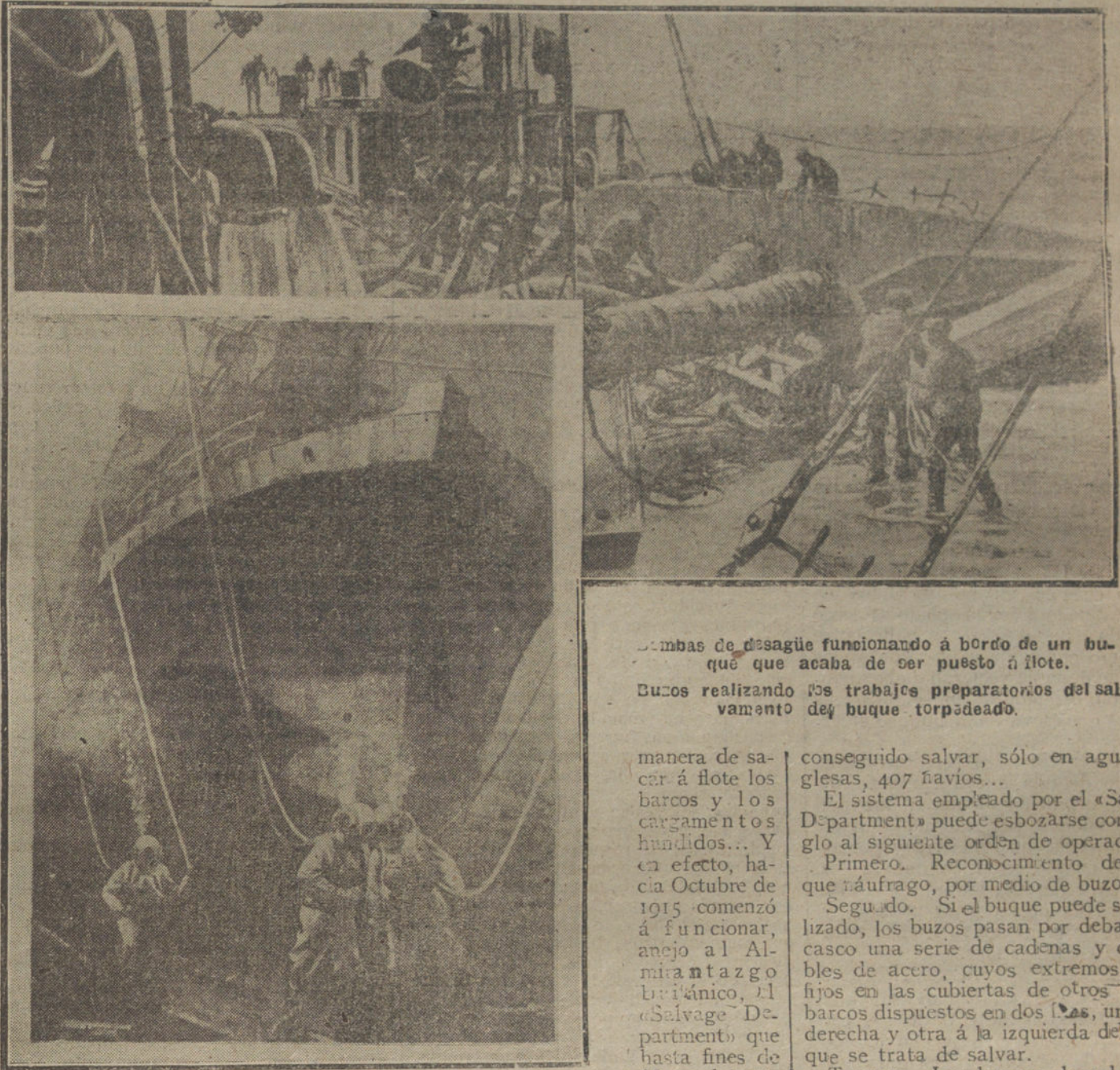
Bombas de desagüe funcionando á bordo de un buque que acaba de ser puesto á flote.

El detenido, a pesar de los telegramas acusatorios, niega su culpabilidad.